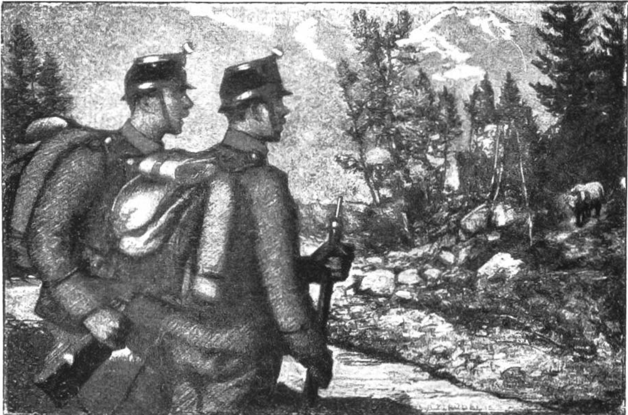
Schweizersoldaten sehen einen Bären am Spöl im Nationalpark.