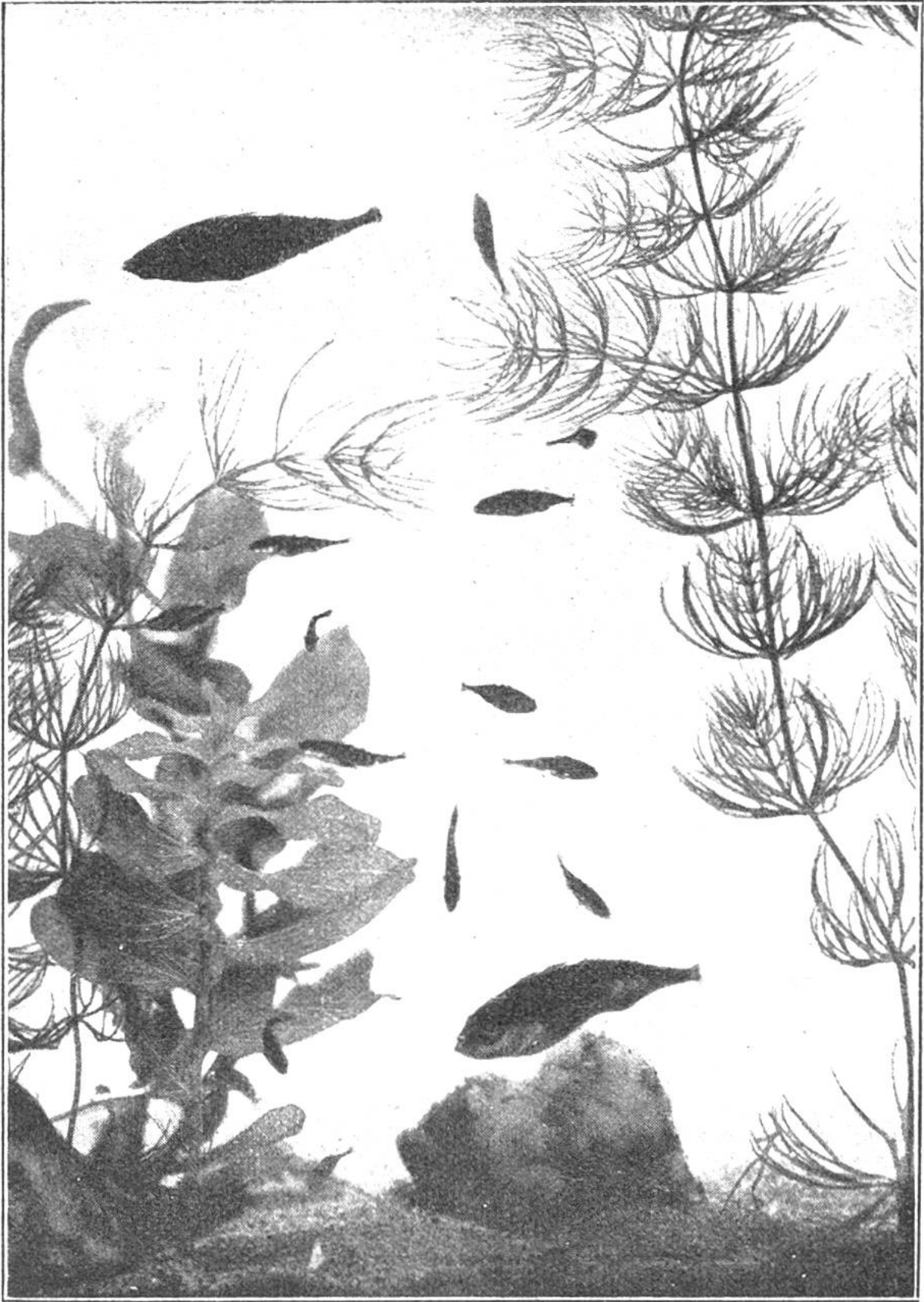
In Sischleins Wundergarten: Dreistachliger Stichling mit Jungen. Photographie nach Natur.