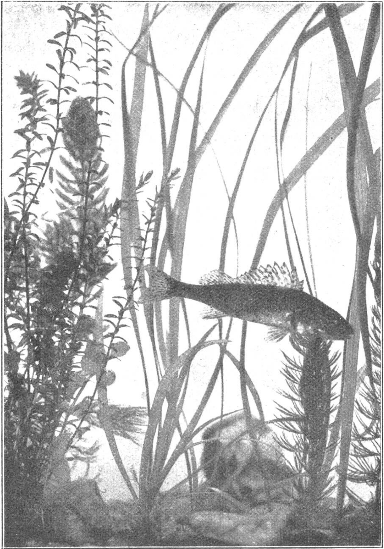
In Fischleins Wundergarten: Kaulbarsch Photographie nach Natur