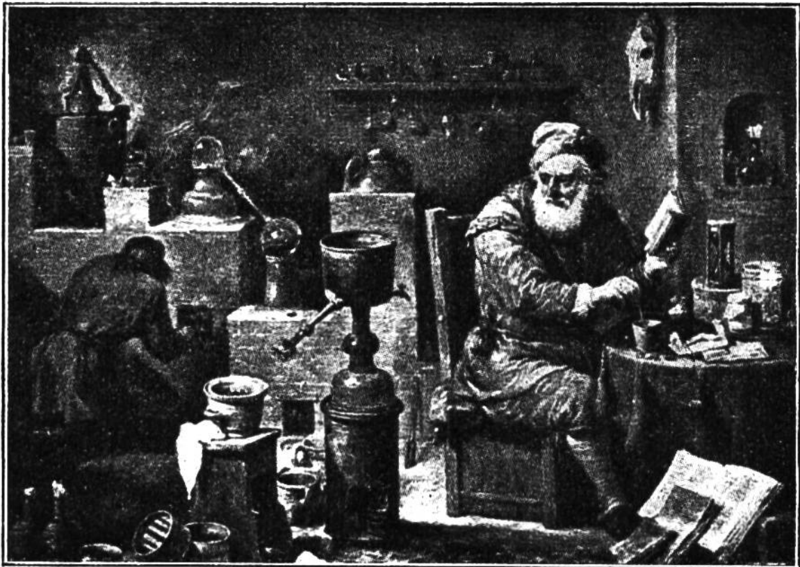
„Ein Alchimist.“ Gemälde von David Teniers, d. J., Antwerpen. 1610—1690.