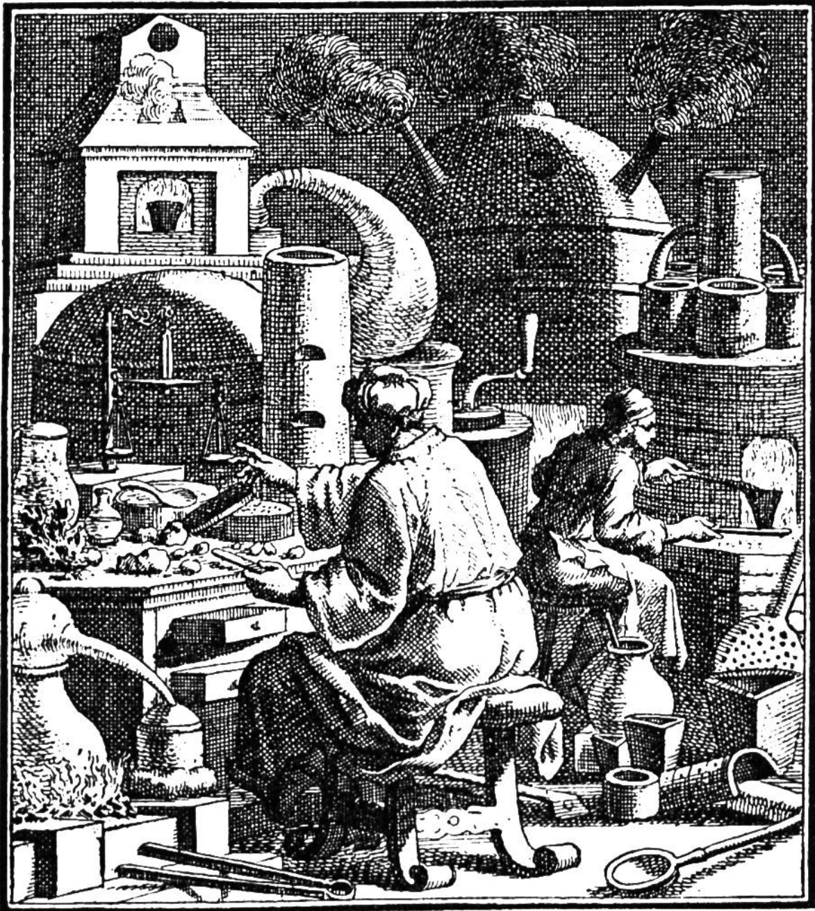
Der Goldmacher in seiner Behausung, umgeben von phantastisch geformten Gefäßen.

gereien Eingang in die Alchimie. Fürstliche Herren suchten ihren durch Mißwirtschaft und Verschwendung bedrohten Haushalt auf bequeme Art wieder herzustellen, indem sie selbst zur Goldbeschaffung Alchimie betrieben oder Leute anstellten, die sich „Alchimisten“ nannten, gewöhnlich aber abgefeymte Betrüger waren.