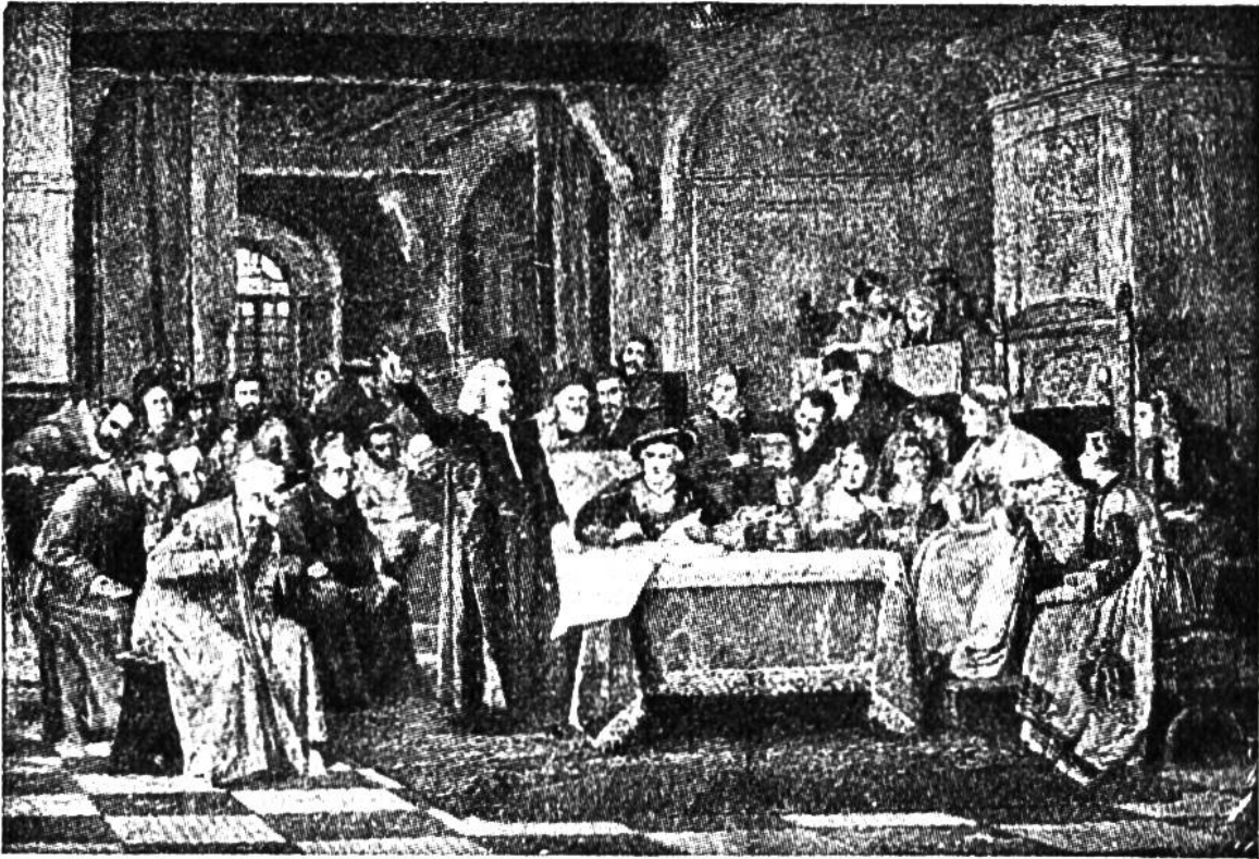
Kolumbus macht das spanische Königspaar, Ferdinand und Isabella von Aragonien, mit seinen Plänen bekannt.

Die Seemannstaten der Portugiesen konnten im großen Nachbarreich der Spanier nicht lange verborgen bleiben. Als der Genuese Christoph Kolumbus am spanischen Hofe Gönner für seine Pläne zur Entdeckung eines Seeweges nach Indien suchte, fand er bald Gehör. Kolumbus trat mit dem großartigen, vom Italiener Toscanelli inspirierten Vorhaben auf, nach Westen zu fahren; war die Erde wirklich eine Kugel, dann mußte auch in dieser Richtung der Weg nach der Insel Zipangu (Japan) und dem Märchenlande Indien führen. Der große Entdecker ahnte nicht, daß die Reise westwärts viel, viel länger dauert als nach Osten. Am 3. August 1492 unternahm Kolumbus sein tollkühnes Wagnis und steuerte mit 3 Schiffen und 120 Mann Besatzung vom Hafen Palos nach Westen ins weite, unbekannte Weltmeer hinaus. Nach einer Fahrt voller Gefahren — zu den Schrecken des Meeres gesellte sich fast im Angesicht des Zieles noch die offene Meuterei seiner entmutigten Schiffsleute — ertönte frühmorgens am 12. Oktober von der „Pinta“ der erlösende Kanonenschuß, welcher nach Wochen bangen Wartens und oft getäuschter Hoffnung endlich die Freu-