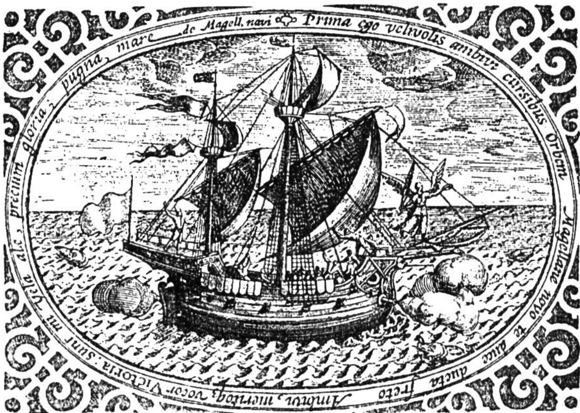
Magalhães' Schiff, die „Victoria“.

deckungsfahrten. Auf einem dieser Streifzüge (1513) in die Landenge von Darien (Panama) berichtete ein eingeborener Häuptling dem spanischen Anführer Balboa von einem südlichen Meere, das vom Gipfel eines nahe liegenden Waldgebirges aus gesehen werden könne. Balboa machte sich unverzüglich auf den Weg, bestieg allen voran den Gipfel und fiel im Angesicht des fernen, in unabsehbare Weiten sich dehrenden Ozeans auf die Knie nieder, „der Vorsehung dankend für die ihm zuteil gewordene Gnade“. Die Folgen der Entdeckung Balboas waren unermesslich; jetzt konnte nicht mehr daran gezweifelt werden, daß das von Kolumbus entdeckte „Indien“ nicht ein Teil Ostasiens war, sondern daß es einen neuen Weltteil für sich bildete (Amerika). Diese Erkenntnis hatte den ersten Anstoß zur spätern Weltumsegelung Magalhães' und zur Eroberung Perus gegeben.