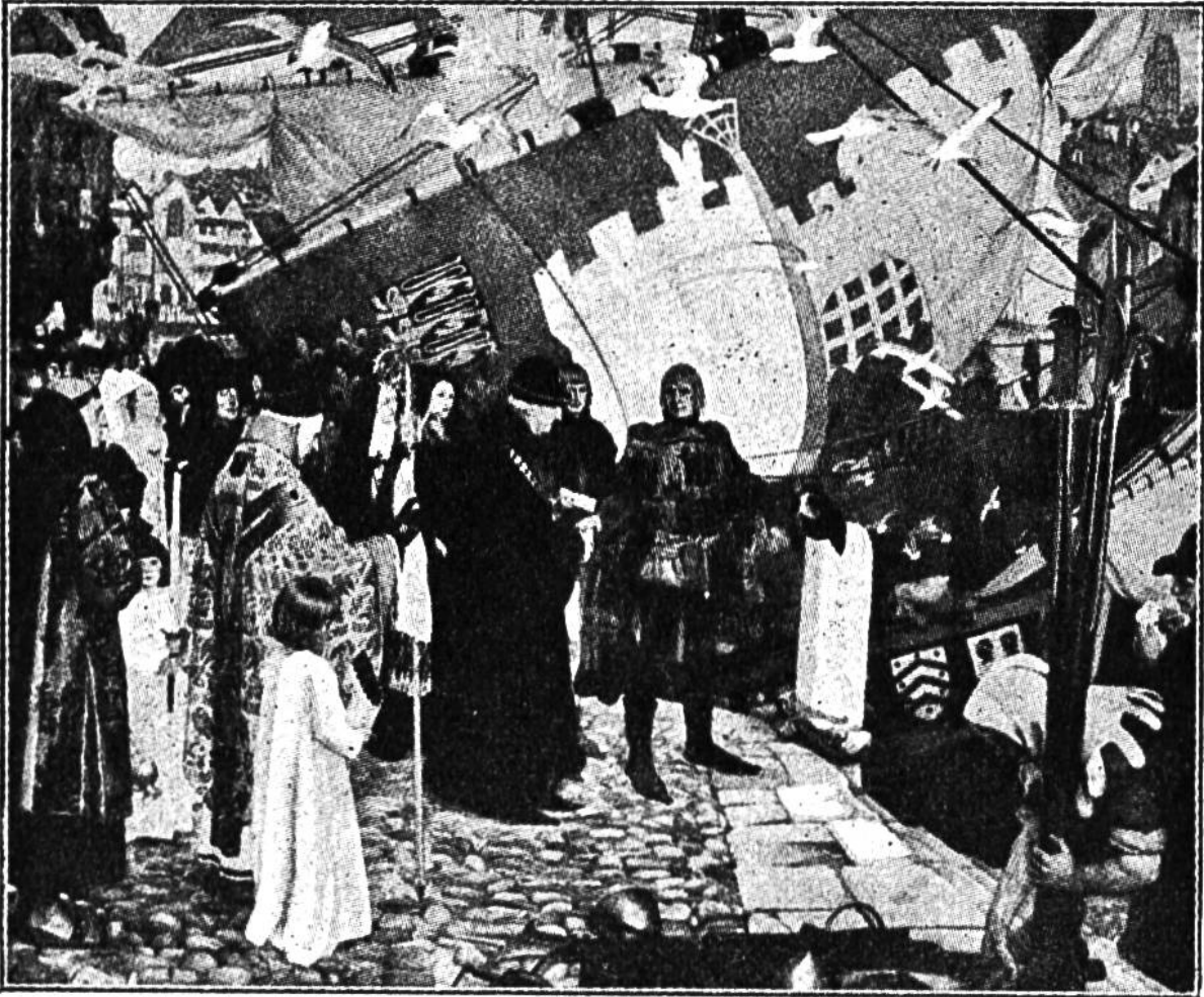
Ausreise von Giovanni Cabotto zur ersten Entdeckungsfahrt.

bis in die Nähe des heutigen Kap Hatteras gelangte. Die Haupttätigkeit zur Entdeckung des Seeweges nach Indien entfalteten aber nach wie vor Spanier und Portugiesen. Durch den Spruch des Papstes Alexanders VI. war 1494 den Spaniern die westliche Hälfte der Welt, etwa vom 46. Längengrade an als Schauplatz für ihre Unternehmungen zugeteilt worden, den Portugiesen die östliche Hälfte. — Die großartige Seemannstat Kolumbus' hatte bei den Portugiesen mächtigen Nachhall gefunden. Auch sie rüsteten unentwegt zu neuen Fahrten. 1497 fuhr Vasco da Gama mit drei Schiffen aus dem Hafen von Lissabon, um ostwärts segelnd nach Indien zu gelangen, koste es was es wolle. Und wirklich, sein Unternehmen wurde von Erfolg gekrönt. Nach monatelanger Fahrt landete da Gama in Melinde (Ostküste Afrikas); dort erbat er sich vom arabischen Fürsten des Landes einen Lotsen und kam unter dessen Führung Ende Mai 1498 endlich in Kalikut an. Der östliche Seeweg nach Indien war entdeckt! Zwei Jahre später stieß ein anderer