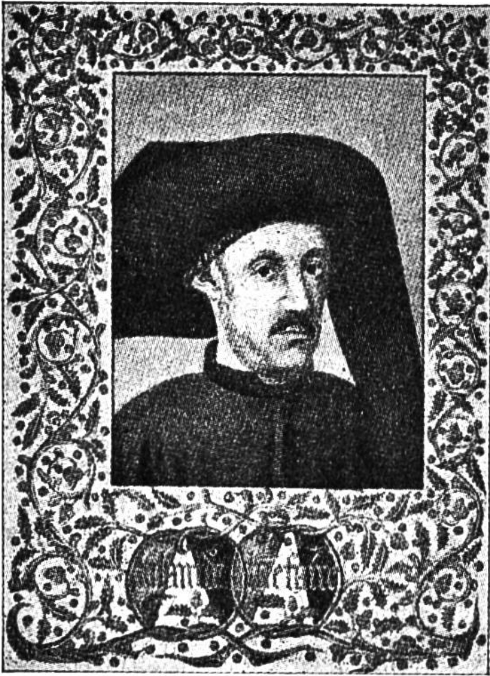
Prinz Heinrich der Seefahrer. Nach einem Miniaturgemälde in einer portugiesischen Handschrift aus dem Jahre 1450.

rikanische Küste erreichten; sie benannten das Land (die vorspringende Küste des heutigen Staates Massachusetts) Winland, nach den wilden Reben, welche sie dort fanden. Am wenigsten erforscht blieb der Süden, doch sollen auch hier unerschrockene Phöniker schon im 6. Jahrhundert v. Chr. eine große Seemannstat vollbracht haben, indem sie ganz Afrika umsegelten. Erst im 13. Jahrhundert unternahm Genuesen das gleiche Wagnis; der Ausgang dieser Unternehmung ist unbekannt. Die Ita-