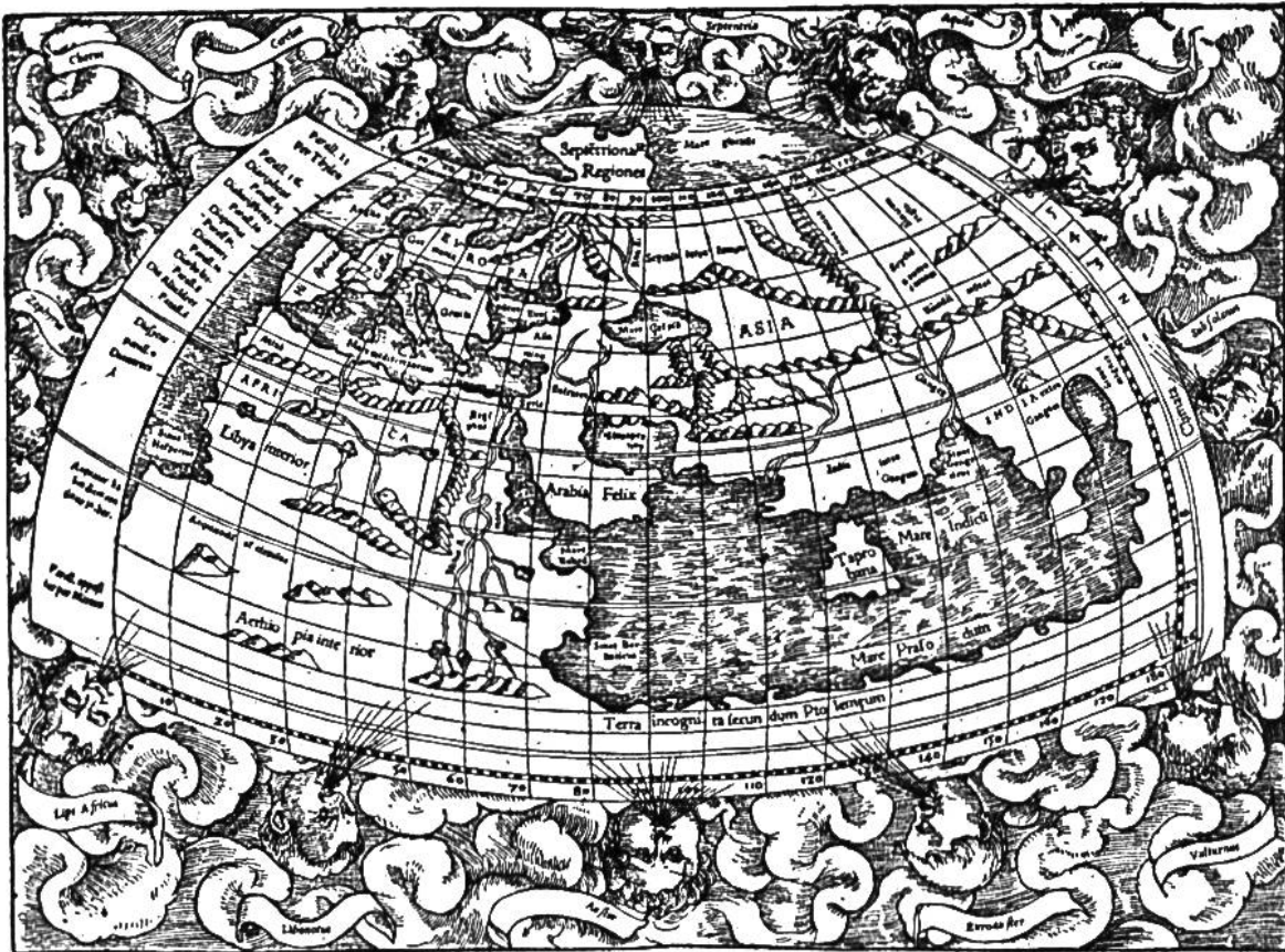
Erdkarte aus der Geographie des Ptolemäus. Basler Ausgabe von 1545.

großen Zeitalters für das Abendland. Die Annahme von der Kugelgestalt der Erde war durch die Fahrt Magalhães' bestätigt worden. Die Wissenschaften, besonders Geographie, Naturkunde und Astronomie wurden ungleich reichert und zum Teil sogar umgestaltet. Handel und Gewerbe nahmen durch die Verwertung der überseeischen Erzeugnisse einen ungeahnten Aufschwung. Die Ausbreitung des Christentums über die ganze Erde war möglich geworden. Die europäischen Seemächte kamen durch den Besitz ihrer Kolonien zu besonderer Geltung. Die Entdeckungsvölker, Spanier und Portugiesen, indes, vermochten nicht lange ihre natürliche Vorherrschaft zu behaupten. Sie waren wohl kühne Eroberer und furchtlose Kämpfer, aber keine weisen Verwalter. Ihr mächtiges Kolonialreich bröckelte nach und nach ab. Die Völker des nördlichen Europa traten auf den Plan, und an sie ging zum größten Teile dasjenige über, was die Nationen am westlichen Mittelmeer in mächtigem, unserer Bewunderung würdigem Impuls wohl zu entdecken, aber nicht zu bewahren vermochten.