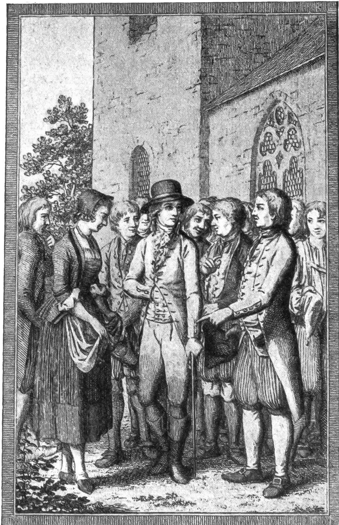
Arner verweist dem Untervogt sein Tun den Armen und Notdürftigen gegenüber.