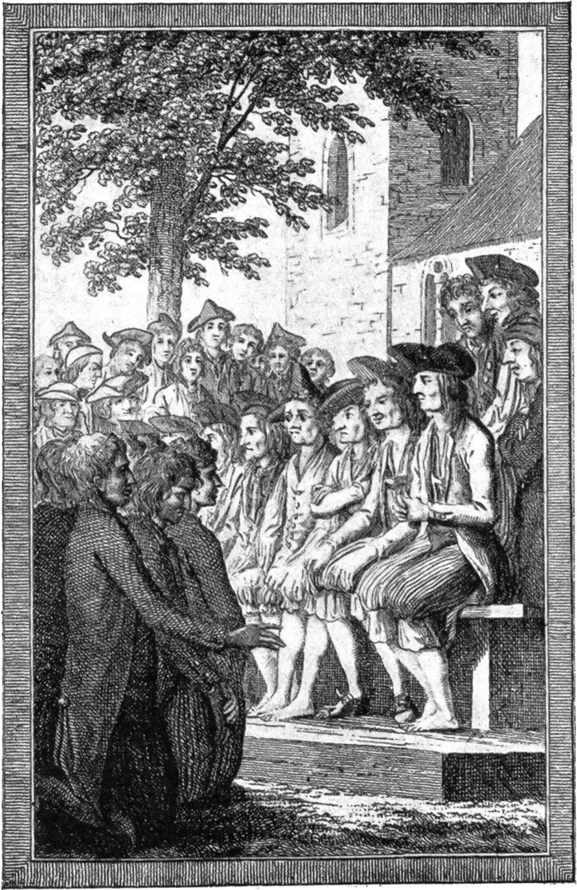
Die schuldigen Vorgesetzten leisten vor allem Volk Abbitte.