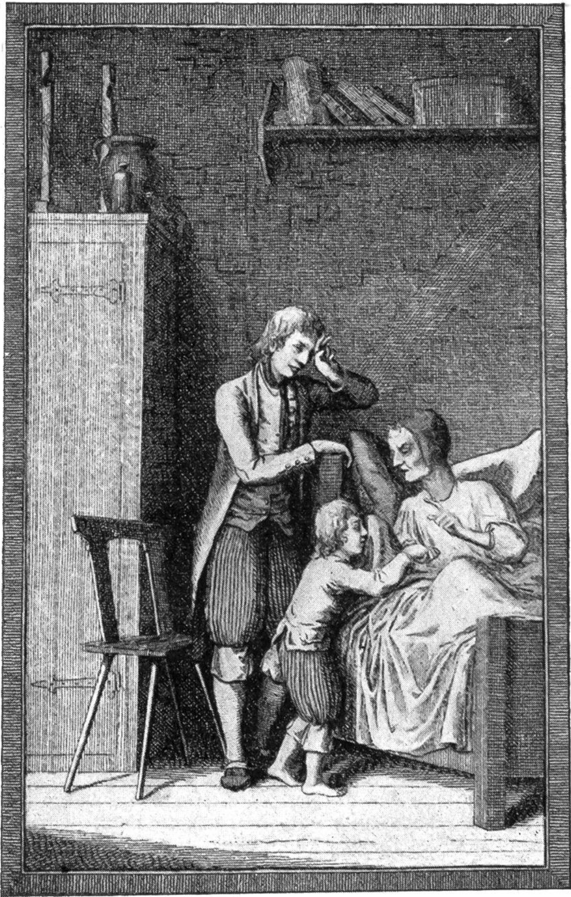
Ruedeli gesteht der Großmutter, er habe Erdäpfel gestohlen.