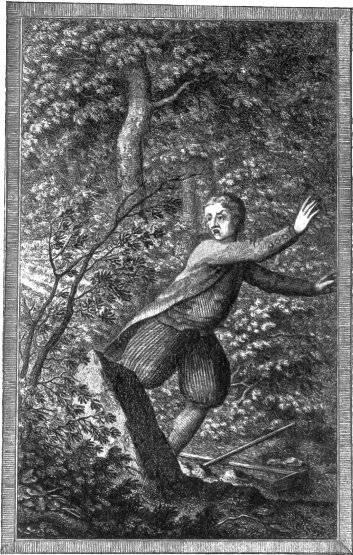
Der abergläubische Hummel glaubt sich vom Teufel verfolgt.