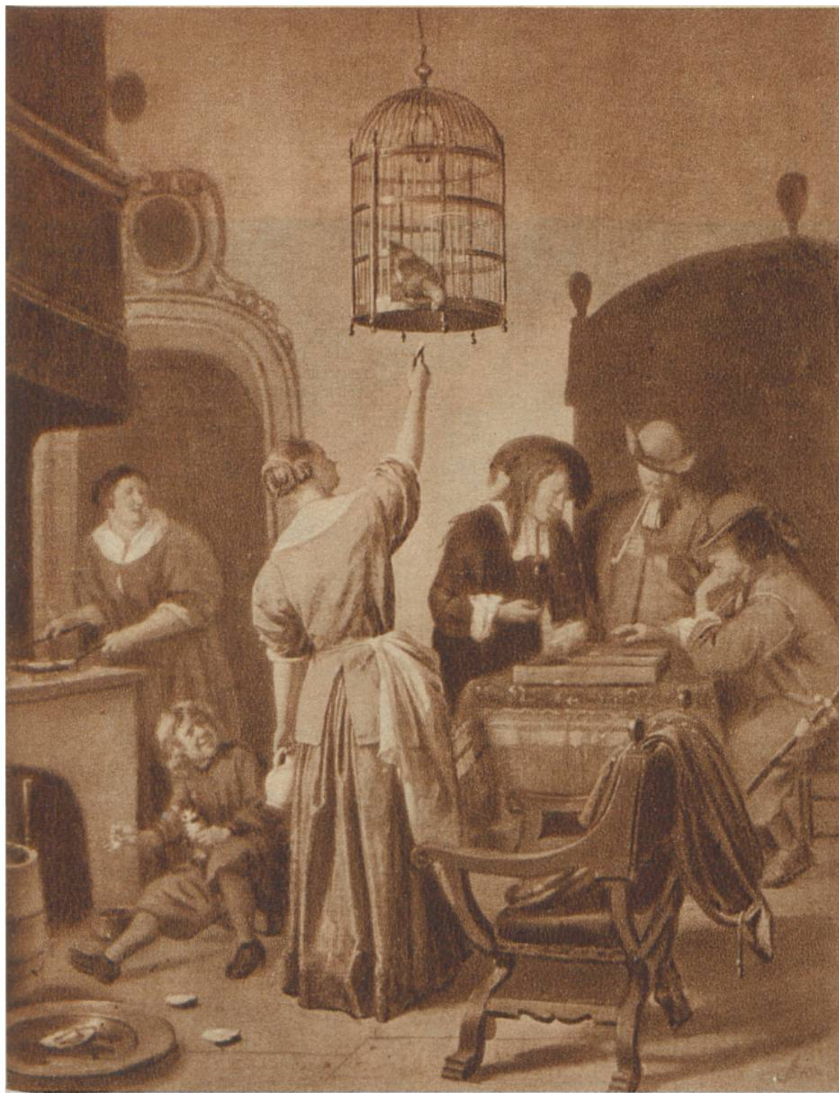
Der Papageienkäfig, von Jan Steen, Leiden, 1626—1679. Rijksmuseum, Amsterdam.