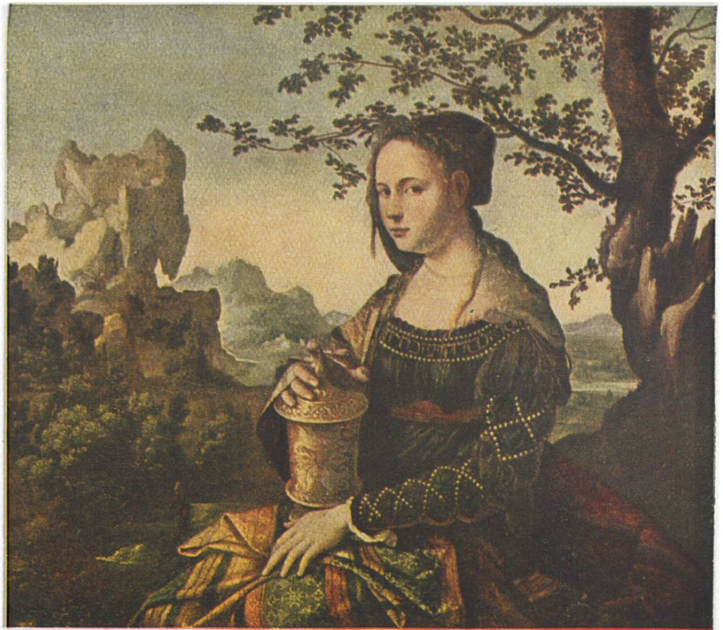
HEILIGE MAGDALENA von Jan Scorel, Utrecht 1495—1562. Rijksmuseum, Amsterdam.