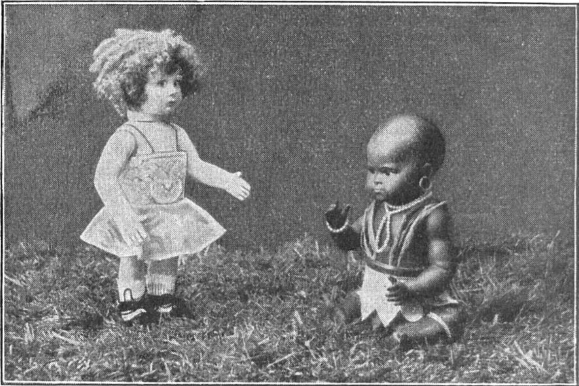
Liesel in angenehmer Gesellschaft.