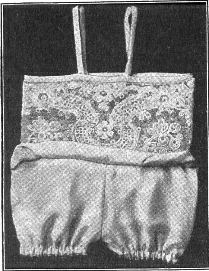
Unterkleid (das Volant ist aufgerollt).

Schnittmusterbogen zugeschnitten (Nähte zugeben). Erst sind die Beinnähte auszuführen. Dann näht man die beiden Höschenteile wieder zusammen. Unten macht man ein 7 mm breites Säumchen und zieht das Gummiband (fertige Weite 10 cm) ein.