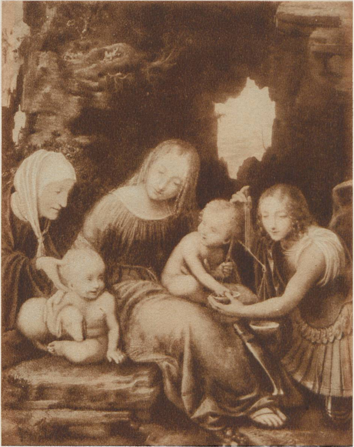
Madonna, von Leonardo da Vinci, Florenz, 1452—1519. Louvre, Paris.