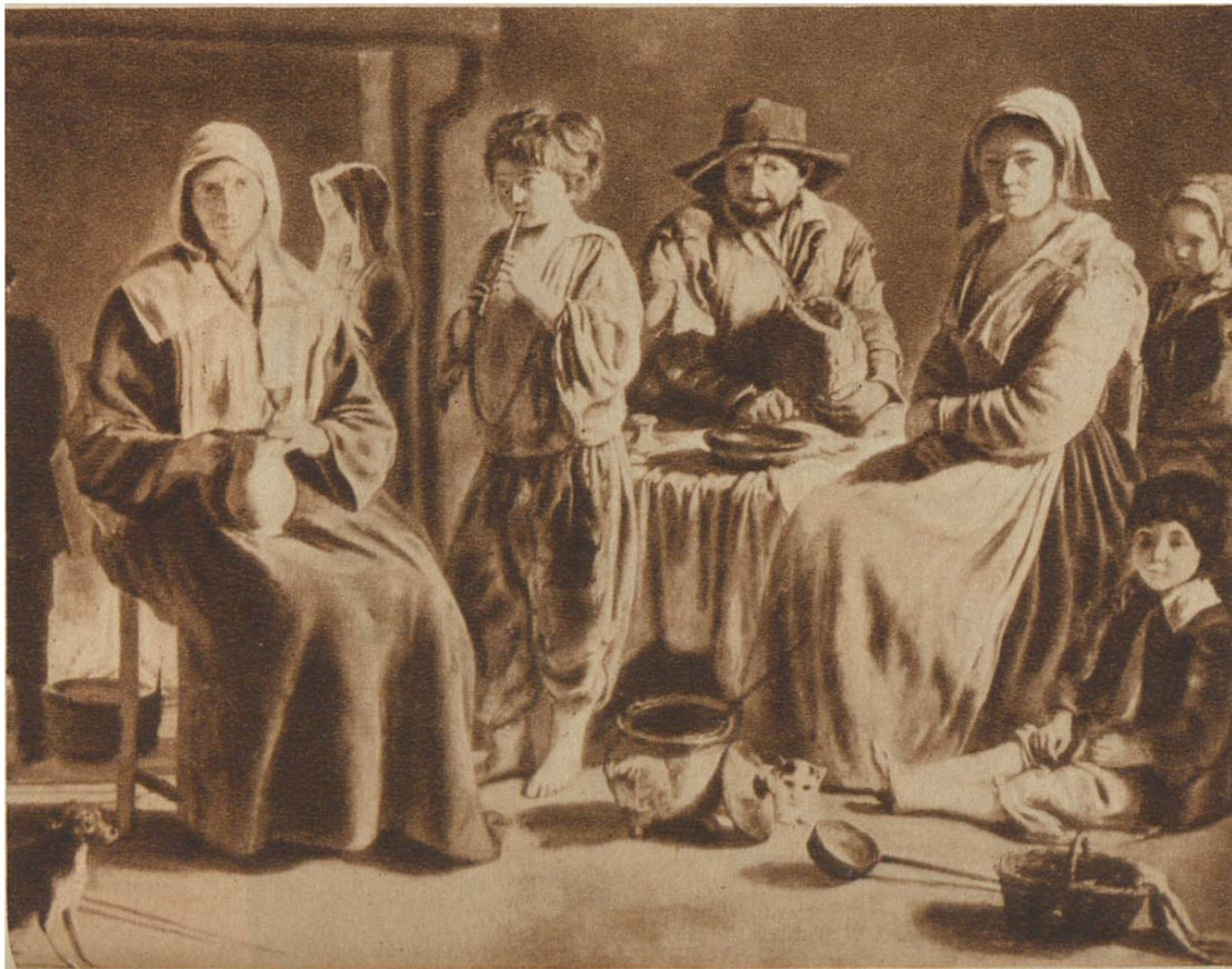
Bauernfamilie, v. Lenain, Laon, um 1600. Louvre, Paris.