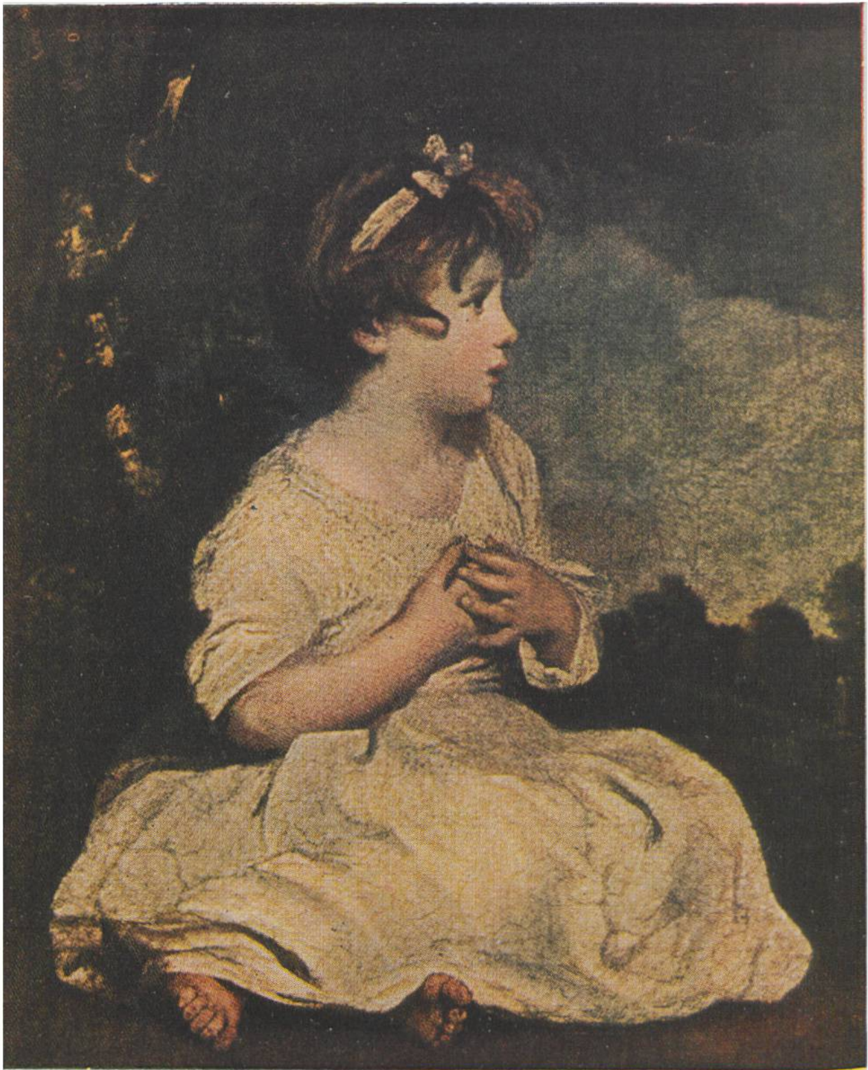
KINDHEIT von Joshua Reynolds, Plymouth 1723—1792. Nationalgalerie, London.