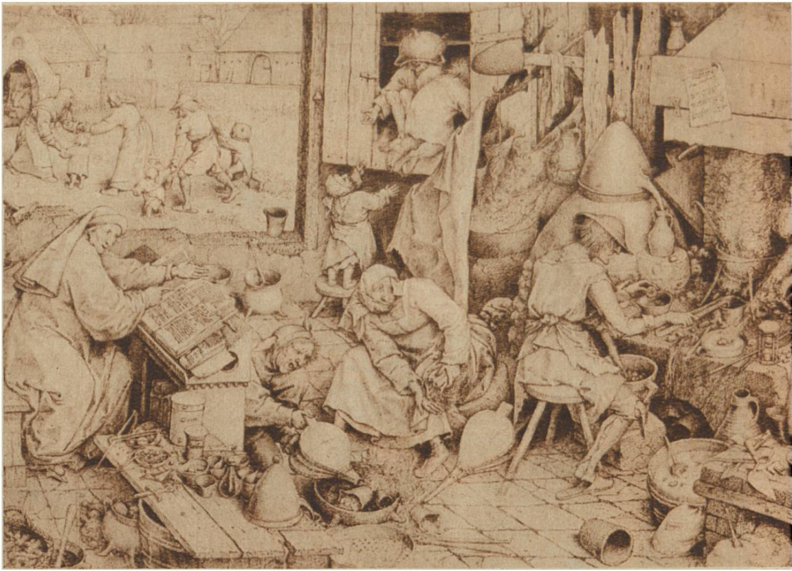
Der Alch i m i s t, v. Pieter Brueg- hel, dem Ael- tern, Brüssel, 1525 — 1569.