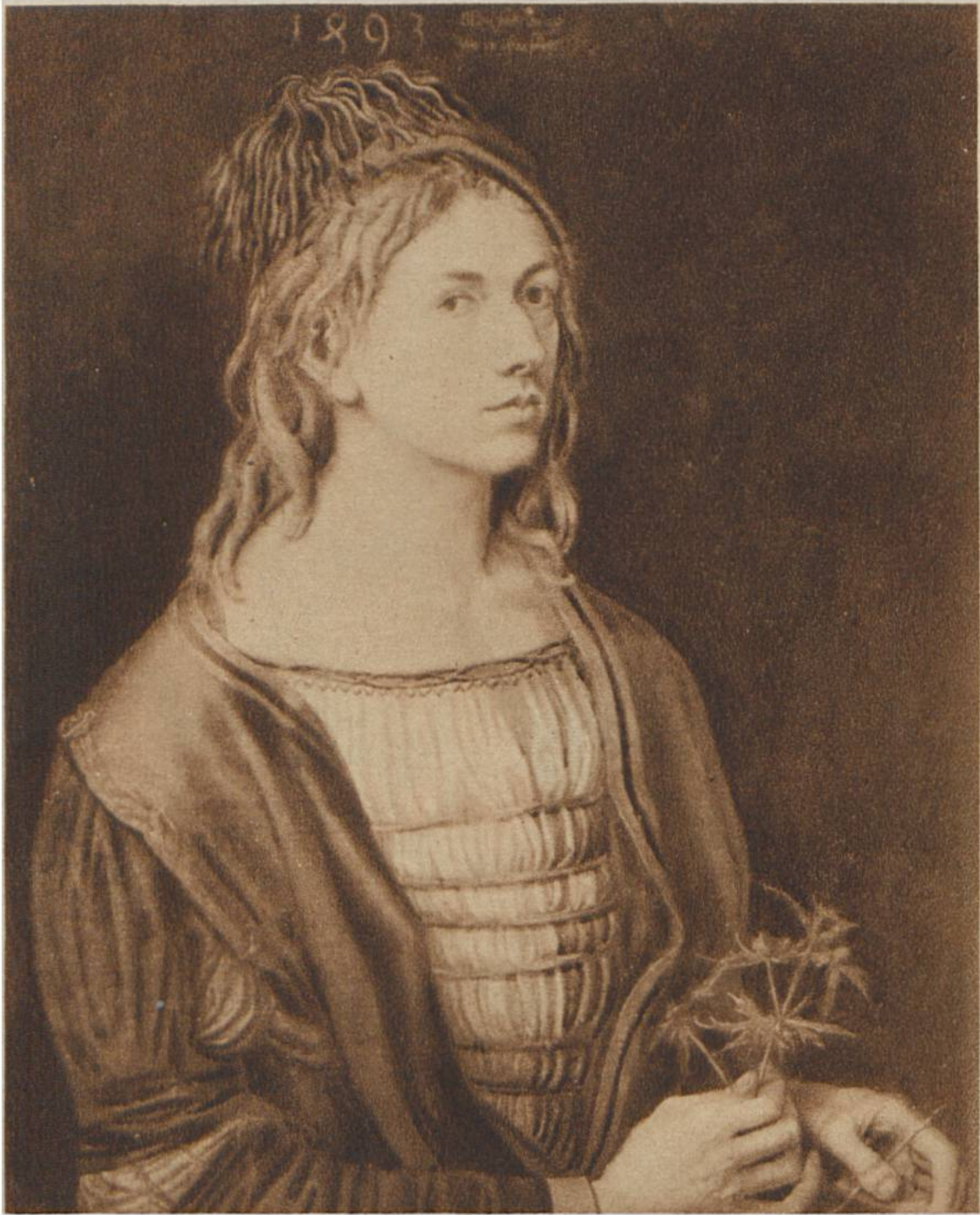
Selbstbildnis von Albrecht Dürer im Alter von 22 Jahren. (1471– 1528). Louvre, Paris.