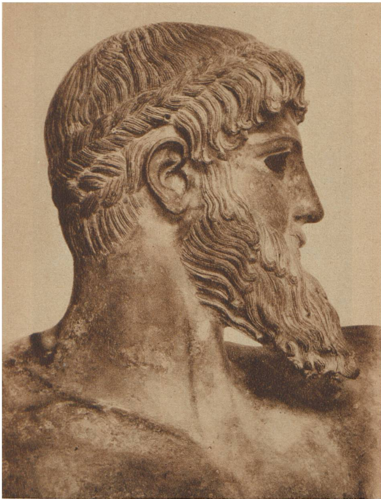
Kopf der Bronzestatue des Zeus (a. d. Meere v. Artemision, Griechenland., gehoben). Ca. 460 v. Chr. Nationalmuseum, Athen.