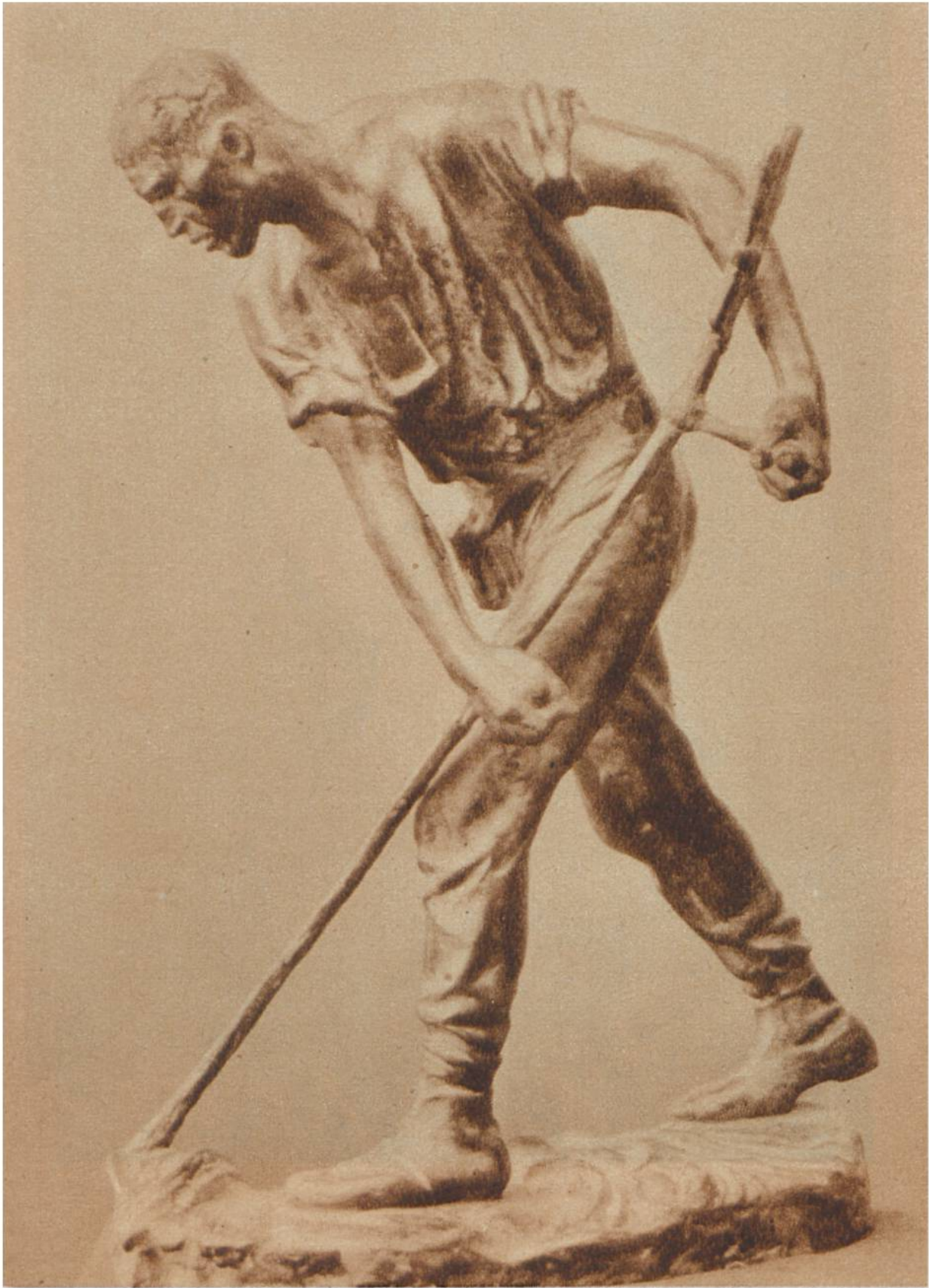
Der Schnitter, Skulptur von Constantin Meunier, Brüssel, 1831—1905.