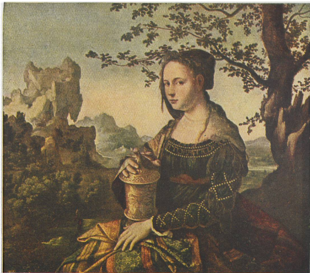
HEILIGE MAGDALENA von Jan Scorel, Utrecht 1495—1562. Rijksmuseum, Amsterdam.