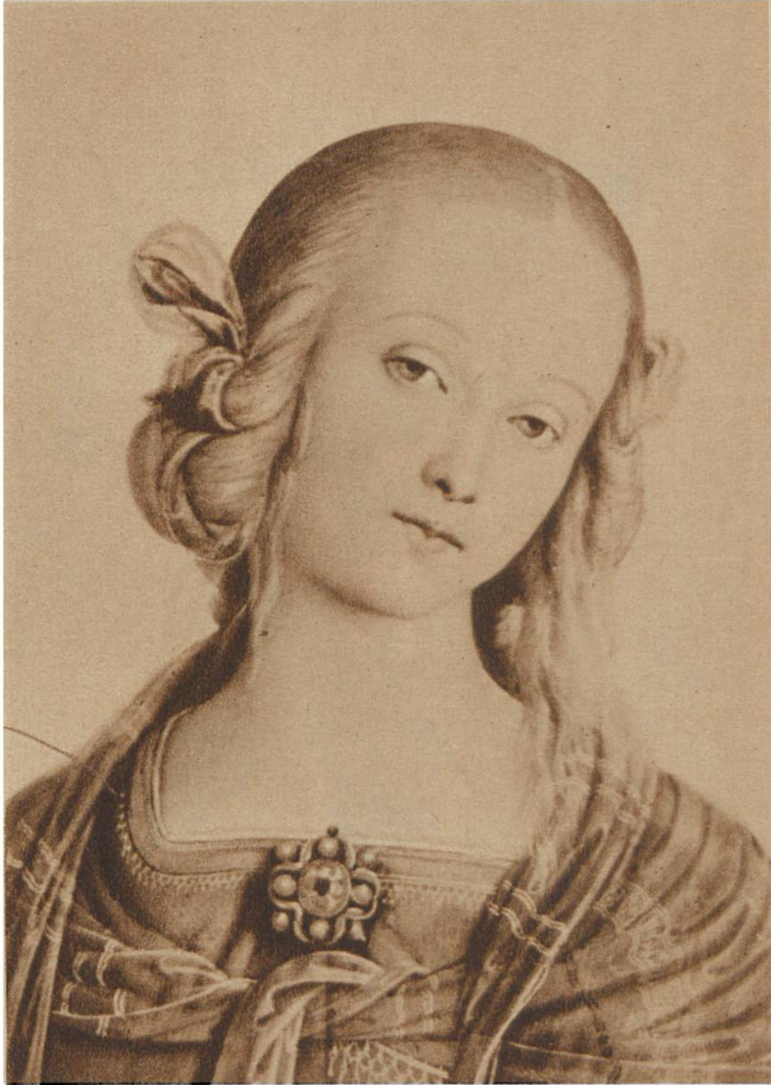
Bildnis der Maria aus dem Gemälde «Maria mit dem Kinde», von Perugino, Perugia, 1446—1523. Louvre, Paris.