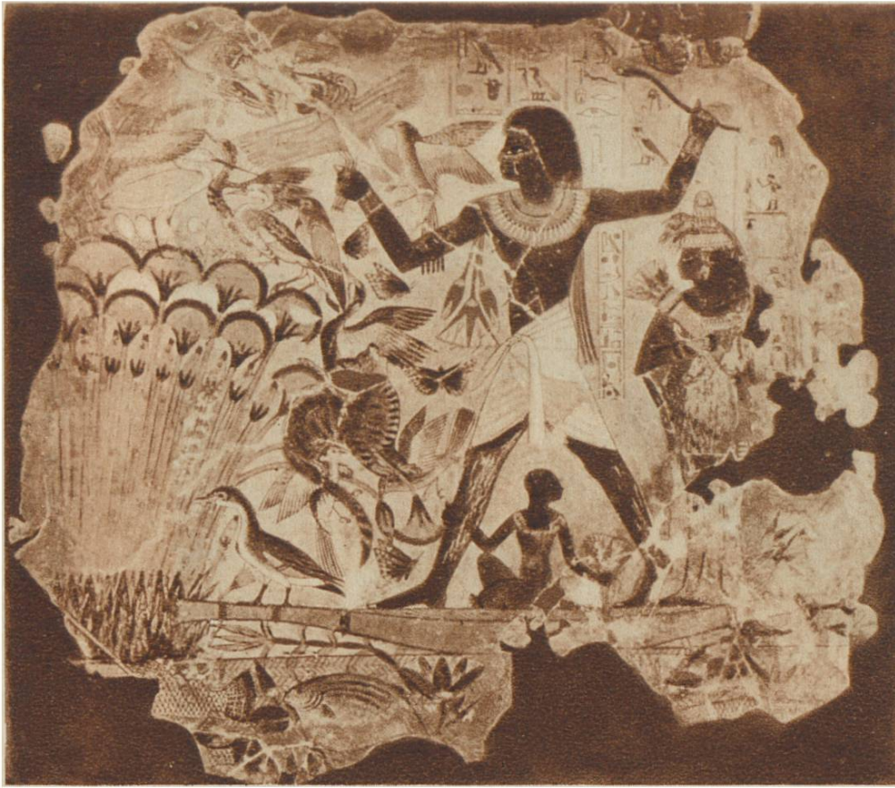
Auf der Vogeljagd. Wandgemälde in einer Grabkammer von The- ben. Um 1200 v. Chr.