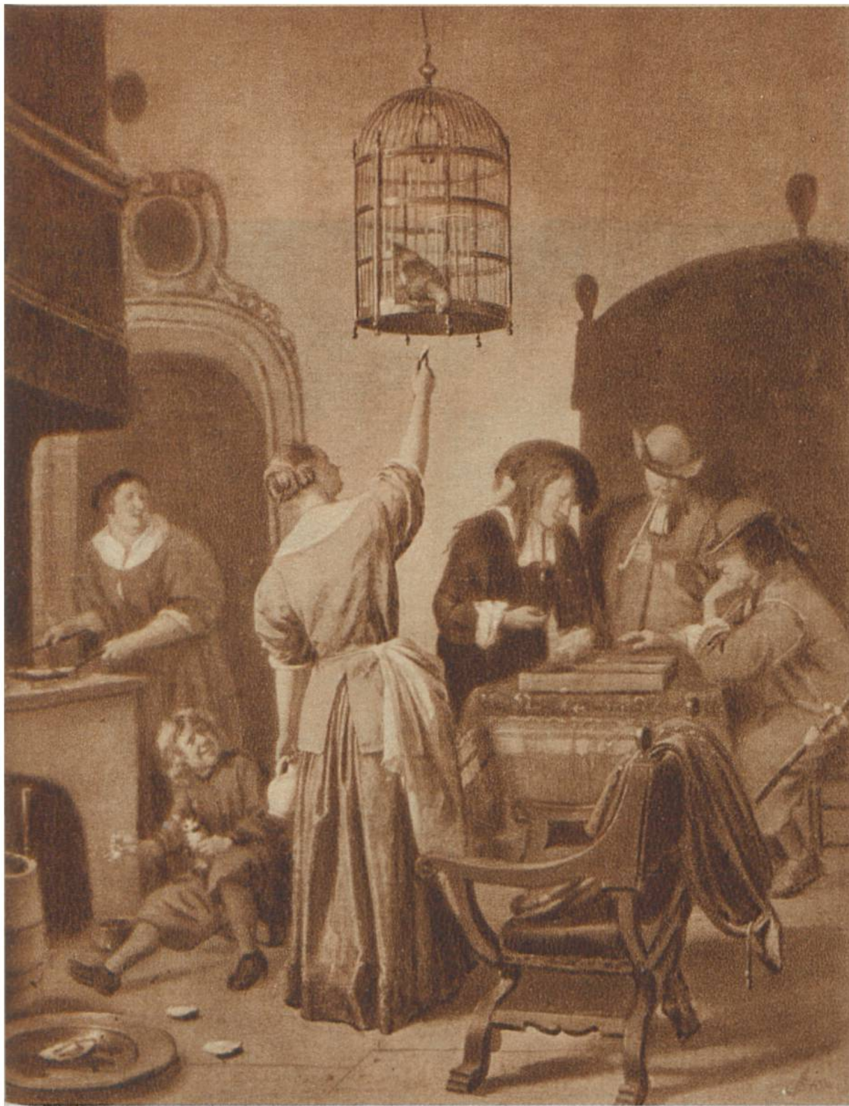
Der Papageienkäfig, von Jan Steen, Leiden, 1626—1679. Rijksmuseum, Amsterdam.