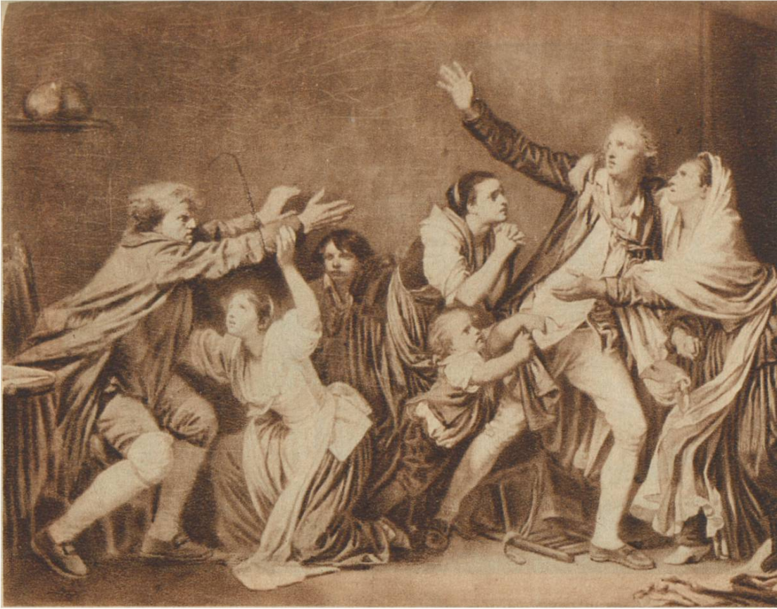
Des Vaters Fluch, von Jean Baptiste Greuze, Paris. 1725-1805. Louvre, Paris.