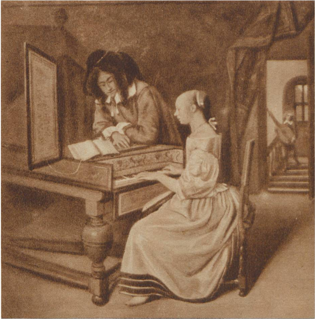
Musikstunde, von Jan Steen, Leiden, 1626—1679. Nationalgalerie, London.