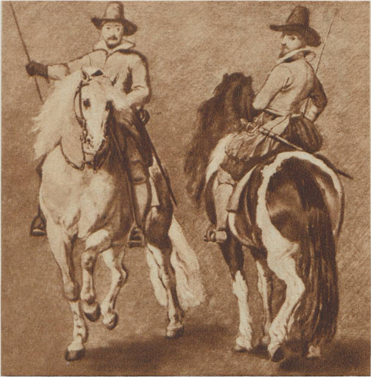
Reiterstudien, von Anthonis van Dijck, Antwerpen, 1599—1641. Buckingham Palast, London.