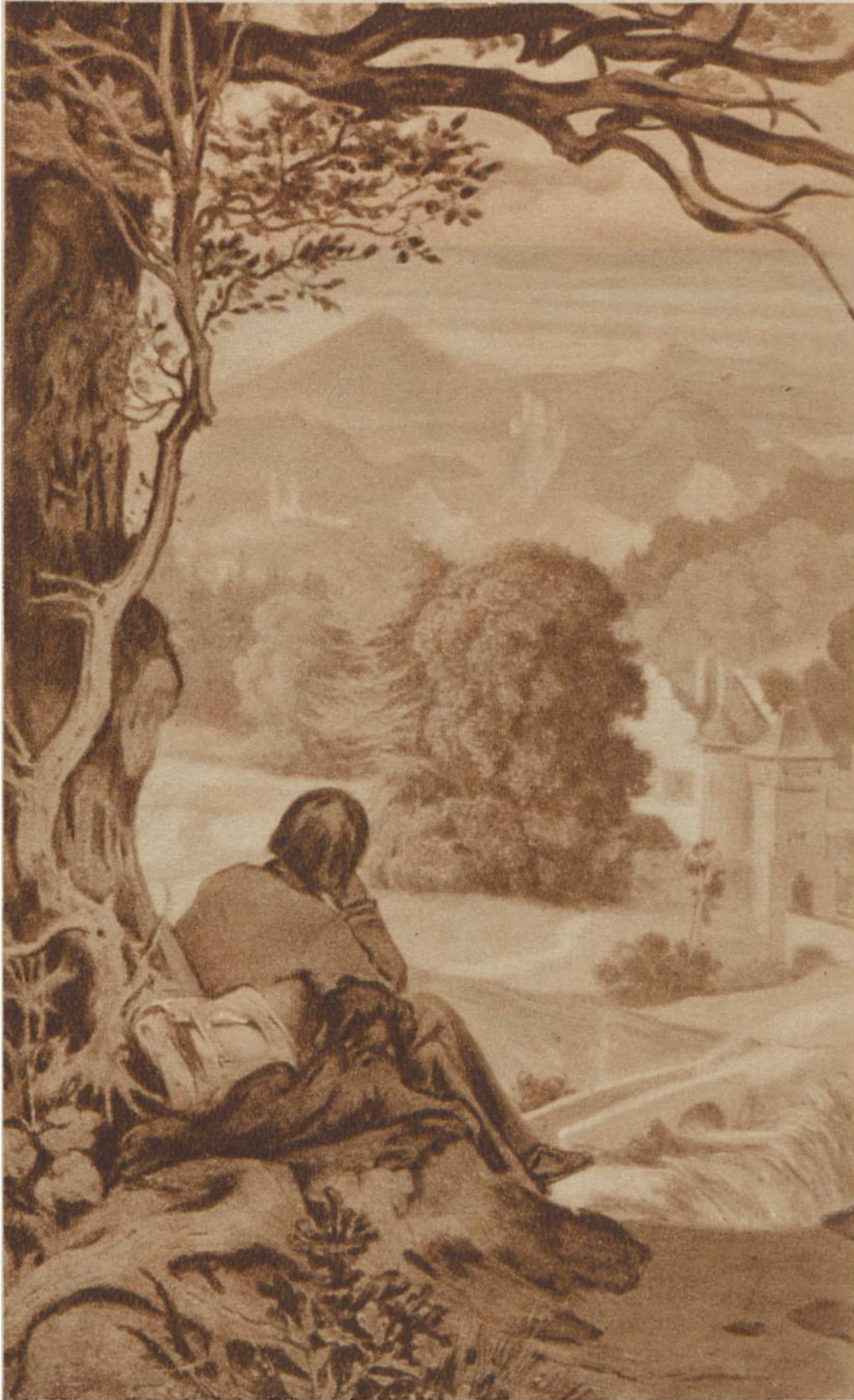
Auf der Wanderung, von Moritz von Schwind, München, 1804 — 1871. Schack-Galerie, München.