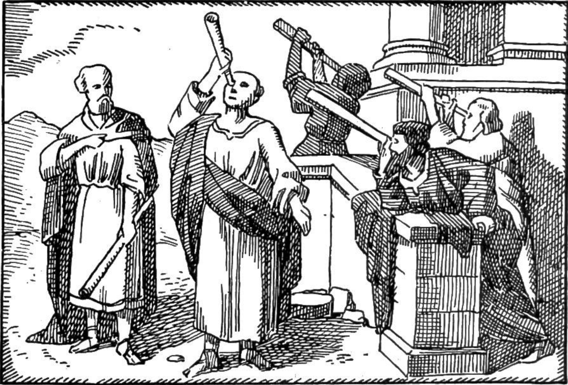
Fernrohre der Alten, sogenannte „Tuben“.