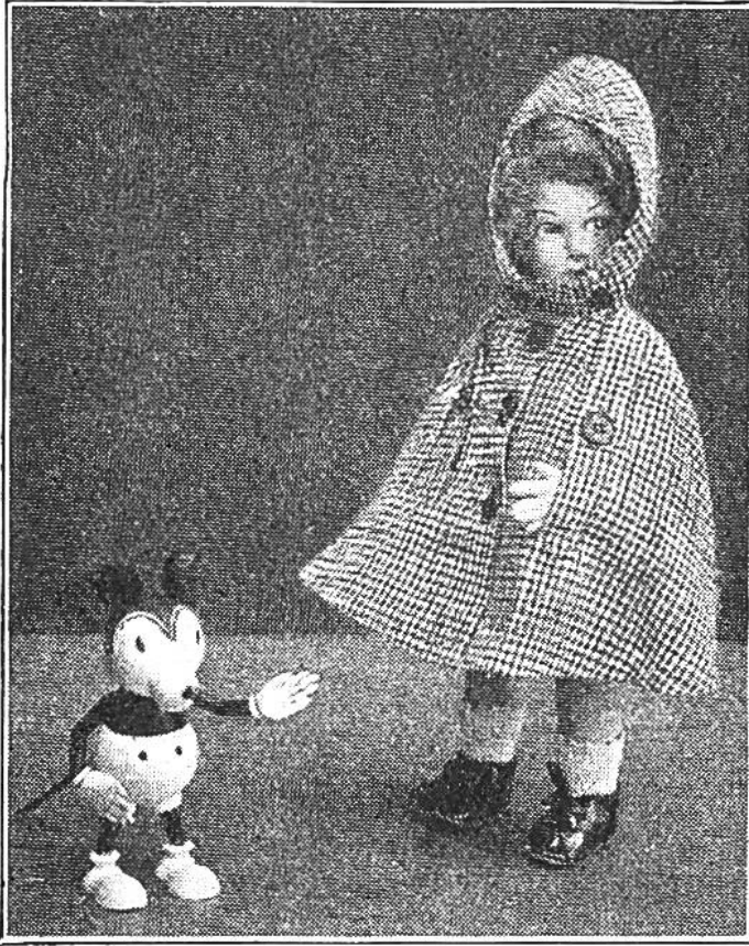
Ob's regnen wird?

Erst führt man an d. Vorderteilen beidseitig von \times bis \times einen Einschnitt aus, dessen vorderer Rand mit einem geraden Stoffstreifen einzufassen ist. Dem rückwärtigen Einschnitttrand stürzt man von der linken Seite die Schlitzpatte an, legt sie in der Hälfte der Breite zusammen und steppt sie auf der rechten Seite schmalkantig auf. Die der vorderen Mitte angeschnitte-