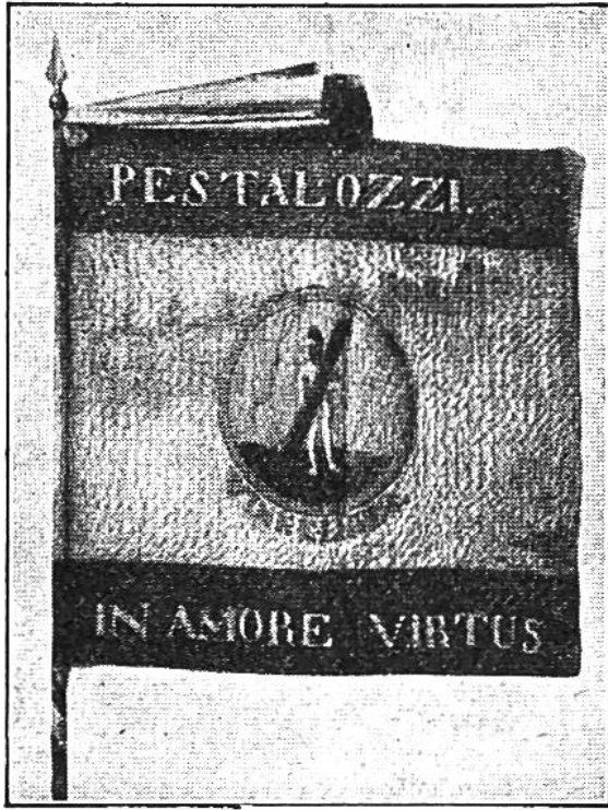
Fahne des Institut-Bataillons. (In der Mitte: Winkelried.)

Pestalozzis Zöglinge lebten in einer kriegerischen Zeit, darum machten sie auch mit grossem Eifer militärische Übungen. Die Schüler des Institutes bildeten ein kleines Bataillon. Ihren Kommandanten konnten sie selber wählen. Das Bataillon besass eine eigene Fahne, Musik, Trommeln, Arsenal, Munitions- und Proviantwagen und zeitweise sogar eine „Flotte“.