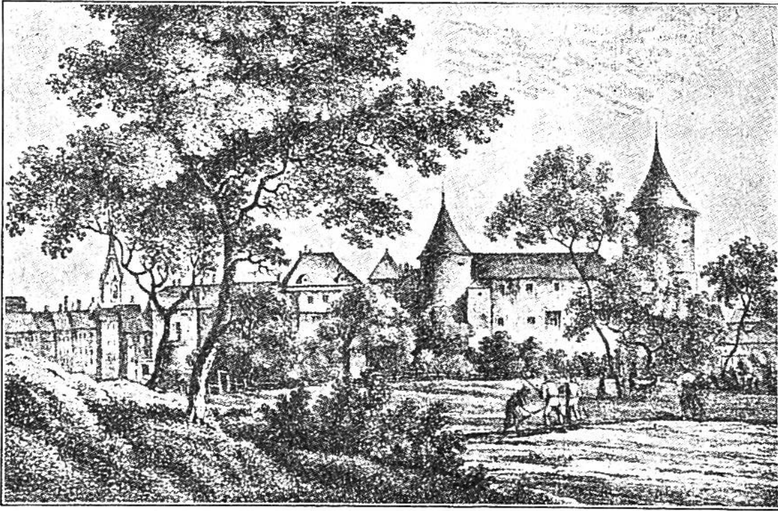
Schloss Yverdon von der Spielwiese aus gesehen. Nach einem Stich von Franz Hegi (1774—1850).