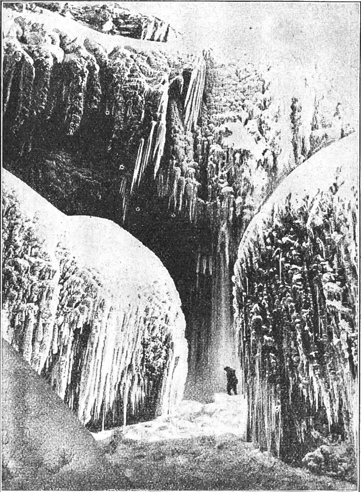
Der Niagarafall im Winter. Niagara ist ein Indianer-Wort und bedeutet „donnerndes Wasser“. Im Winter dämpft eine dicke, zackige Eisschicht den Donner der stürzenden Wassermassen.