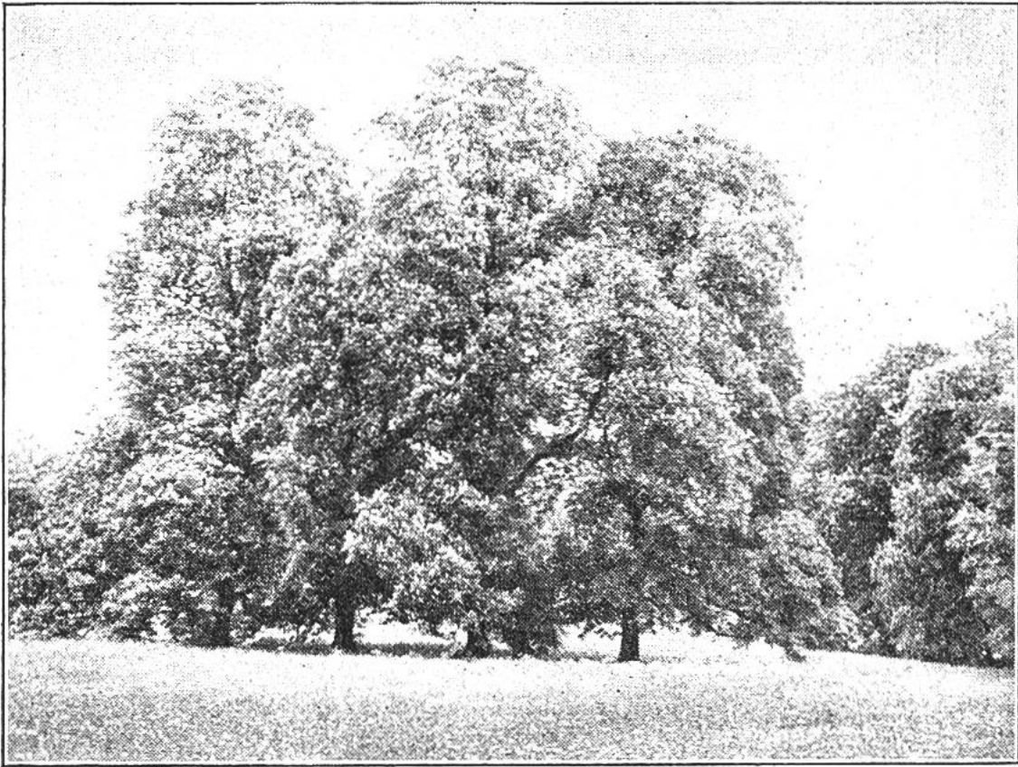
Prachtvoller Bestand alter Rosskastanien in einem Park. Die Bäume scheinen immer vom Blitz verschont geblieben zu sein.

bei Pappeln, Eichen, Fichten, Kiefern und Weiden, und eine weit seltenere Blitzbeschädigung bei Buchen, Birken, Erlen, Ahorn und Lorbeer. Diese verschieden grosse Einschlagsgefahr erklären die Naturforscher aus mannigfachen Ursachen. Es scheint, dass besonders der Feuchtigkeitsgehalt der Rindenteile des Holzes von Bedeutung ist für die elektrische Leitfähigkeit eines Baumes. Ferner werden Bäume mit weit hinabreichenden Wurzeln, namentlich wenn diese noch bis ins Grundwasser gelangen, und Bäume an Gewässern besonders häufig vom Blitzstrahl heimgesucht, dann aber auch Bäume mit vielen Wunden und Narben, in welchen sich allerhand verwesende Stoffe angesammelt haben. Jetzt können wir auch verstehen, warum z. B. die Buche mehr geschützt ist vor Blitzschlag als andere Bäume. Ihre Wurzeln greifen nicht tief in den Boden,