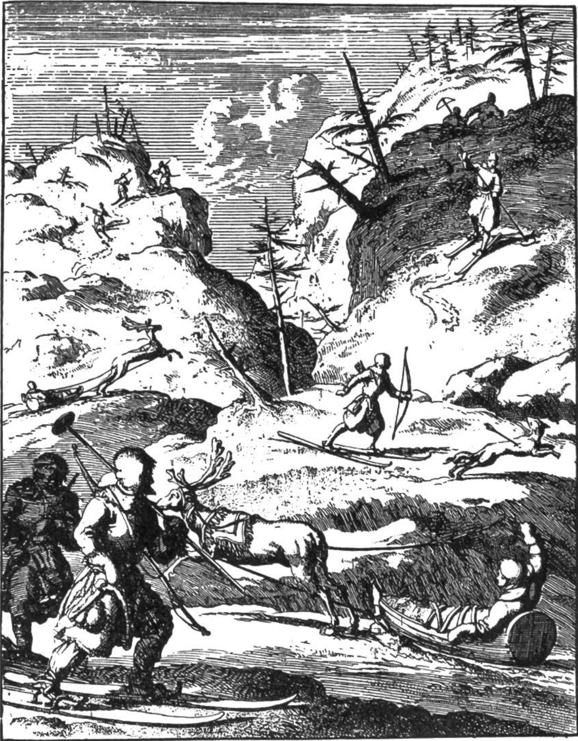
Lappländische Jäger, auf Skiern und in Renntierschlitten. (Nach einem holländischen Kupferstich aus dem Jahre 1682.)