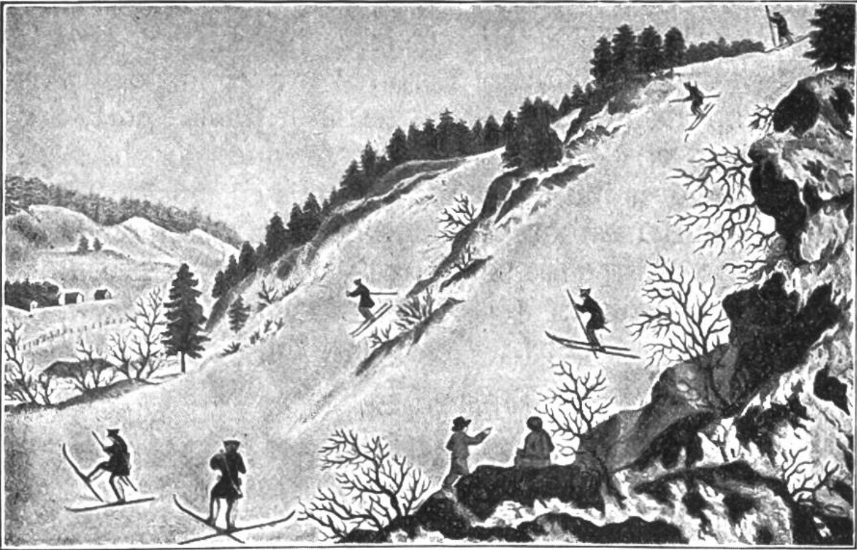
Norwegische Militär-Skiläufer im 18. Jahrhundert. (Nach einem alten Stich.)

überhaupt zwei verschiedene Skiarten zu einer einzigen vereinigt. Die alten skandinavischen Skier waren nämlich ungleich lang. Der rechte mass gegen 3,3 m, der mit Pelz überzogene linke dagegen höchstens 2,1 m. Dieser linke Ski diente bloss zum Abstossen; der rechte dagegen trug das Körpergewicht. Das Laufen mit solchen Skiern ist am ehesten dem Trottnet-fahren (Roller) der Kinder zu vergleichen. Der rechte gleitende Ski hatte jene Rinne auf der Unterseite, wie sie auch die modernen Skier durchwegs an beiden aufweisen. Die letzten Läufer auf solchen ungleichpaarigen Hölzern wurden vor noch nicht langer Zeit in Norwegen gefilmt zur Erinnerung an diese Art des Skilaufs. Noch vor 100 Jahren waren die berühmten norwegischen Skikompanien zum Teil mit solchen ungleichen Brettern ausgerüstet.