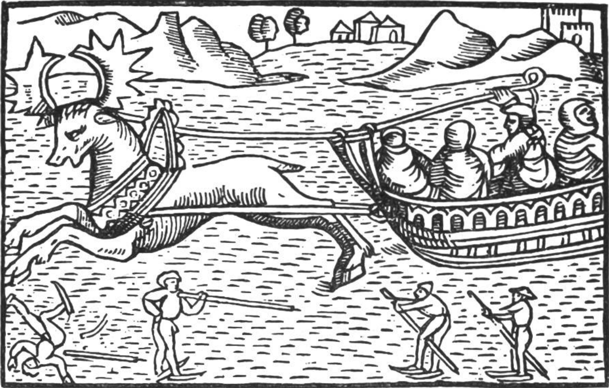
Von einem Elche gezogener Schlitten und Skifahrer. (Aus dem Buche von Olaus Magnus, 1567, Basel.)

hier erzählt wird, hat sich in Wirklichkeit diese „Erfindungsgeschichte“ kaum abgespielt. Aber ungefähr in dieser Weise hat man sie sich vorzustellen. Jedenfalls haben die Forscher derartige Skier bei fast allen Naturvölkern der sogenannten subarktischen Zone, nämlich in Nordrussland, Sibirien und Lappland entdeckt. Bei den Jägern Koreas haben solche Skier auch sommers gute Dienste geleistet beim Durchschreiten der vielen Sümpfe des Landes.