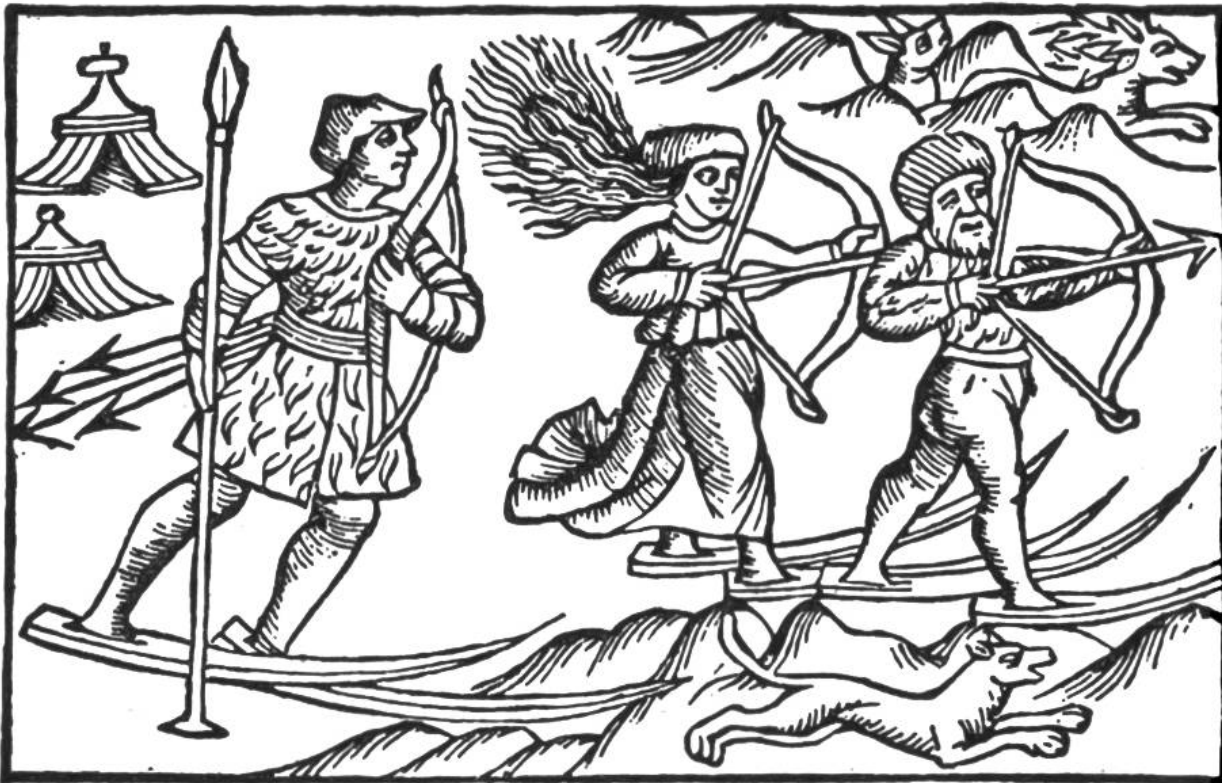
„Wildt-Lappen“ auf der Jagd. (Aus dem Buche des Olaus Magnus, 1567, Basel.)

Bretter jung und alt erfasste, da begann man nicht allein die Skisprünge, sondern auch die Ursprünge des Ski genauer zu erforschen. Da zeigte sich denn, dass dieses wundervolle Fahrzeug, — die Bretter „die den Schnee besiegen“ — schon einige tausend Jahre alt ist, und dass die Skier in verschiedenen Ländern unabhängig voneinander erfunden wurden. Gar viele Völker hatten in ihren schneereichen Ländern zur Winterszeit einen harten Kampf ums Dasein auszufechten; die mit Pfeil und Bogen ausgerüsteten Jäger vermochten bei lockerem Schnee dem flinkeren Wild nicht mehr zu folgen. Sie alle machte die Not erfindereich. So wurde denn ein uraltes Verkehrsmittel, nämlich der Schuh, den Verhältnissen auf dem Schnee angepasst. Um das Einsinken zu verhindern, wurden die Sohlen „einfach verlängert“, und zwar mit Brettern oder fellbespanntem Flechtwerk. Aus dem Schreiten wurde ein Gleiten, und so ward ein neues Verkehrsmittel, eine Art Ski, erfunden. Ganz so einfach wie