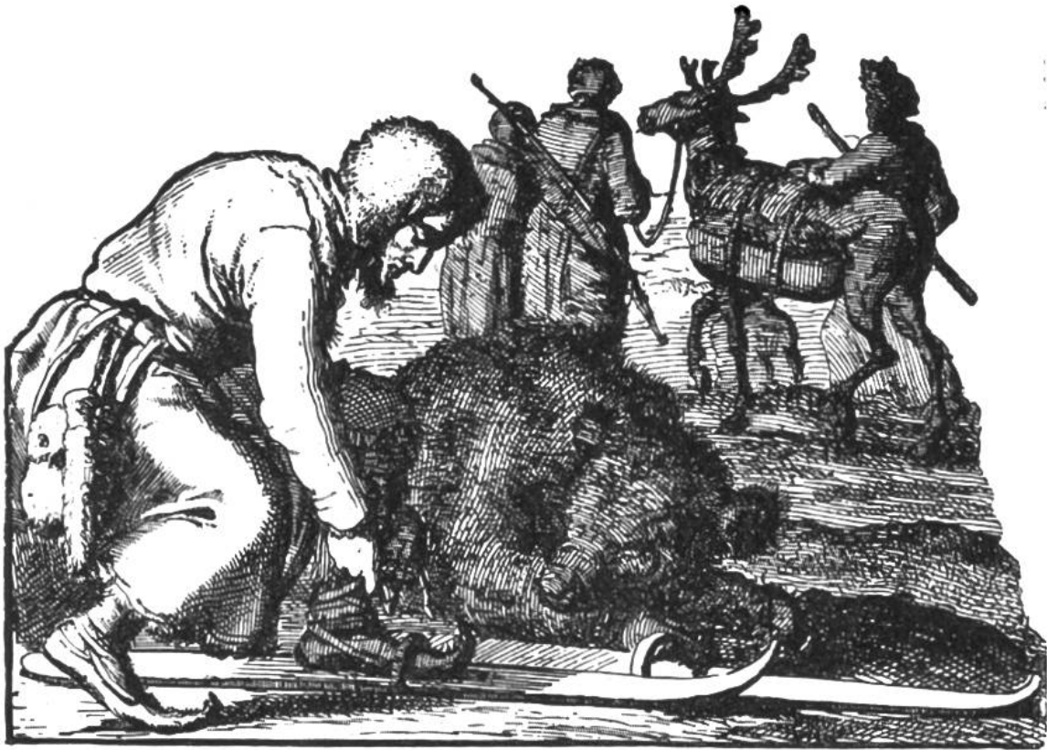
Lappländischer Skifahrer auf der Bärenjagd, mit erlegtem Bär. Zeichnung aus dem Jahre 1682.

Völker“ geben wir einige Bilder wieder. Olaus Magnus erzählt auch von regelrechten Skirennen der Lappen. Er schreibt vom Skilaufen: „und solches thuen sie bissweilen auss Lust zu jagen, bissweilen, dass sie mit eynander wetten, und eyn jeder der best sein will, gleich wie man sonst auf der ebenen Erde mit eynander in die Wette läuft“.