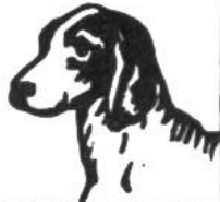
Hund, 15-25 Jahre.