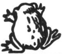
Kröte, 20 Jahre.