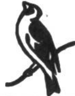
Distelfink, 18 Jahre.