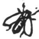
Bienenkönigin, 1 Jahr.