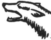
Wolf, 10-15 Jahre.