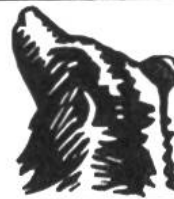
Bär, 50 Jahre.