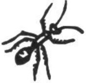
Ameise, 1 Jahr.