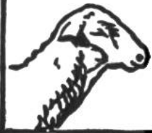
Schaf, 8-10 Jahre.