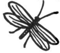
Mücke, 6 Monate.