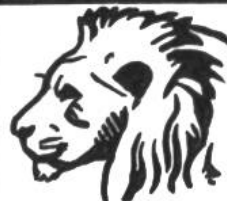
Löwe, 50 Jahre.