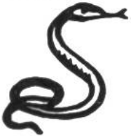
Viper, 10 Jahre.