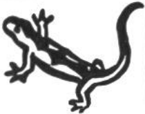
Salamander, 40 Jahre.