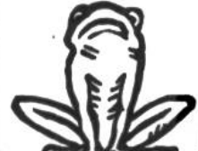
Frosch, 15 Jahre.