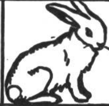
Hase, 6-10 Jahre.