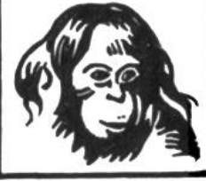
Orang-Utan, 40 Jahre.