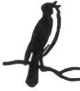
Nachtigall, 12 Jahre.