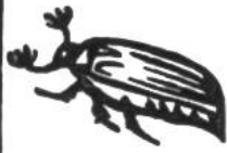
Maikäfer, 6 Wochen.