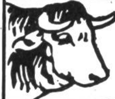
Ochse, 25 Jahre.