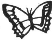
Schmetterling, 2 Monate.