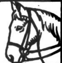
Pferd, 25-30 Jahre.