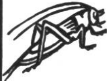
Heimchen, 1 Jahr.