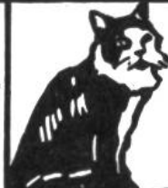
Katze, 15 Jahre.