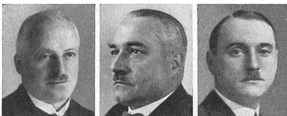
Dr. Gius. Motta von Airolo * 1871, seit 1912 im Amte Polit. Departem.