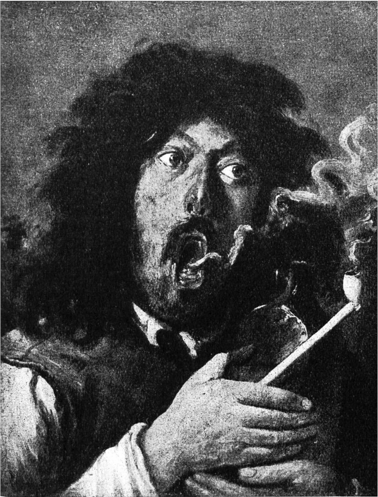
DER RAUCHER Selbstbildnis von Adriaen Brouwer. (Louvre, Paris.)