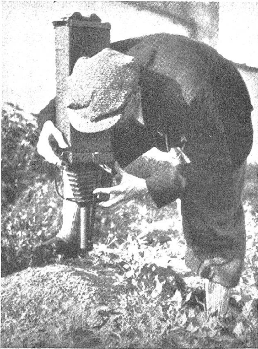
Ameisenforscher an der Arbeit. Um die kleinen Tierchen photographieren zu können, musste ein Apparat mit sechsfacher Auszugslänge gebaut werden. Auch unsere Bilder wurden damit aufgenommen.

Je zahlreicher die Bewohner eines Ameisennestes sind, desto mehr Gänge und Räume dehnen sich in den verschiedenen Stockwerken über und unter der Erde aus. Bestimmte Wege führen ins Freie. Ausserhalb des Nestes sind weithinreichende Strassen errichtet worden. Nicht selten findet man im gleichen Waldgebiet zahlreiche Bauten derselben Ameisenart, und man kann beobachten, dass die Bewohner dieser Bauten miteinander in regem Verkehr stehen. Eine solche Riesenkolonie von roten Waldameisen wird gegenwärtig in Mecklenburg beobachtet und erforscht. Die Kolonie besteht aus 58 Hauptnestern und 31 Zweignestern. Die Einwohner werden auf mindestens 6—7 Millionen Ameisen geschätzt. Das Gesamtstrassennetz soll 7,5 km lang sein. Es wird eine genaue Karte dieses 60 000 m 2