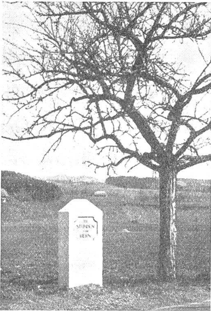
Stundenstein der alten Republik Bern. Er gibt die Entfernung von Bern an. (Eine Wegstunde = 4,8 km.)

zu stossende Vorrichtung war grundsätzlich gleich konstruiert wie die römischen Wegmesswagen. Beim englischen Wegmesser gab ein Zeiger auf einem Zifferblatt die Zahl der Radumdrehungen an. Es konnte also in jedem Augenblick festgestellt werden, welche Strecke seit dem Ausgangspunkt zurückgelegt worden war. Das 1. Bild zeigt einen nach dem gleichen Prinzip arbeitenden Wegmesswagen aus dem 17. Jahrhundert. Man erkennt das Zifferblatt des Wegmessers hinter dem Kutschersitz. Aus der jederzeit ersichtlichen Länge der zurückgelegten Strecke liess sich die Fahr-taxe berechnen. Der moderne Taxameter, der, wie unser 5. Bild beweist, trotz seiner unscheinbaren Grösse eine komplizierte mechanische Vorrichtung enthält, gibt direkt und fehlerfrei den für die Fahrt zu entrichtenden Betrag an. Heute ist in jedem Automobil ein Kilometer-Zähler eingebaut, der zur gleichen Zeit das Total der gefahrenen Kilometer, die jeweilige Geschwindigkeit in Kilometer und die