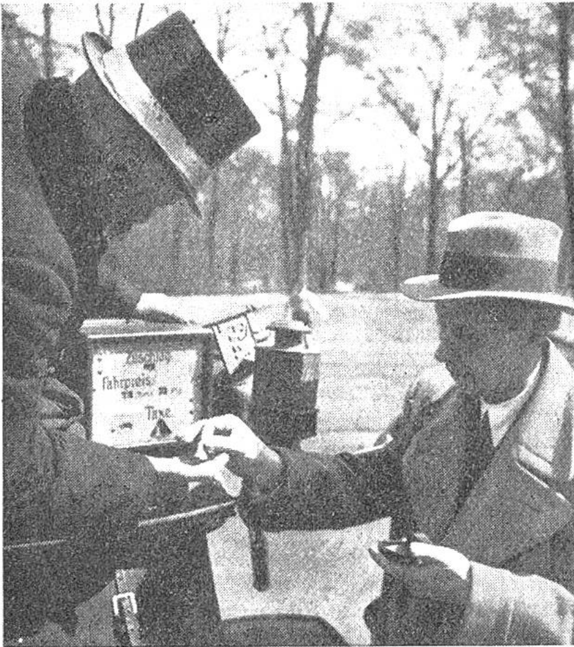
Taxameter, die den Fahrpreis angeben, wurden erstmals 1894 in Deutschland auf Pferdroschken eingeführt.

Anzahl der Kilometer jeder einzelnen Fahrt auf 100 Meter genau anzeigt. Letztere Zählvorrichtung wird bei Beginn jeder Fahrt auf 0 zurückgestellt.