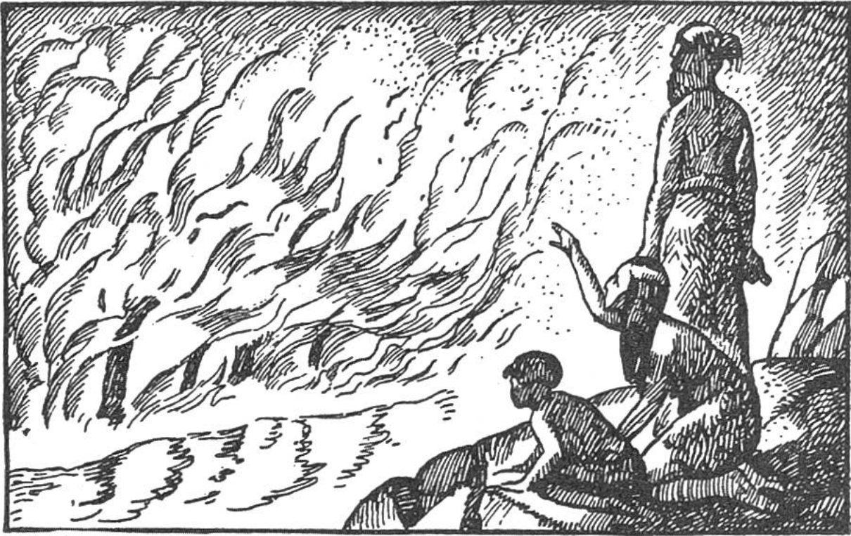
Urmenschen betrachten einen Waldbrand.