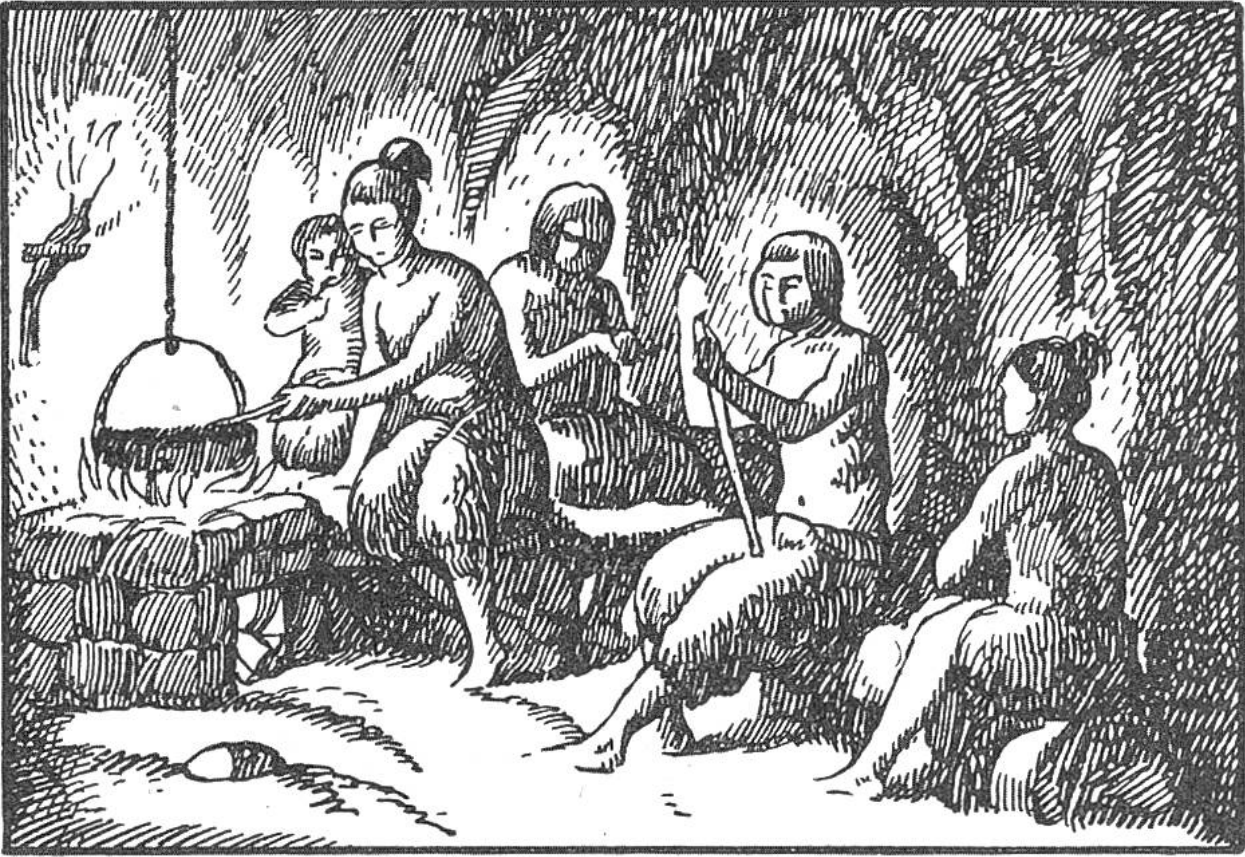
Höhlenbewohner am Herdfeuer.

Wind und Wasser zu schützen. Der Mutigste von allen trug es in seine Höhle, und siehe, das Feuer leuchtete im Dunkel des Raumes, Licht und Wärme spendend, wie die Gestirne des Himmels. Doch nie durfte der göttliche Gast unbesorgt bleiben; eine eigene Höhle wurde ihm eingeräumt und die Würdigsten jedes Stammes bewachten das Feuer Tag und Nacht. Wehe dem, der die Flamme erlöschen liess! Dieses Verbrechen wurde mit dem Tode bestraft.