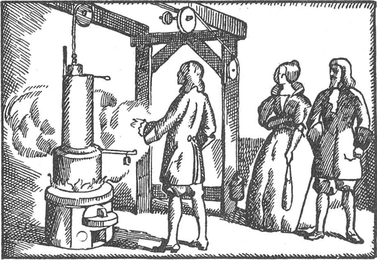
1690 Papin baut eine Dampfmaschine und verwendet das Feuer zur Krafterzeugung.

Eroberung der Flamme den Menschen gekostet hat. Es ahnt nicht, dass in unkundiger Hand das bezwungene Element plötzlich seine Fesseln brechen und den Kampf von neuem aufnehmen kann. Wenn dann die Flammen gierig unsere Wohnstätten erfassen, um in wilder Wut alles zu vernichten, was uns teuer ist, dann ergreift uns wieder das Gefühl von Angst und Schwäche, das unsere Vorfahren im Kampfe mit dem Feuer überwunden haben.