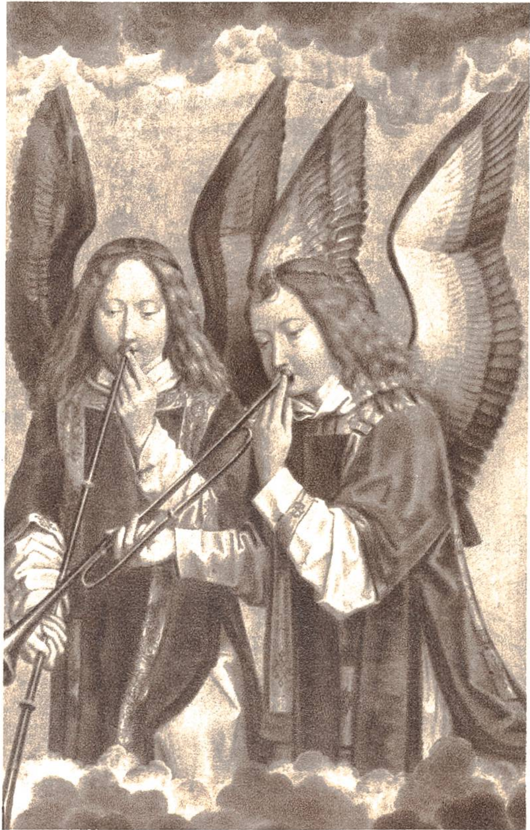
Musizierende Engel, von Hans Memling, Brügge, 1433—1494. (Kgl. Museum, Antwerpen.)