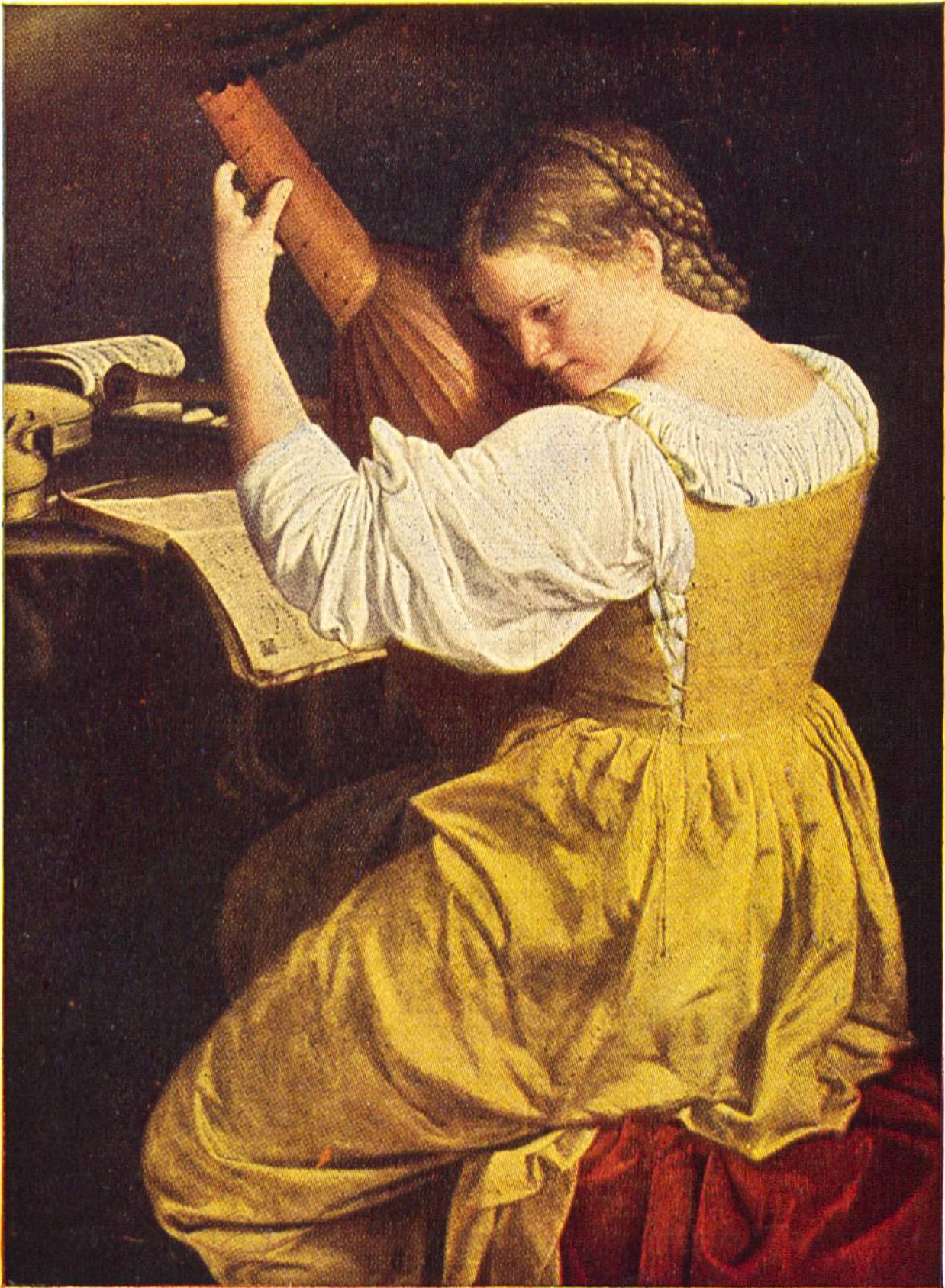
LAUTENSPIELERIN von Michel Angelo da Caravaggio, Venedig, 1569–1609.