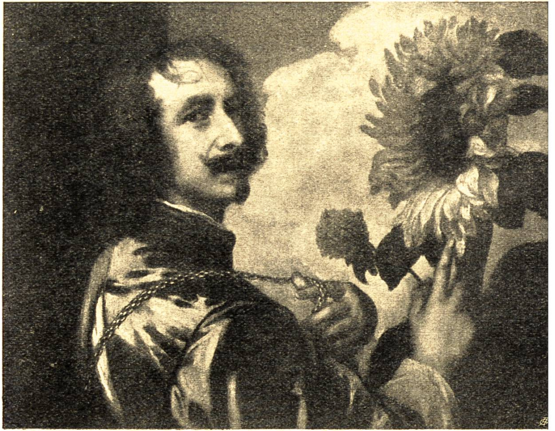
Selbstbildnis von Anton van Dijk, Antwerpen, 1599 bis 1641. Kollektion Westminster.