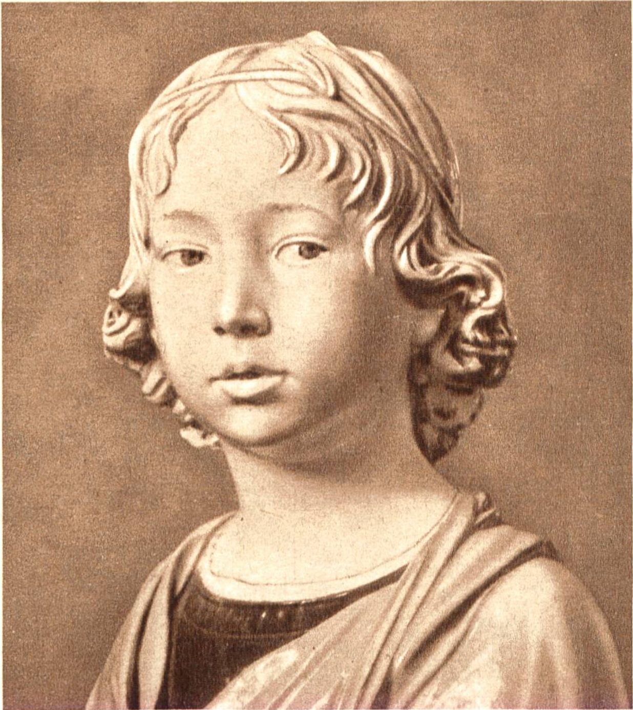
Büste eines Kindes, von Andrea della Robbia, Florenz, 1435—1525.