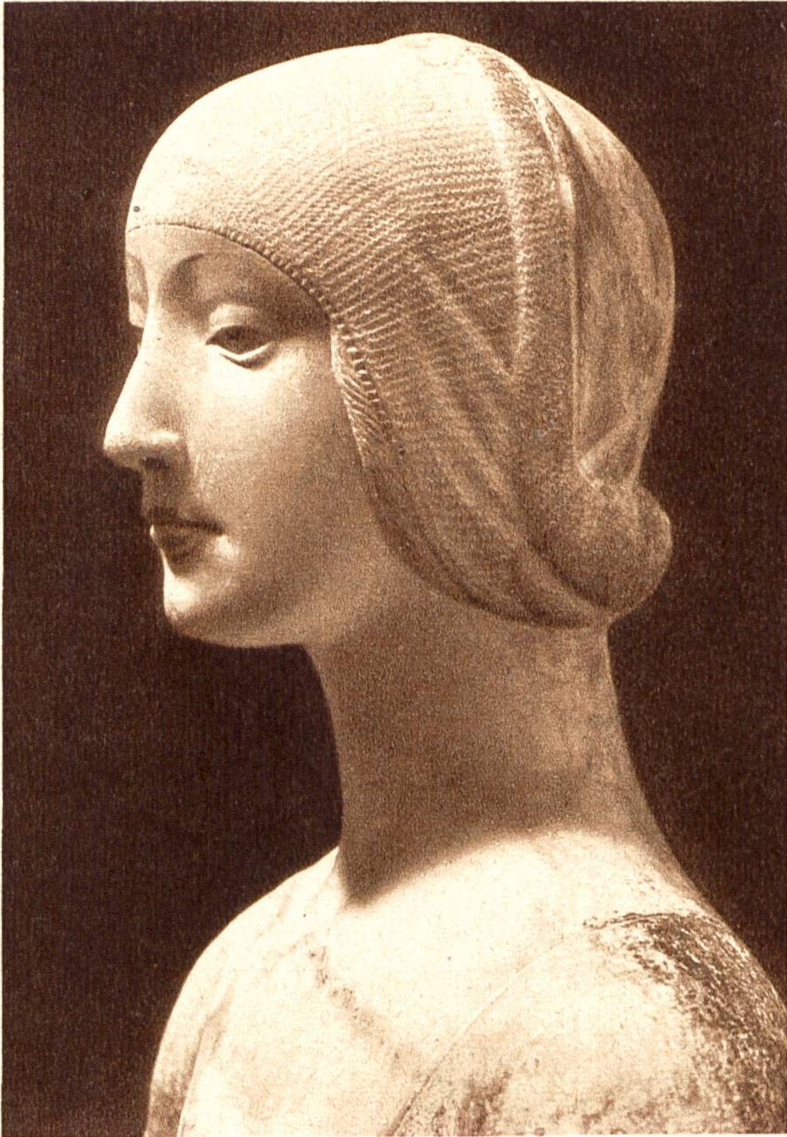
Mädchenkopf, Marmorbüste von Francesco Laurana, Neapel, um 1420—1502. (Nationalmuseum, Palermo.)