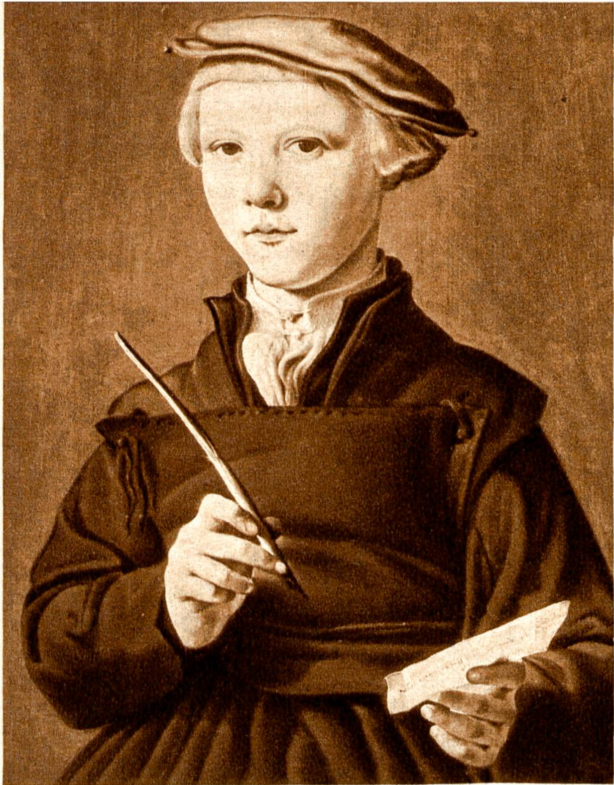
Schüler mit Kielfeder, von Jan van Scorel, Utrecht, 1495—1562. (Boymans Museum, Rotterdam.)