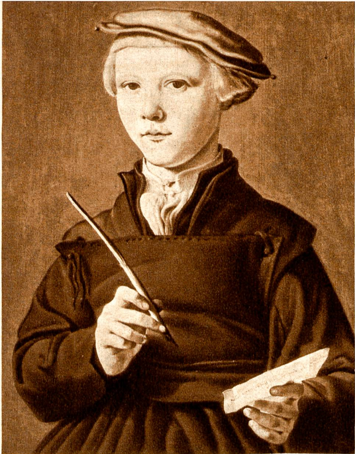
Schüler mit Kielfeder, von Jan van Scorel, Utrecht, 1495—1562. (Boymans Museum, Rotterdam.)