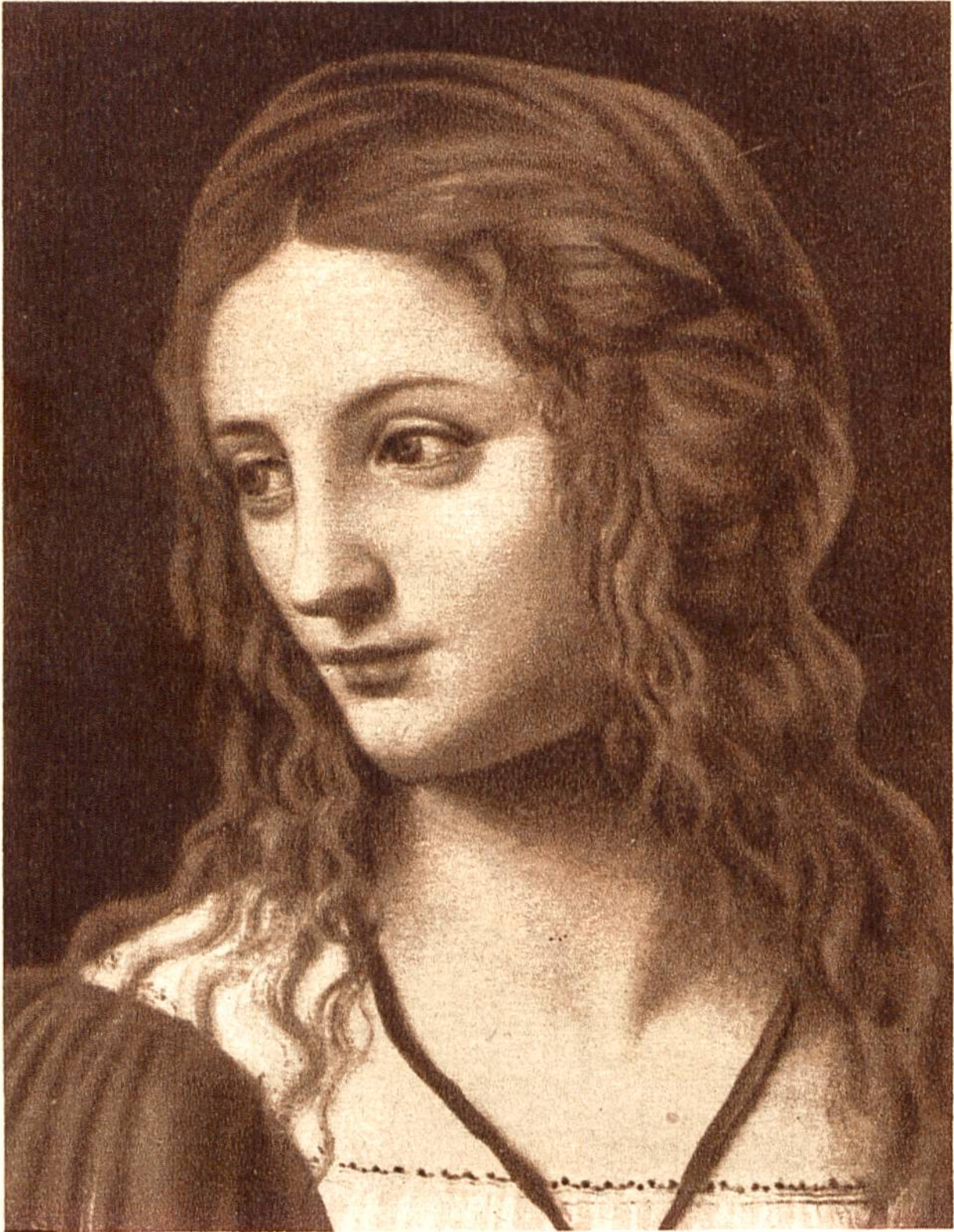
Kopf der Salome, von Bernardino Luini, Luino, um 1480 — 1532. (Louvre, Paris.)