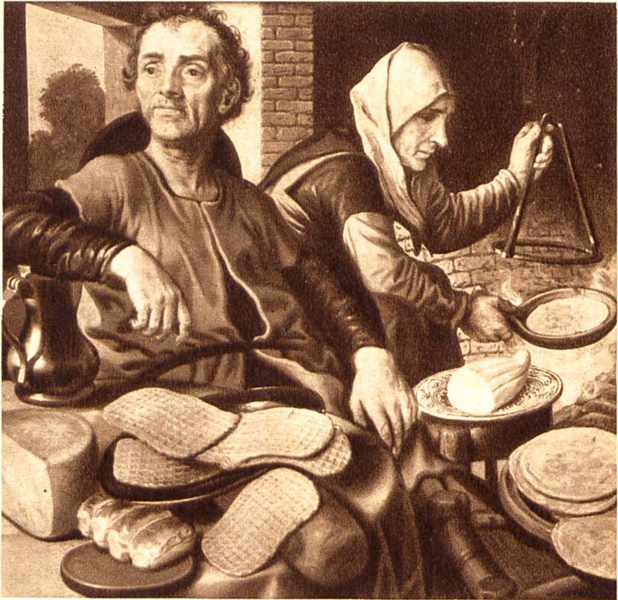
Pfannkuchen-Backen, von Pieter Aertsen, Antwerpen, 1508—1575. (Boymans Museum, Rotterdam.)