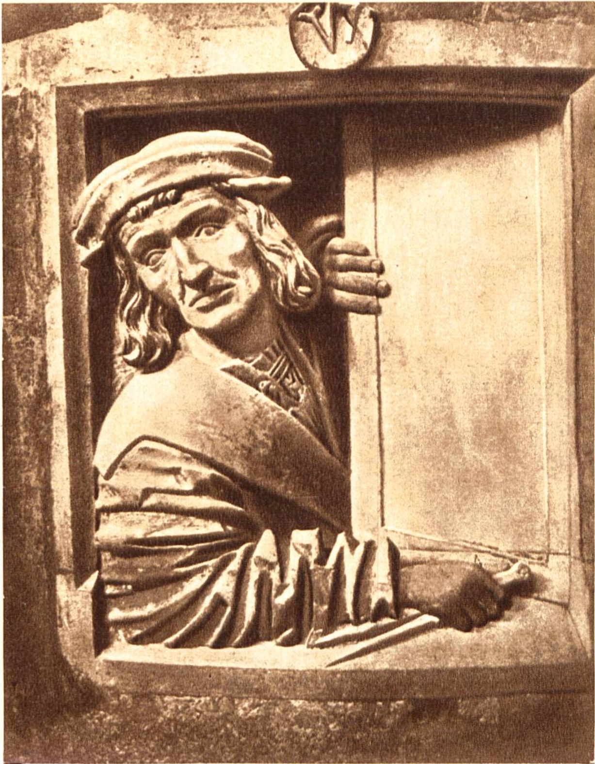
Selbstbildnis des Bildhauers Anton Pilgram, an der Kanzel des Stephansdomes in Wien, um 1514.