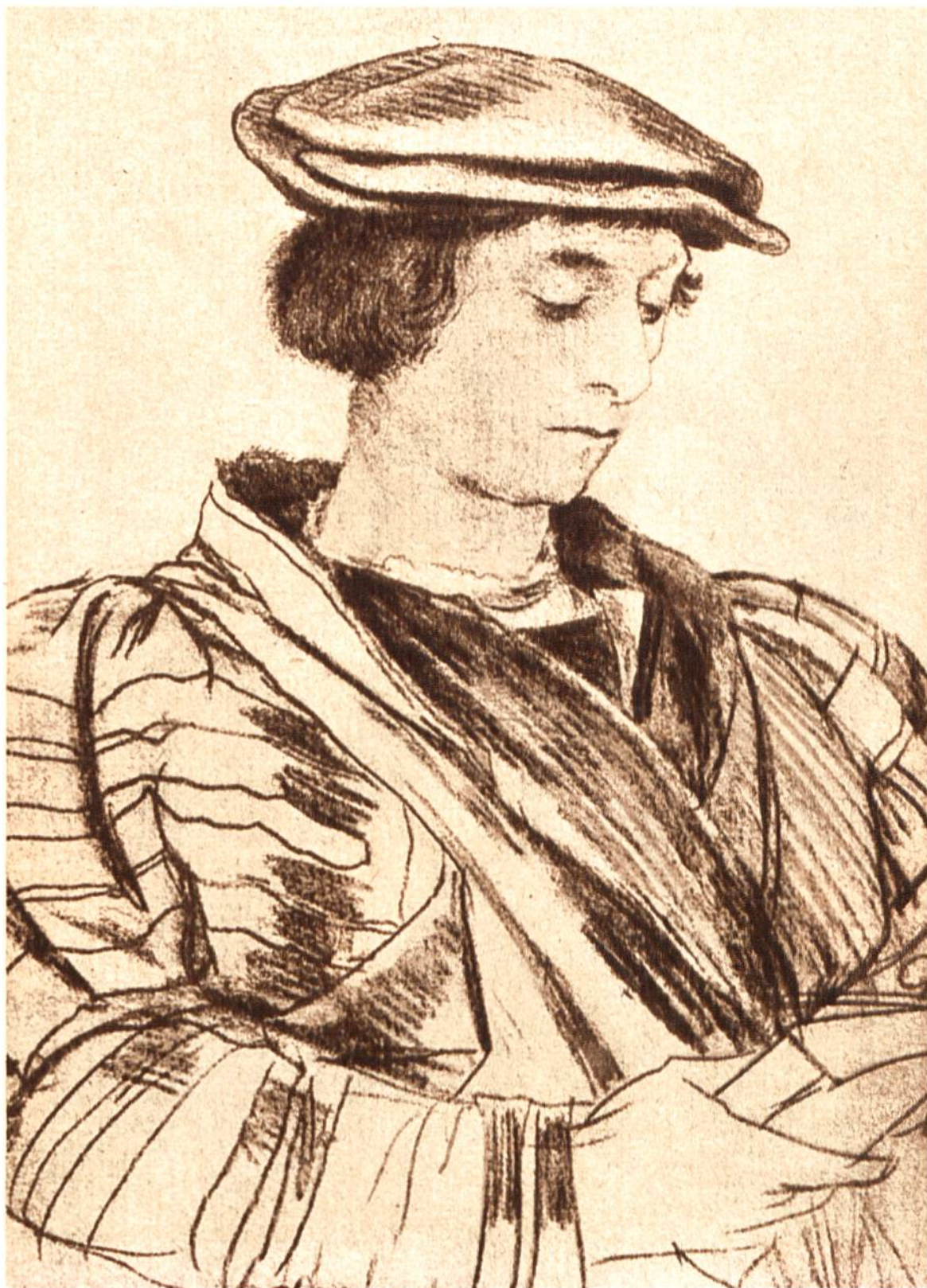
John More, von Hans Holbein d. J., Basel, 1497—1543. (Windsor Castle.)