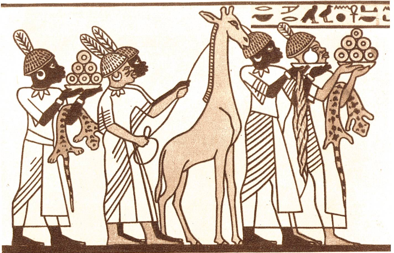
Neger und Ostafrikaner bringen dem ägyptischen Herrscher Tribut dar. Wandgemälde in einer Grabkammer in Theben. Ca. 1200 v. Chr.