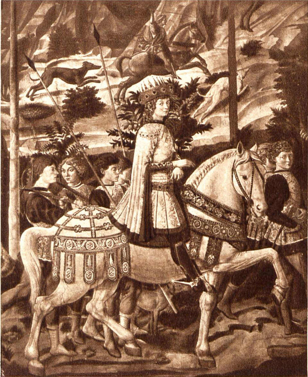
König aus dem Morgenland, von B. Gozzoli, Florenz, 1420—1497. (Palazzo Riccardi, Florenz.)