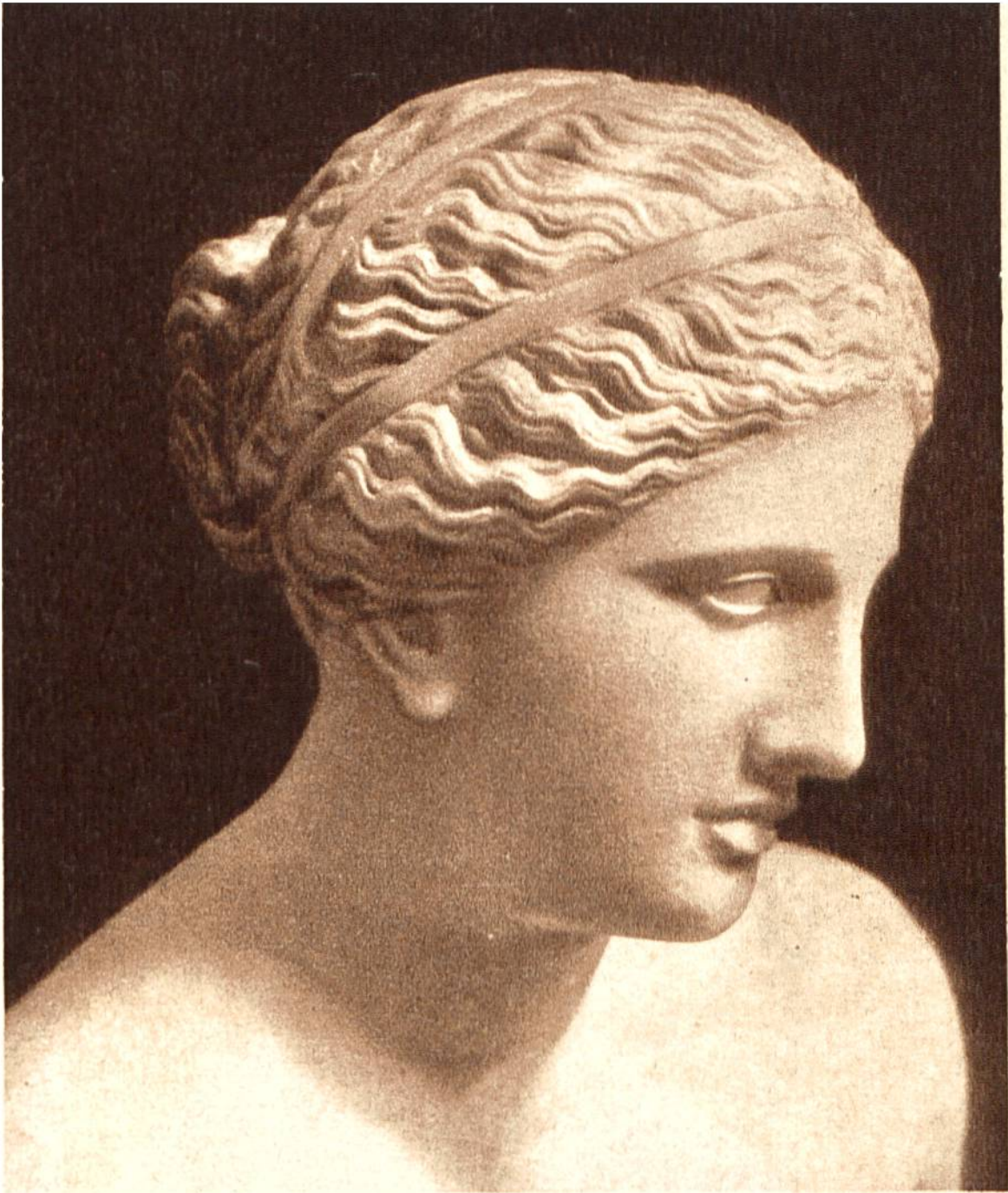
Kopf der knidischen Aphrodite (Venus). Griechische Statue aus dem 4. Jahr- hundert v. Chr. (Vatikanmuseum, Rom.)