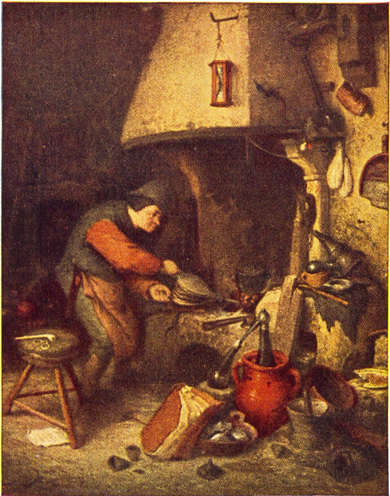
DER ALCHIMIST von Adriaen van Ostade, Haarlem, 1610–1685.