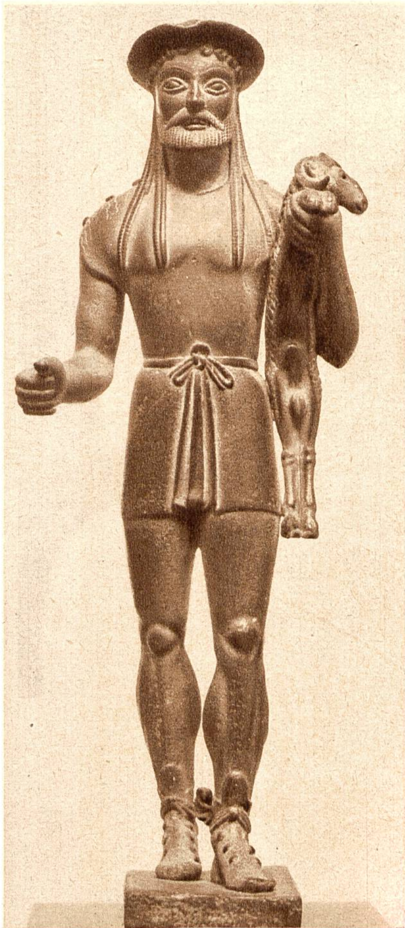
Hermes mit Wid- der. Altgriechische Bronze - Statue, ca. aus dem 6. Jahrhun- dert v. Chr. (Kunst- museum, Boston.)