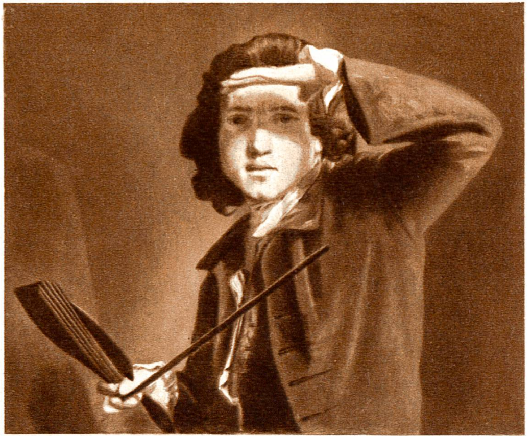
Selbstbildnis, von Joshua Rey- nolds, London, 1723—1792. (National Portrait Gallery, London.)