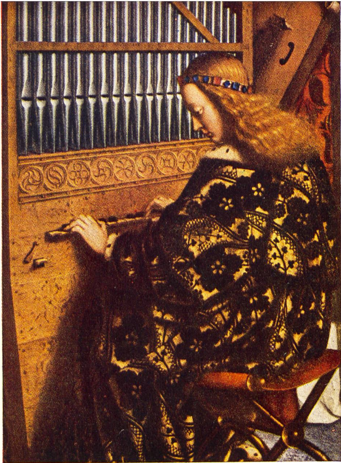
MUSIZIERENDER ENGEL aus dem Genter Altar, von Jan und Hubert van Eyck, Maastricht (Holland), 14.–15. Jahrhundert.