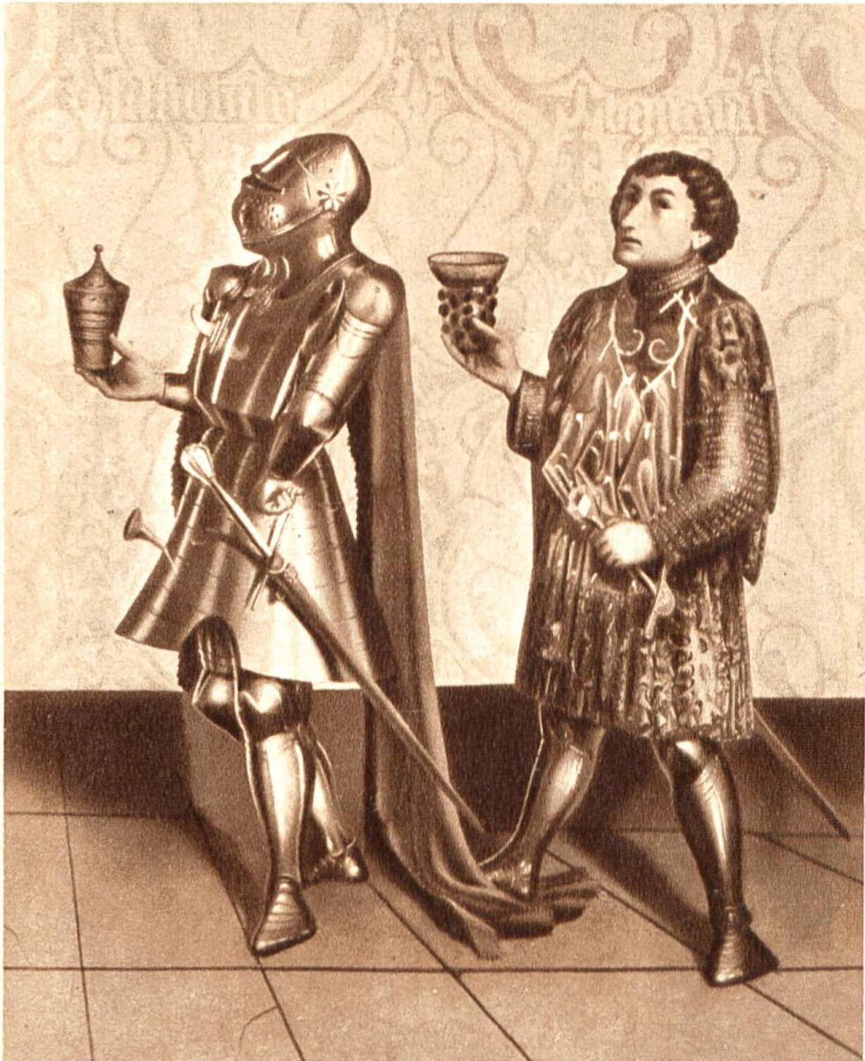
Zwei Helden bringen dem dürstenden König David Wasser, von Konrad Witz, Basel, um 1395—1447. (Kunstmuseum, Basel.)