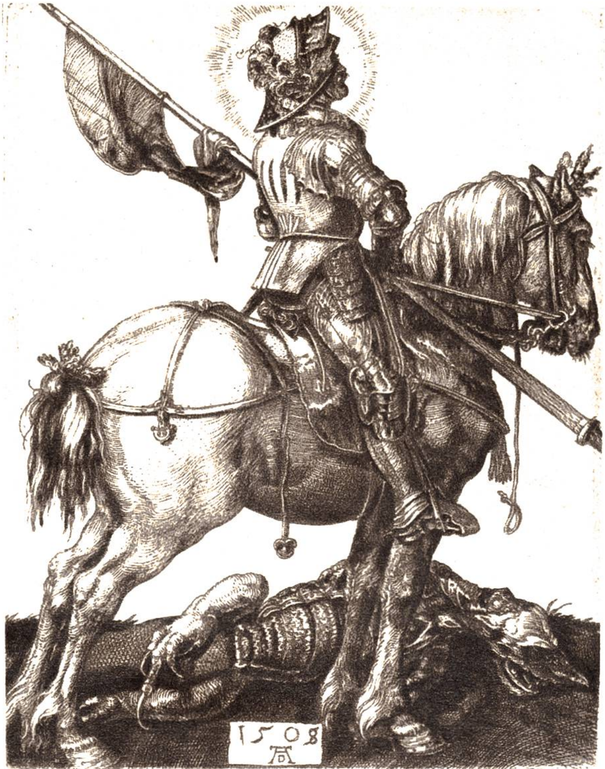
St. Georg, Kupferstich von Albrecht Dürer, Nürnberg, 1471–1528.