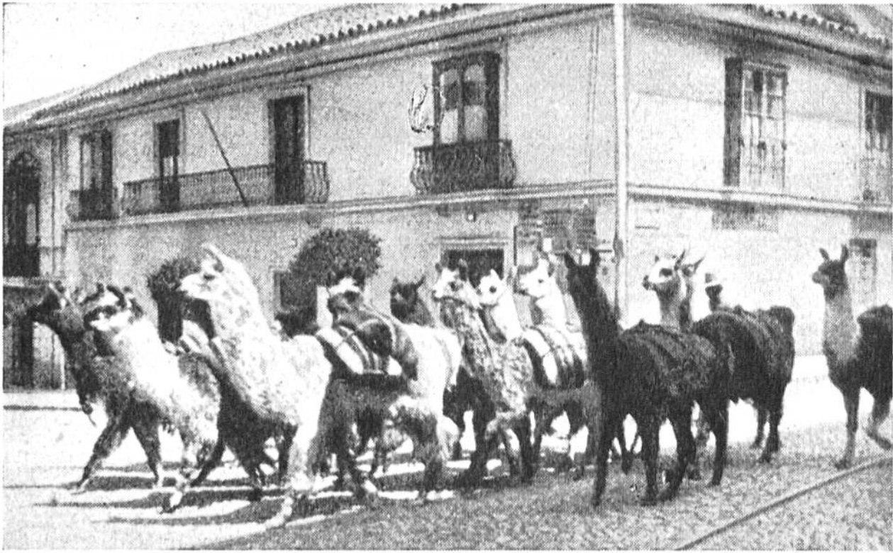
Eine Lamaherde zieht durch die Stadt. Auch sehr grosse Herden brauchen nicht mehr als ein bis zwei Führer. Die Tiere folgen auf einen Zuruf oder Pfiff.

stand. Die Gold- und Silberschätze, welche noch unterwegs waren, versenkten sie in einen tiefen See, wo die Habgier der Abenteurer sie nimmer erreichen konnte. — Wie sie damals auf dem denkwürdigen Zuge nach Cajamarca des Landes Schätze auf dem Rücken trugen, so schaffen die Lamas auch heute noch den Mineralreichtum Perus aus den oft fast 5000 m hoch gelegenen Bergwerken der Kordilleren nach den Sammelstationen, von wo Eisenbahn- und Maultiertransport die Metallschätze zur Küste führt. Die Lamas lieben die kalte Luft und befinden sich wohl im Gebirge; oft sind sie ganz mit Reif und Eis bedeckt und bleiben gleichwohl gesund. Kräuter und Gräser, die in spärlichem Wuchse die Hochebenen der Kordilleren bedecken, bilden ihre Nahrung.