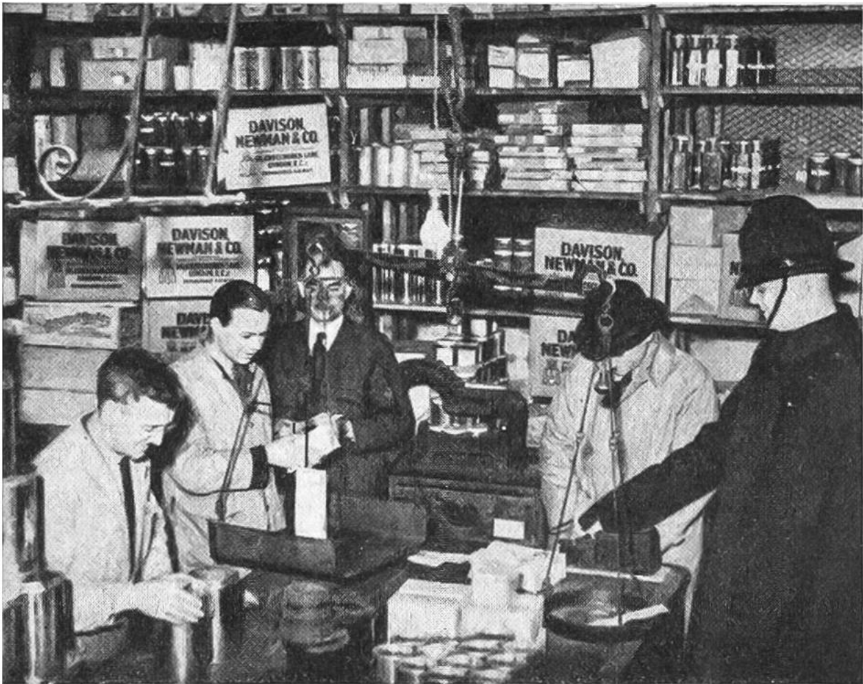
Die Firma Davison, Newman & Co. ist eine der ältesten Teehandelsfirmen Londons. Das Bild zeigt einen der zahlreichen Verkaufsräume des Hauses.

Hudsonflusses. Alle standen unter englischer Oberhoheit. Handel und Industrie jedoch durften sie nicht treiben, alles musste aus England bezogen werden. Die Kolonien wurden auch gezwungen, fremde Waren in England teurer zu kaufen, als sie dieselben anderswo hätten haben können. Ihre Exportprodukte durften sie nur an England verkaufen und zwar billiger als sie diese bei freiem Handelsverkehr sonst hätten absetzen können.