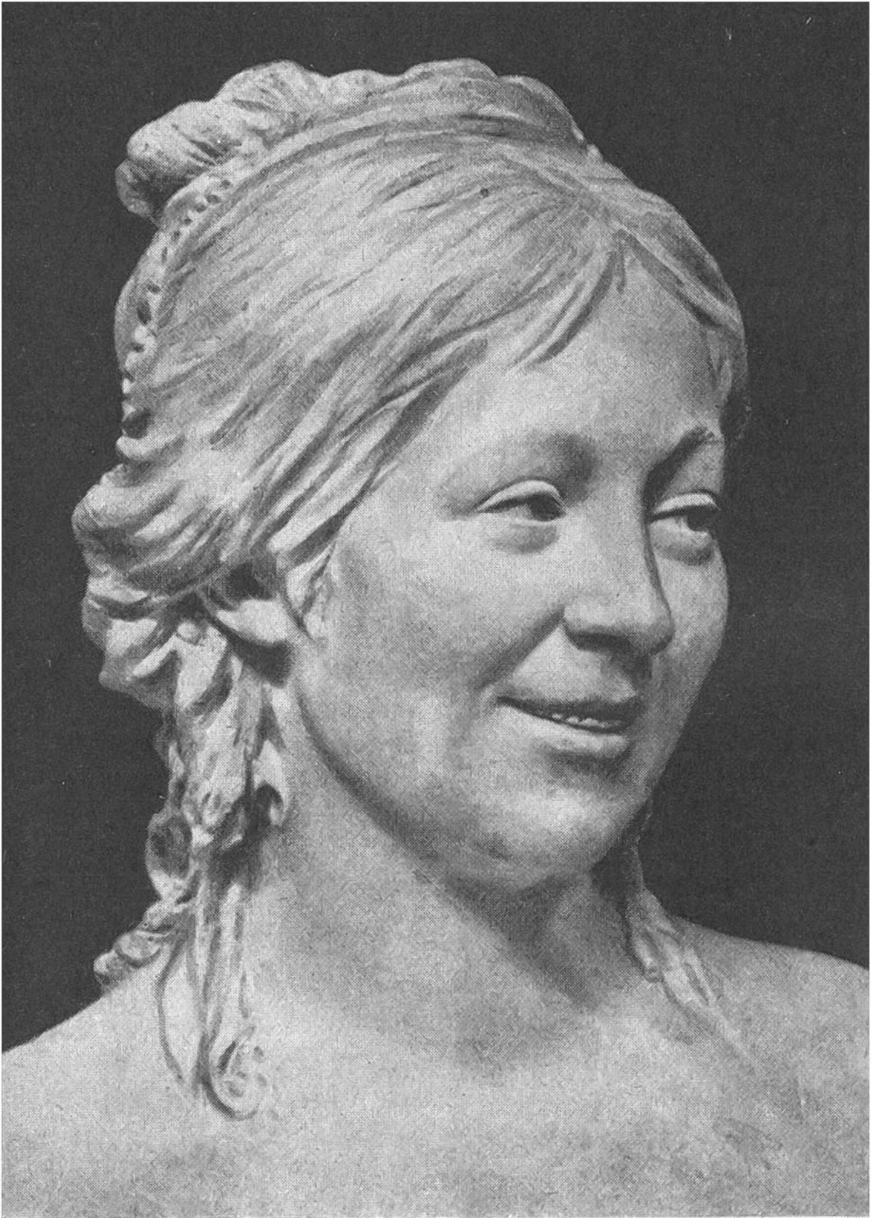
Jean-Antoine Houdon BILDNISBÜSTE SEINER FRAU.