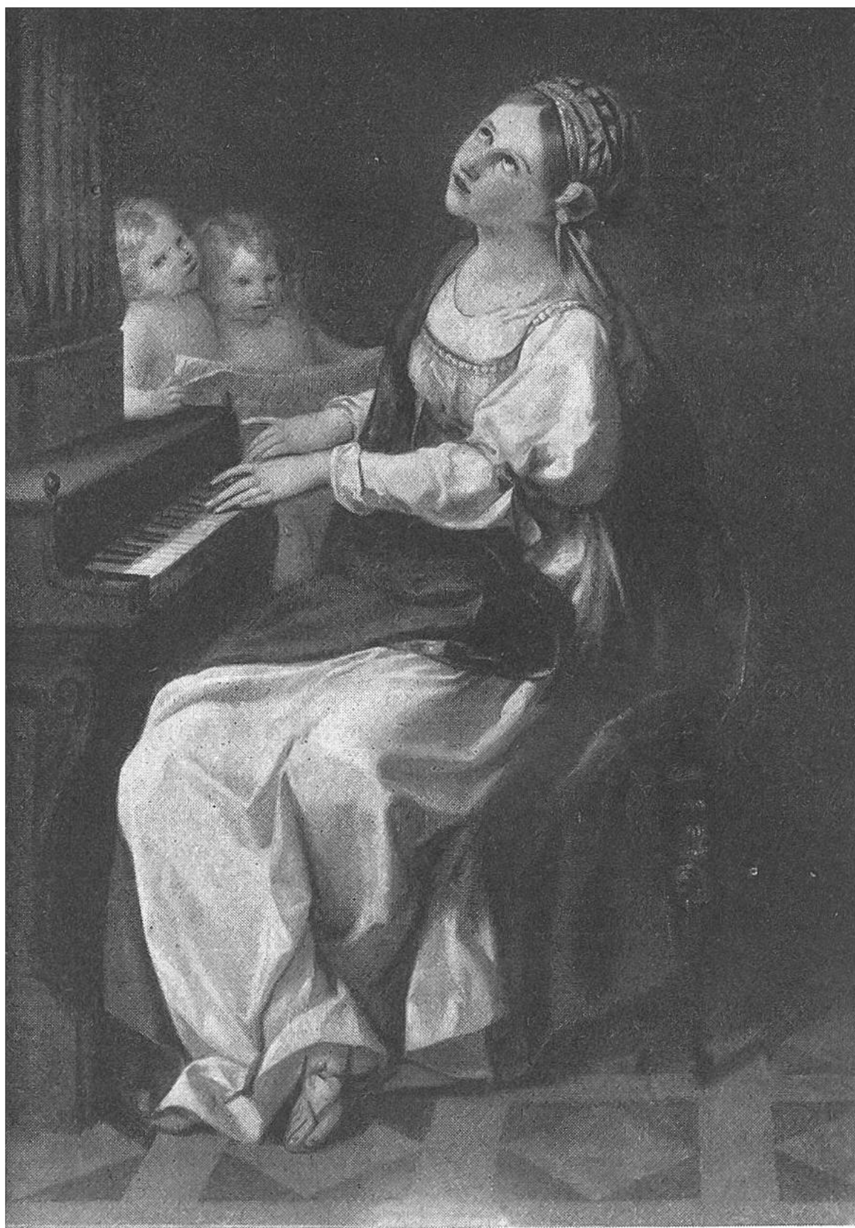
HEILIGE CÄCILIA AN DER ORGEL, von Angelika Kauffmann.

Eigentum der Gottfried-Keller-Stiftung, deponiert im Kunstmuseum in Bern.