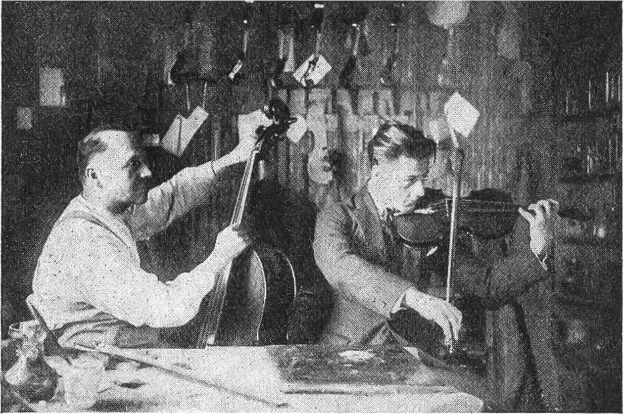
Der Meister probiert eigenhändig jede Geige, bevor sie die Werkstatt verlässt.

wird, so fehlt Fabrik-Instrumenten doch der individuelle Wert. Eine solche Geige wird nie das gleiche harmonische Ganze bilden, wie eine, die von einem Meister in allen Einzelheiten selbst hergestellt und zusammengefügt wurde.