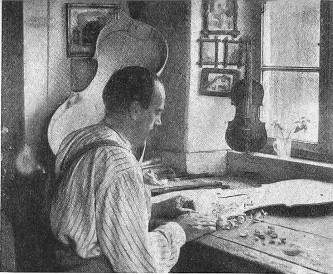
M i t t e n w a l d e r G e i g e n - u n d C e l l o - m a c h e r . H i e r w e r d e n d i e D e c k e l a u s g e h ö h l t .

schliessen lässt; auch die Heimat des Bogens ist wahrscheinlich Indien.