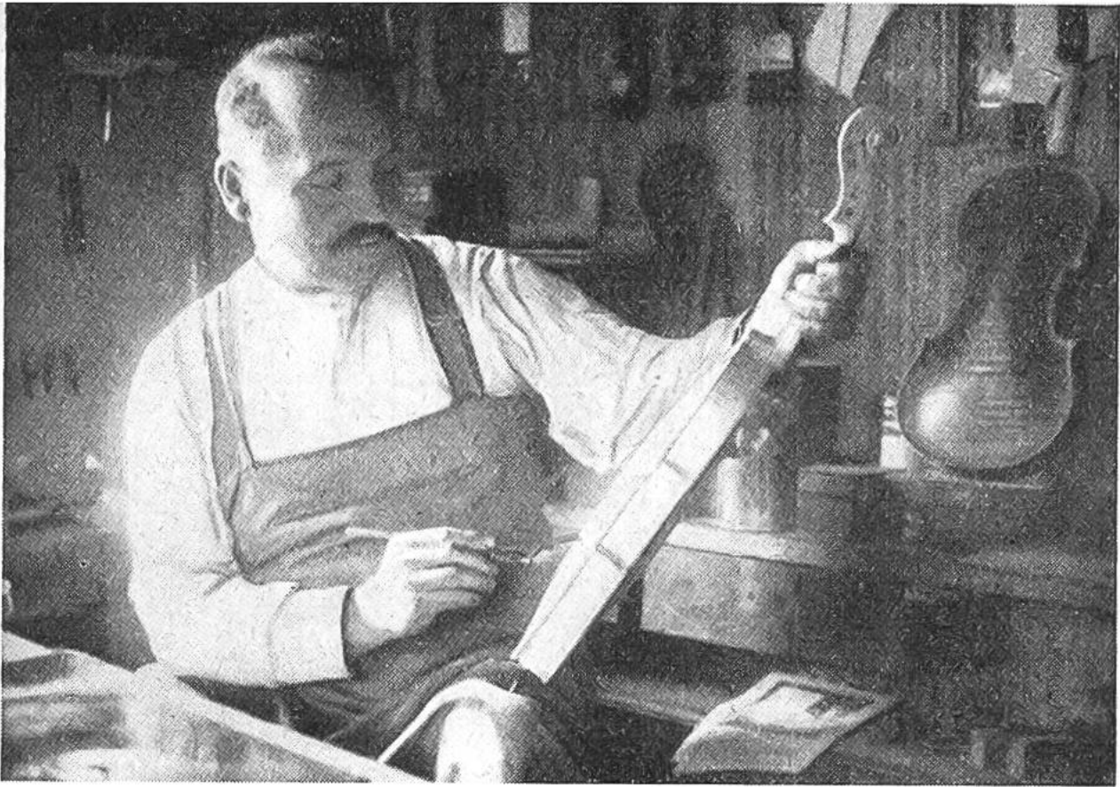
Geigenmacher beim Lackieren einer Geige.

durch diejenige von Cremona überflügelt wurde. Früher stellte der Geigenmacher mit viel Liebe und Sorgfalt seine Geigen von Hand her. Das Schicksal jedes Instrumentes lag ihm am Herzen, fast wie das eines Kindes. Die Violinen trugen auch alle seinen Namen; es war dies ein Grund mehr für den Meister, sich redlich zu bemühen, jedem Instrument den besten Klang zu verleihen.