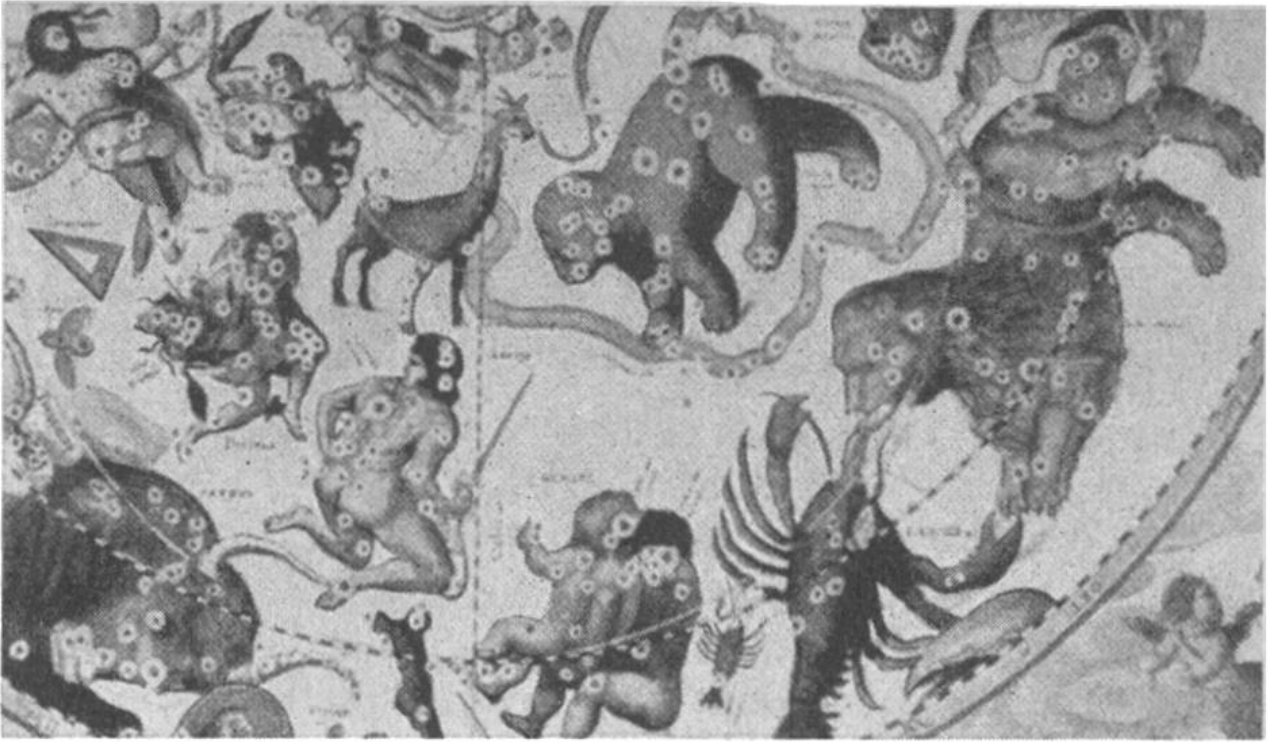
Teilstück einer Sternkarte aus dem Jahre 1660. Vor lauter Bildern erkennt man die Sterne kaum mehr.