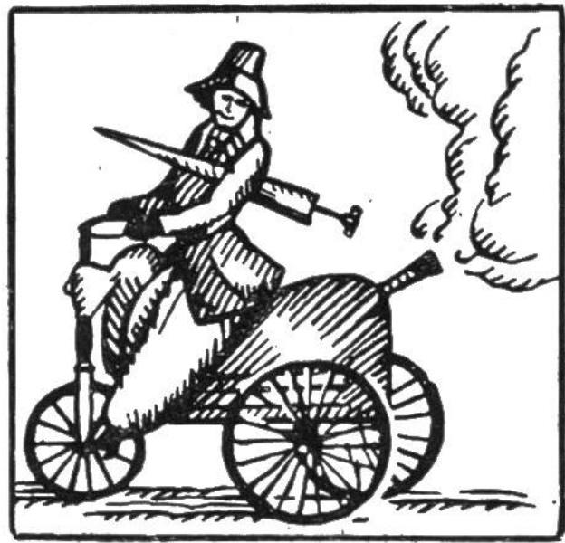
Französische Karikaturen auf die Dampfmaschinen aus dem Jahre 1820.

fangen. Das abschätzende Urteil, mit dem man den Erfinder treffen möchte, fällt leicht auf den Spötter zurück, und er kann damit zu einer unerwünschten Berühmtheit gelangen. So ging es einem deutschen Fürsten, der erklärte, es sei eine Verrücktheit, Eisenbahnen zu bauen, da die Postkutschen ja schon schlecht besetzt seien.