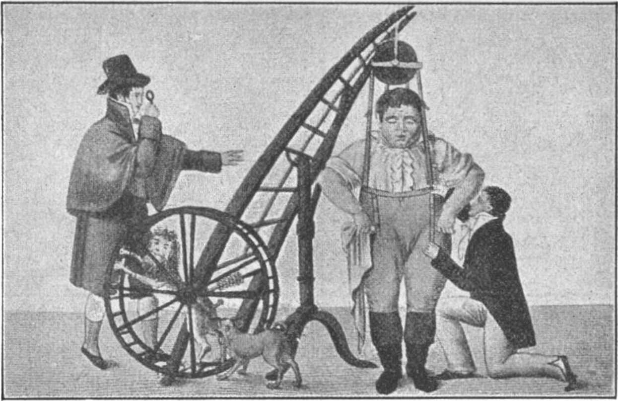
Spottblatt auf die Hosenträger, aus dem Jahre 1812. Zu Ende des 18. Jahrhunderts kamen in Paris, statt der bisher getragenen Leibgurte, die Hosenträger auf. Man machte sich anfangs darüber sehr lustig.