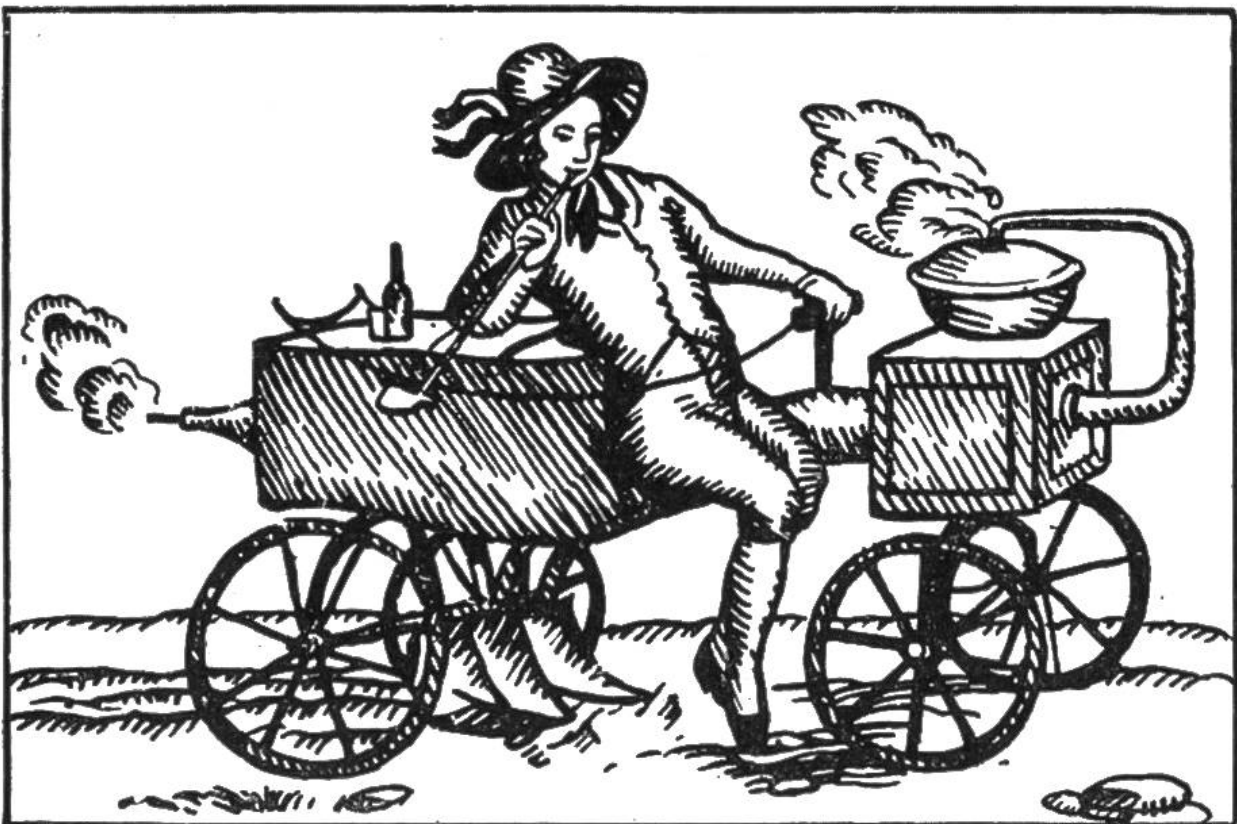
Dampfmaschinenpflug (nach einem alten Stich). Der Pflüger kann gemütlich sitzen und sein Pfeifchen rauchen, während die Universalmaschine die Arbeit besorgt.

fangen. Das abschätzende Urteil, mit dem man den Erfinder treffen möchte, fällt leicht auf den Spötter zurück, und er kann damit zu einer unerwünschten Berühmtheit gelangen. So ging es einem deutschen Fürsten, der erklärte, es sei eine Verrücktheit, Eisenbahnen zu bauen, da die Postkutschen ja schon schlecht besetzt seien.