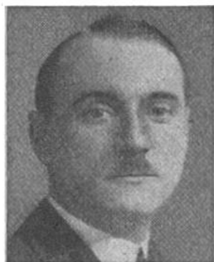
Dr. Marcel Pilet v. Château-d'Oex * 1889, seit 1929 im Amte Polit. Departem.