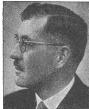
Dr. Karl Kobelt von Marbach (St. G.) * 1891, seit 1941 i. Amte Militärdepartem.