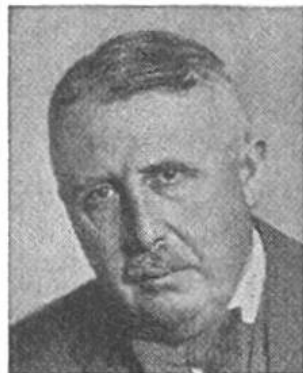
Eduard v. Steiger von Bern * 1881, seit 1941 im Amte Justiz- u. Polizeid.