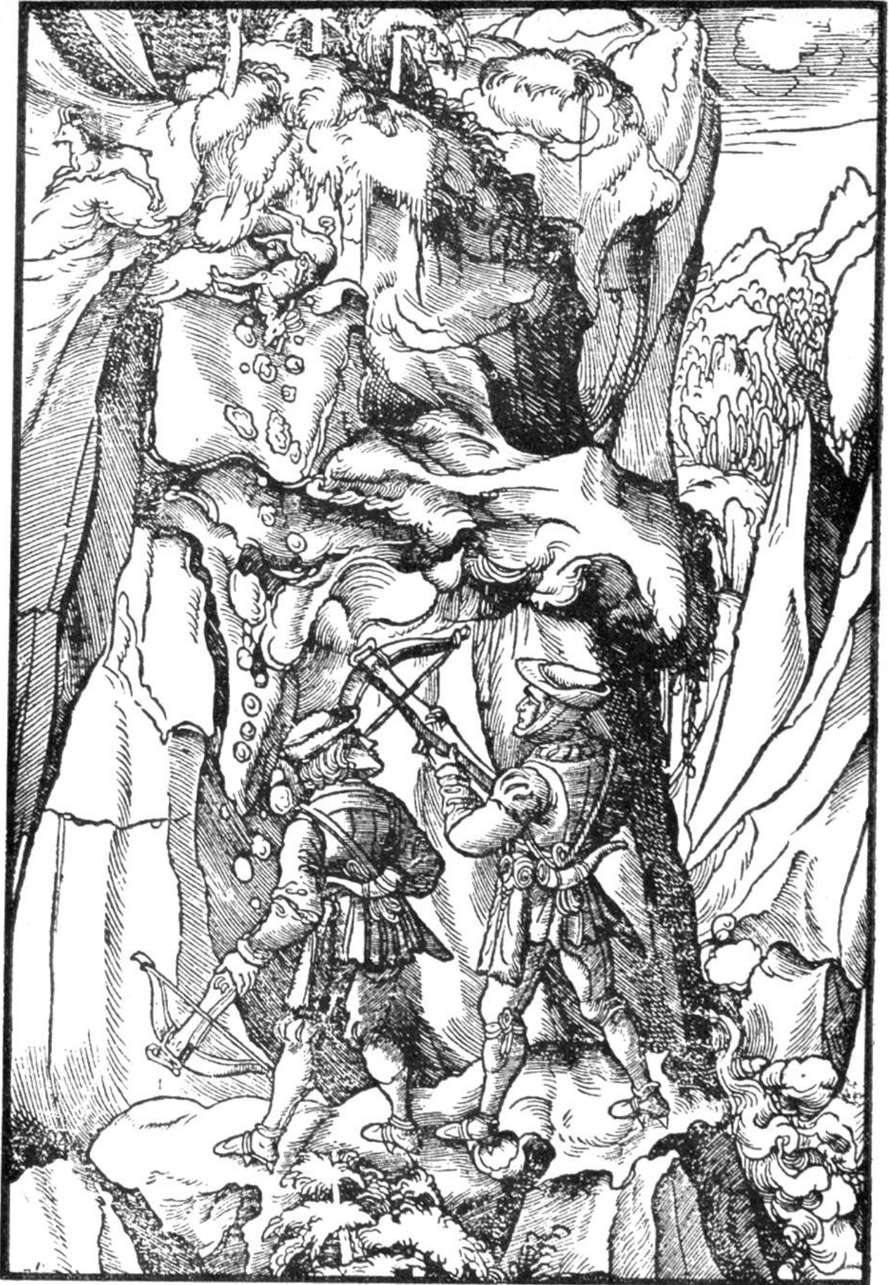
AUF DER GEMSJAGD Holzschnitt von Hans Burgkmair.