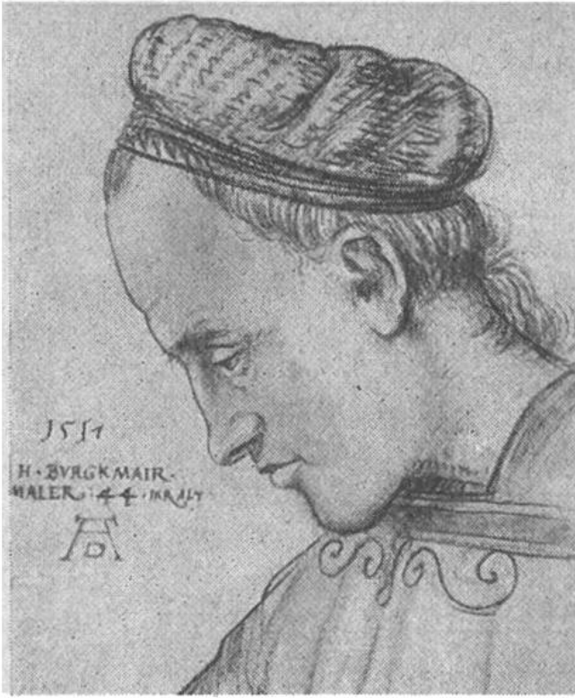
Selbstbildnis des Künstlers. (Dürer-Monogramm später hinzugefügt.)