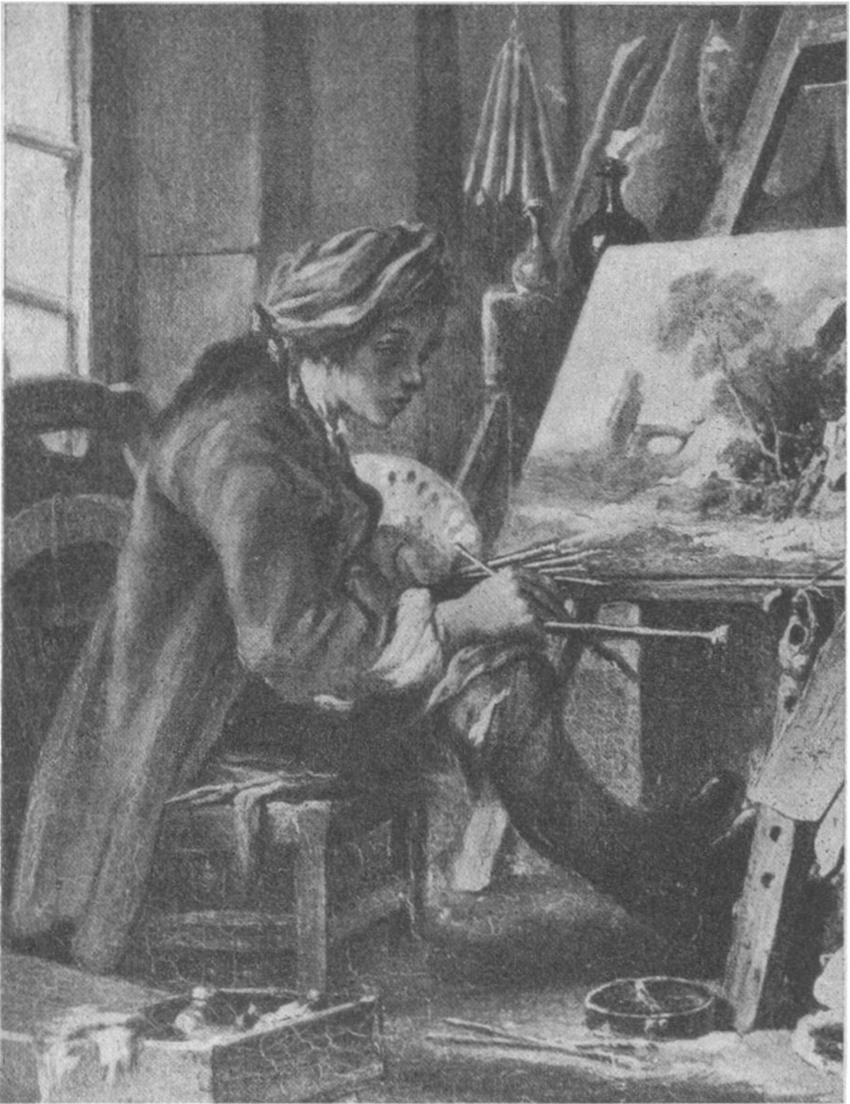
FRANÇOIS BOUCHER IN SEINEM ATELIER Selbstbildnis.