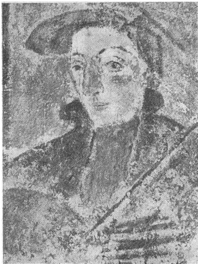
Selbstbildnis mit Pinsel und Palette, Freskogemälde am Haus zum Ritter in Schaffhausen.