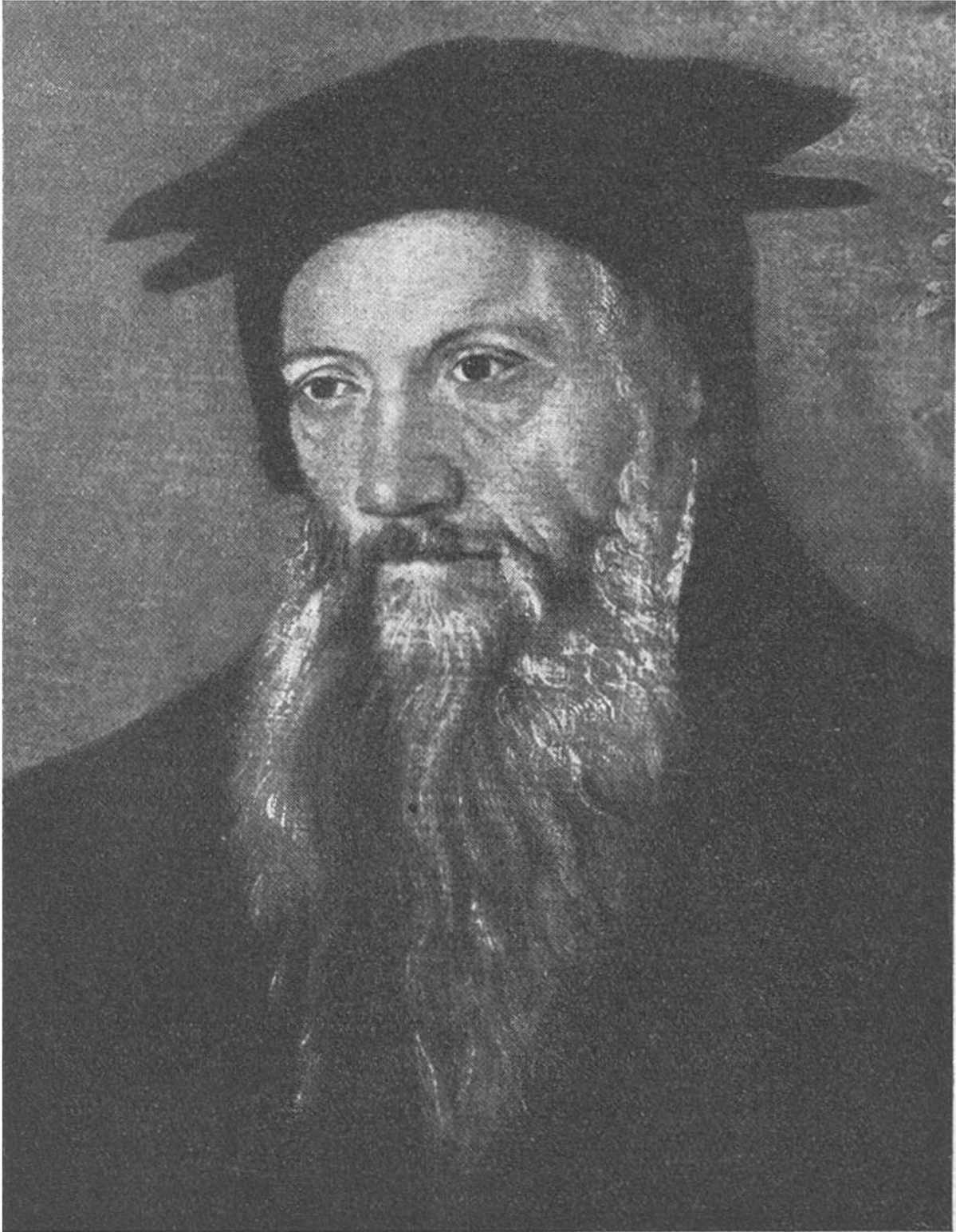
Konrad Gessner, Zürcher Arzt und Naturforscher, in seinem 48. Altersjahr gemalt von Tobias Stimmer.