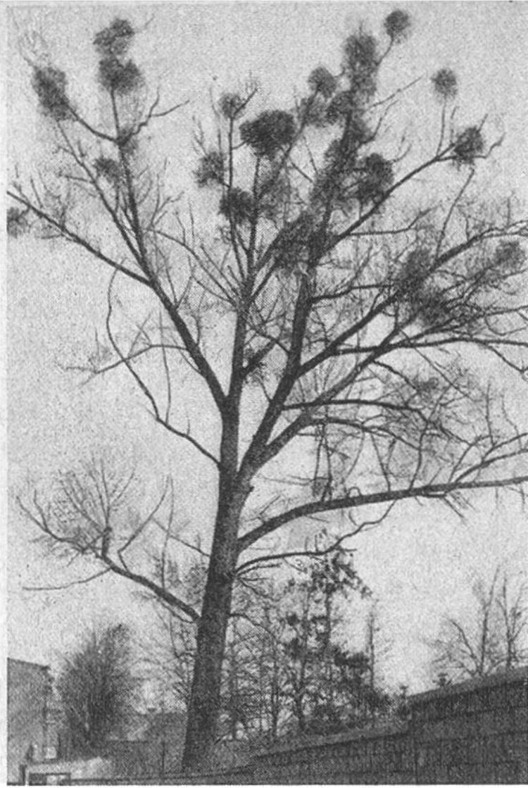
Hoch oben in den Baumkronen hat die Mistel ihren Standort.

Aus den Beeren der Mistel wurde früher Vogelleim bereitet, der auch zum Fang der als Leckerbissen sehr begehrten Misteldrossel diente. Diese brachte sich durch Verbreitung der Schmarotzerpflanze gewissermassen selbst ins Unglück.