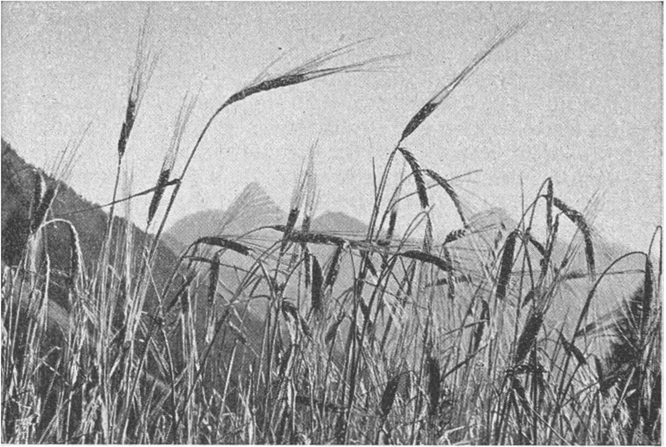
Erntesegen. — In abgelegenen Bündner Tälern findet man oft noch alte, einheimische Getreidesorten, wie z. B. diese klimaharte Sommergerste.

4,2 Millionenvolk ganz aus eigenem Grund und Boden zu ernähren, noch lange nicht am ersehnten Ziele angelangt. Die letzte Kolonne der Tabelle zeigt den von Dr. Wahlen, dem Beauftragten des Bundesrates für den Mehranbau, aufgestellten Anbauplan. Nach seinen sorgfältigen Berechnungen wären wir erst bei einer Ackerfläche von etwas über einer halben Million Hektar in der Ernährung von fremder Zufuhr unabhängig. Im Frühjahr 1942 befanden sich aber trotz äusserster Anstrengung unserer Landbevölkerung bei der Erfüllung der bisherigen Mehranbauetappen „erst“ 310 000 ha unter dem Pfluge (Vorkriegszeit 185 000 ha). Das Jahr 1942/43 soll uns nun um nicht weniger als weitere 100 000 ha dem Ziele näher bringen. Davon sind 52 000 ha aus Waldrodungen, Entsumpfungen und Umbruch von Alpweiden vorgesehen; die restlichen 48 000 ha haben Landwirtschaft und Industriepflanzwerk zusätzlich zu bewältigen. Nicht nur jeder Bauer, auch jedes grössere Unternehmen