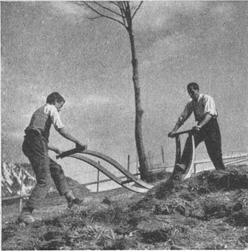
Der Bergbauer beim Rasen- schälen mit pri- mitivem, aber sinn- reichem Handgerät.