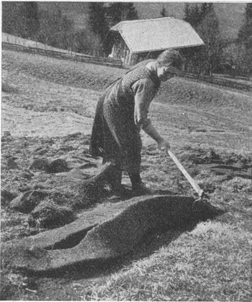
In mühseliger Handarbeit wendet und zerkleinert diese Bergbäuerin die zähen „Rasenmatten“.

genossen erfassen wir erst in seiner ganzen Tragweite, wenn wir uns einmal überlegen, was eigentlich auf dem Spiele steht. Es geht um nicht mehr und nicht weniger als um die möglichst weitgehende Ernährung des Schweizervolkes aus eigenem Boden. Was das aber in Zahlen heissen will, beleuchten folgende Angaben aus der Anbaustatistik: