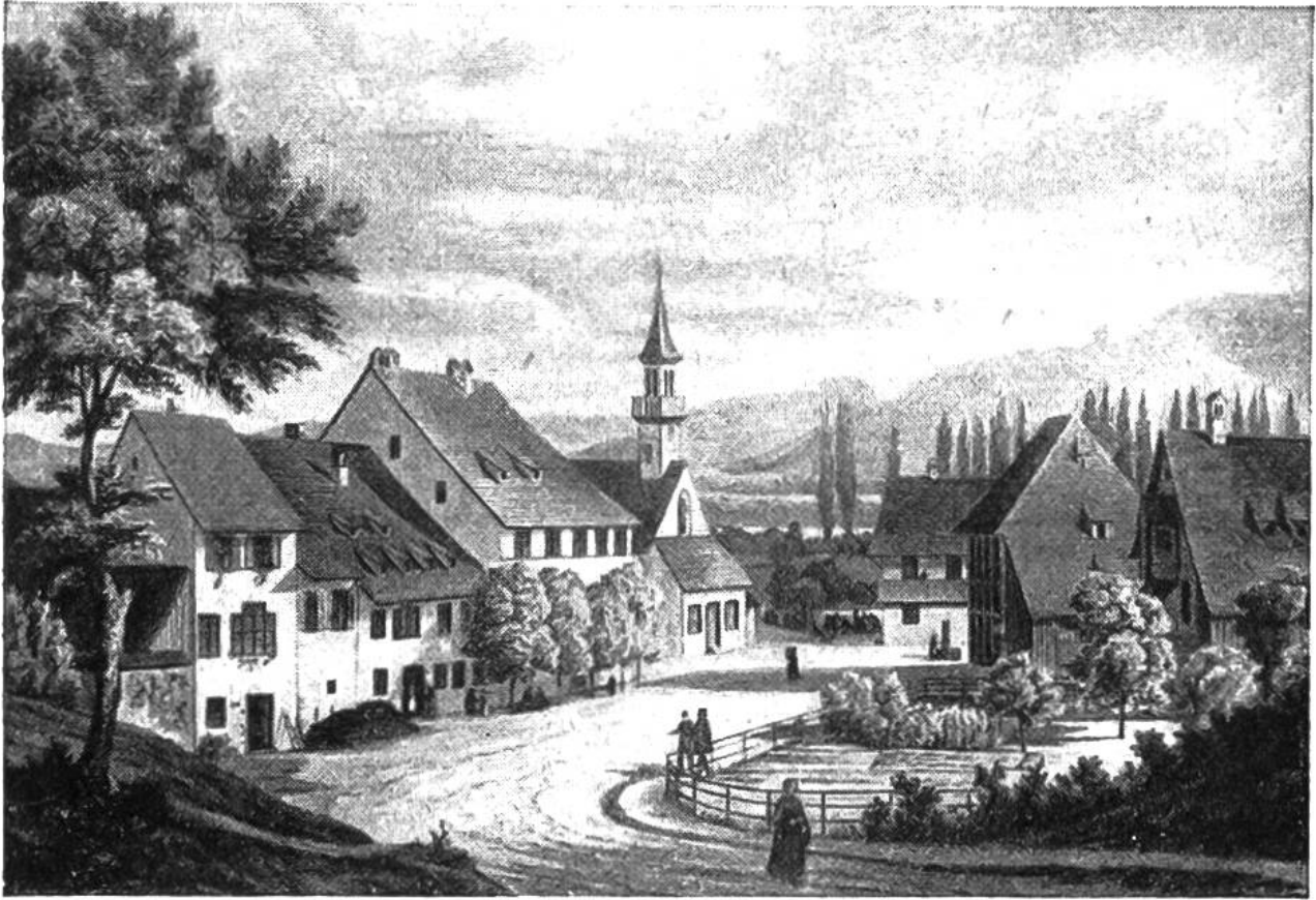
Ansicht von St. Jakob an der Birs. (Stich aus dem Jahre 1843.)