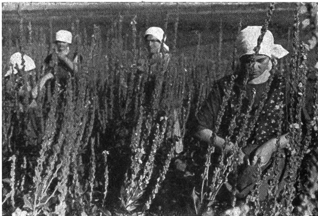
Königskerzenblüten müssen während der Blütezeit jeden Morgen abgezapft werden.

lichen Drogen ernsthaft gefährdet. Hier öffnet sich nun ein weites und dankbares Feld für hilfsbereite Buben und Mädchen, die sich mit ihrer Arbeit für die Gesundheit ihrer Familie und des ganzen Schweizervolkes einsetzen wollen. Das Sammeln von wildwachsenden Heilpflanzen ist der längst bekannte Weg, den wohl viele von euch, liebe Leser, schon beschritten haben. Es setzt vor allem eine genaue Kenntnis der heilkräftigen Arten und das Vertrautsein mit deren Vorkommen voraus. Das Sammeln ergibt oft nur minderwertige und vor allem ungleichmässige Ware. Zudem gefährdet ihr damit leicht den Bestand unserer Wildflora, die ohnehin durch die vielen Kulturmassnahmen schon stark in Mitleidenschaft gezogen wurde.