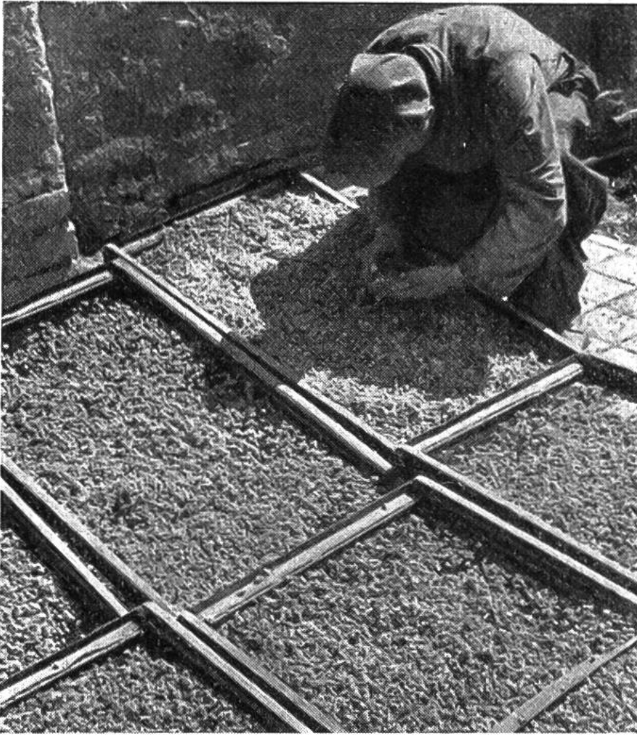
Trockenhurden sind an der Sonne ausgelegt. Durch öfteres Wenden wird die Trocknung beschleunigt.

wird der Mutter durch Anpflanzung von Heilpflanzen und Teekräutern viel Freude bereiten.