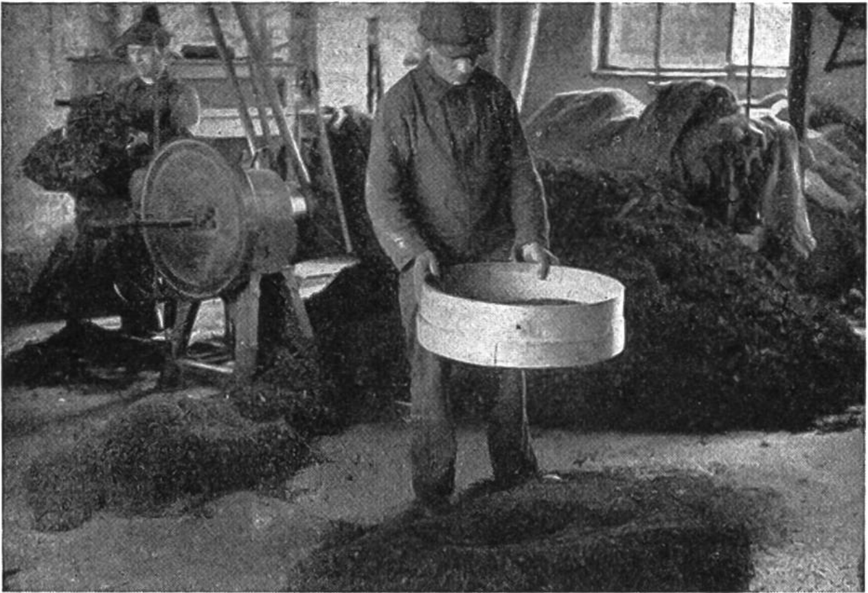
Zerkleinern und Reinigen der Drogen geschieht im Grossbetrieb durch Maschinen.

mian, Eibisch und Liebstöckel. Für die Beschaffung von Pfeffermünzstecklingen sind wir auf gute Kultursorten angewiesen und hüten uns vor dem Sammeln wilder Pflanzen.