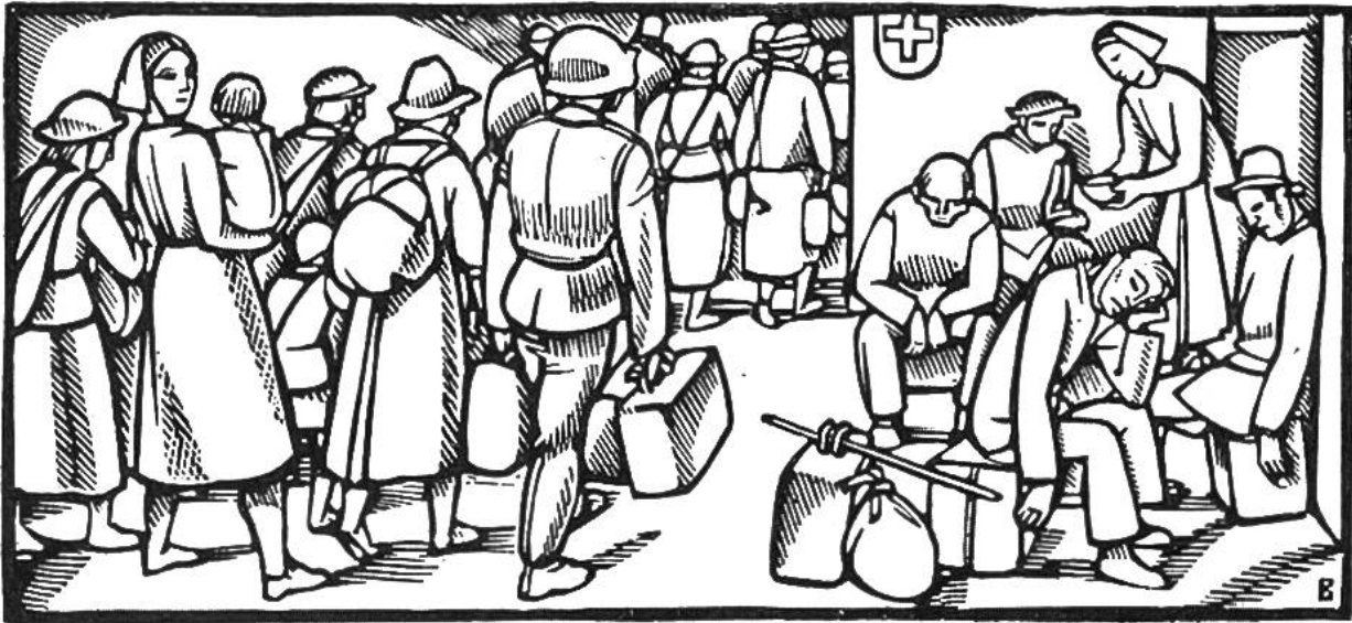
Zivilflüchtlinge erreichen die Schweizer Grenze.

auf Belgien, Holland, Luxemburg. Churchill wird engl. Ministerpräsident. 11.: 2. Generalmobilmachung d. schweiz. Armee. 15.: Holland u. 28.: Belgien kapitulieren. Juni 6.: Beginn der neuen deutschen Offensive gegen Frankreich. 10.: Norwegen kapituliert. 11.: Italien erklärt Grossbritannien u. Frankreich d. Krieg. 14.: Einmarsch deutscher Truppen in Paris. 17.: Russland besetzt nach Litauen auch Lettland u. Estland. 18.-21.: nahezu 40000 alliierte Truppen überschreiten die Schweizergrenze im Berner Jura. 22.: Waffenstillstand zw. Deutschland u. Frankreich u. 24.: zw. Italien u. Frankreich. 28.: Rumänien tritt Gebiete Bessarabiens u. der Nordbukowina an Russland ab. Sept. 6.: Abdankung König Carols von Rumänien zugunsten seines Sohnes Michael. 27.: Abschluss des Drei-Mächte-Paktes in Berlin zw. Deutschland, Italien u. Japan. Nov. 5.: Einmarsch ital. Truppen in griechisches Gebiet. Roosevelt wird zum 3. Mal als Präsident der U.S.A. gewählt. 7.: Beginn der allnächtlichen Verdunkelung in der Schweiz. 20.-24.: Ungarn, Rumänien u. die Slowakei treten dem Drei-