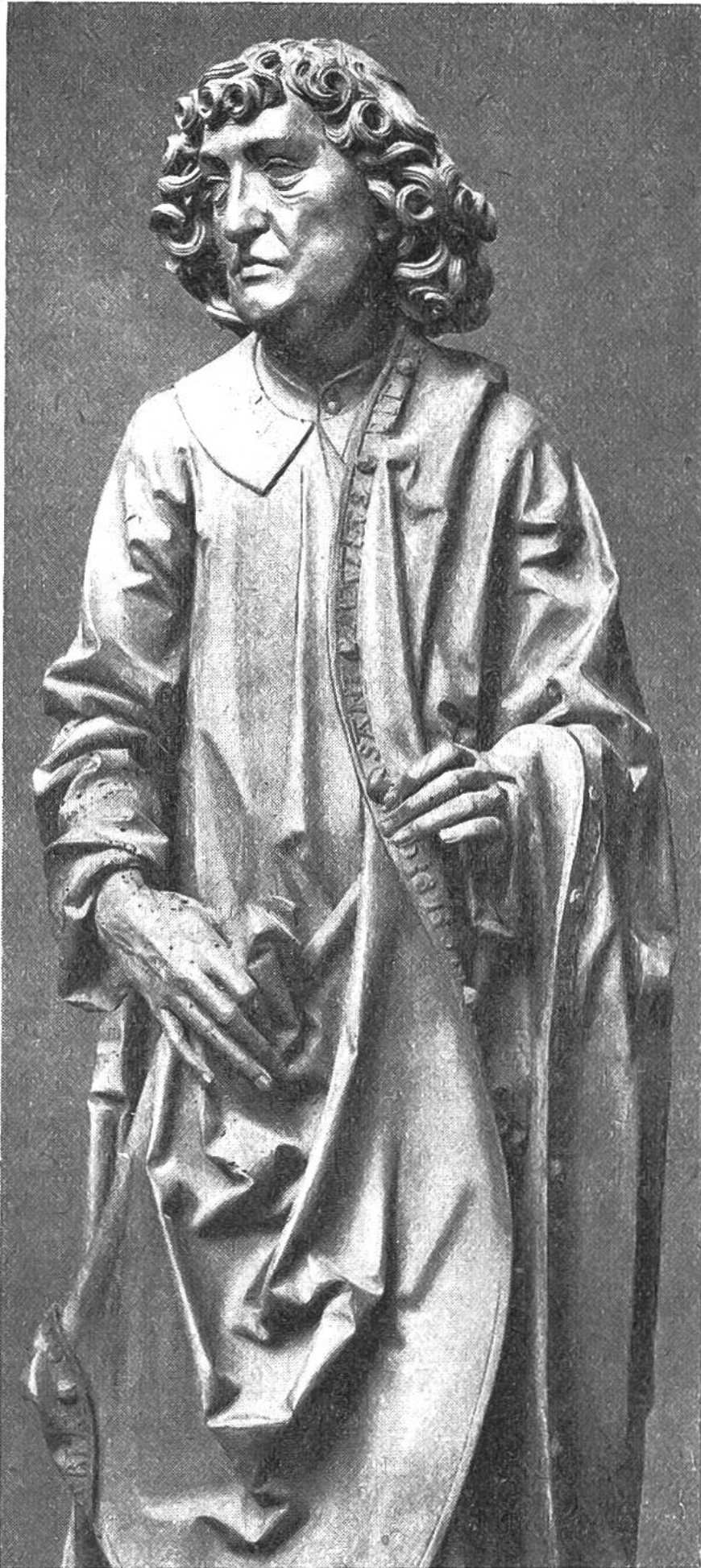
APOSTEL MAT- THÄUS, Holzfi- gur von Tilman Riemenschneider.