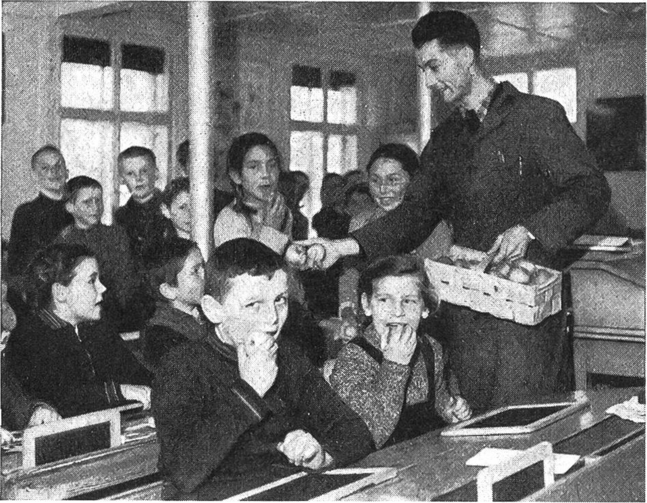
Die Kinder aus Flühmatten schrieben den Spendern im Unterland: „Wir freuen uns den ganzen Morgen auf die Pause“.

Schule“ und erzählten von den Feldern und Tieren, die wir haben und die wir besorgen helfen. Einmal schickten uns die Schüler von Flühmatten ein Bild ihrer Schule, das hängt jetzt in unserem Zimmer. Wir kennen uns schon gut dort oben aus, und vielleicht werden wir im Sommer sogar eine Schulreise dorthin machen.