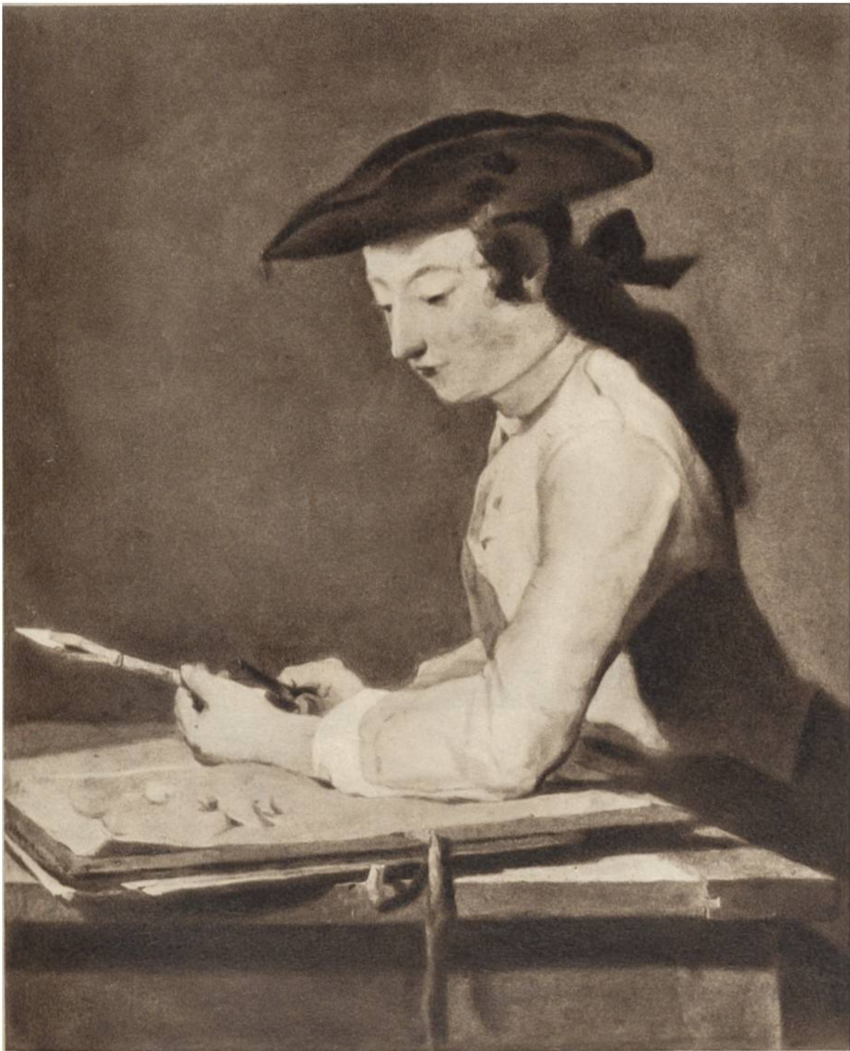
Der Zeichner, von J. B. S. Chardin, Paris, 1699-1779.