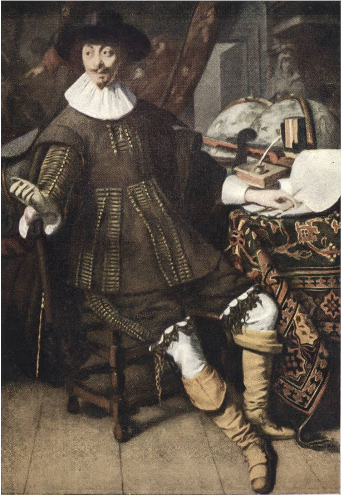
DER KAUFMANN von Thomas de Keyser, Amsterdam, 1596—1667.