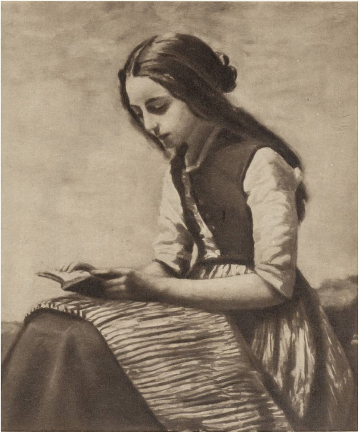
Lesendes Mädchen, von Camille Corot, Paris, 1796-1875. (Privatbesitz Winterthur.)