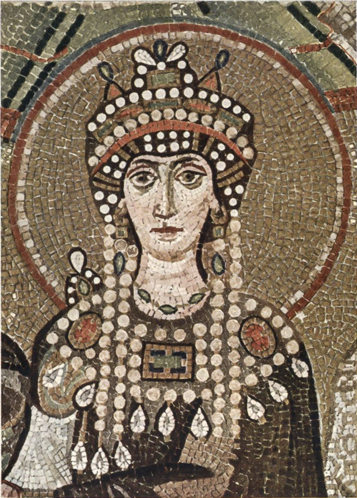
KOPF DER BYZANTINISCHEN KAISERIN THEODORA Mosaik in Ravenna aus dem Jahre 548 n. Chr.