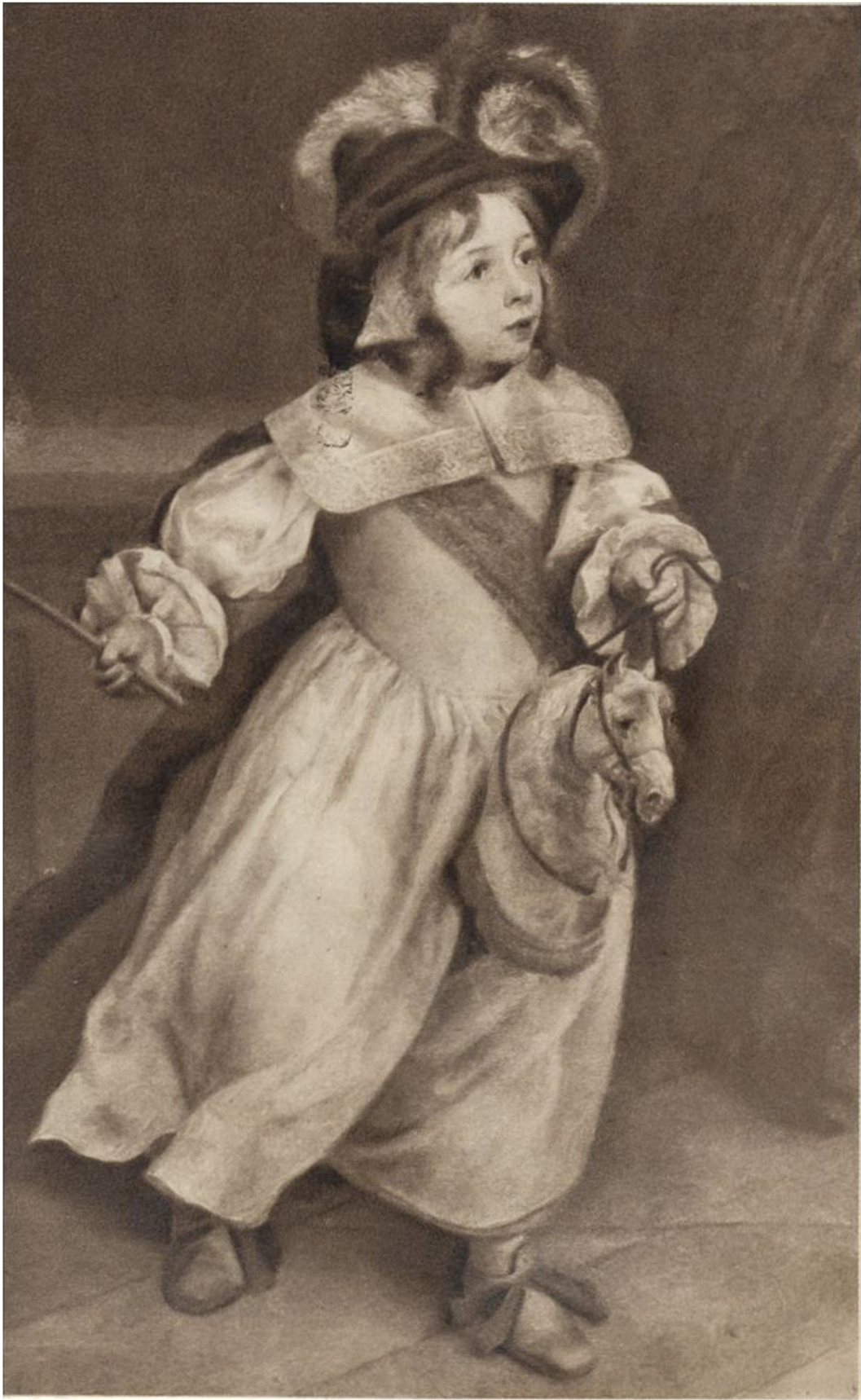
Mädchen mit Steckenpferd, aus einem Familienbild, von Gonzales Coques, Antwerpen, 1614-1684.