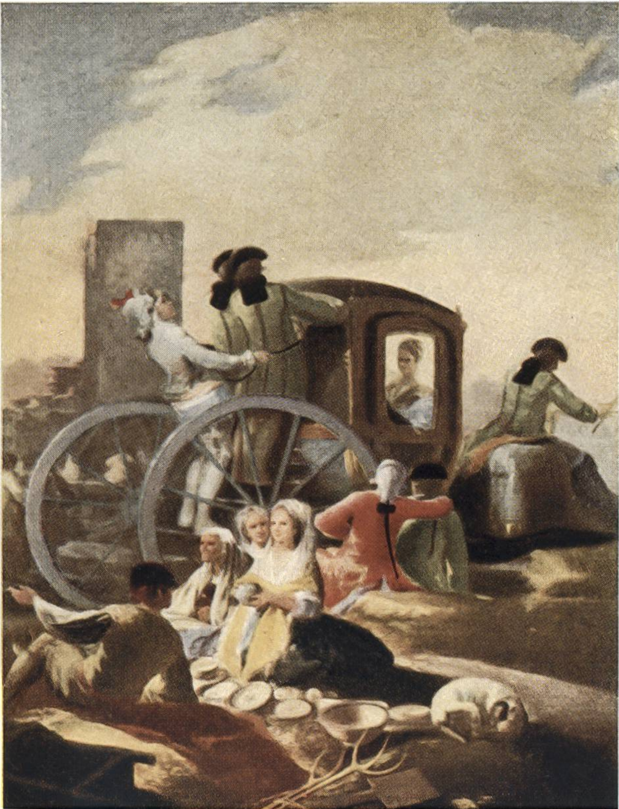
DER TÖPFERWARENHÄNDLER von Francisco Goya, Madrid, 1746—1828.