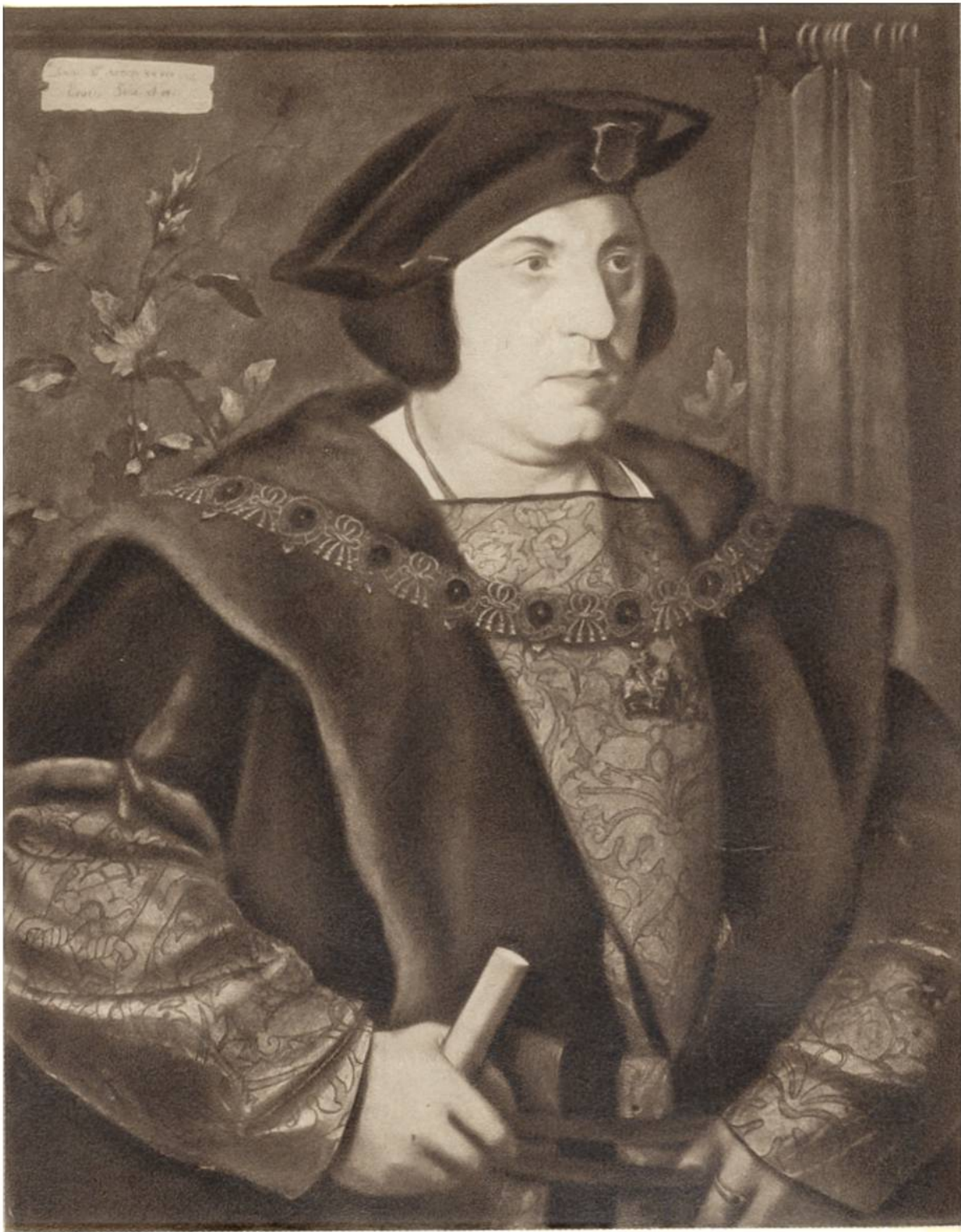
Bildnis eines englischen Adligen, von Hans Holbein d. J., Basel und London, 1497-1543.