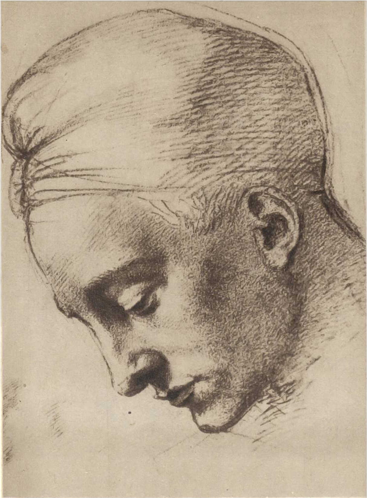
Studienkopf, Rötzelzeichnung von Michelangelo, Rom, 1475-1564.