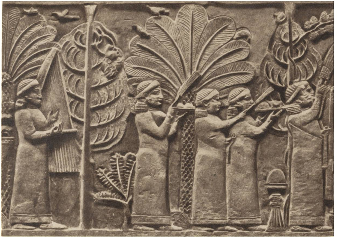
Gartenszene mit Dattelpalme, Feige und Weinstock, assyrisches Steinrelief aus dem 7. Jahr- hundert v. Chr.