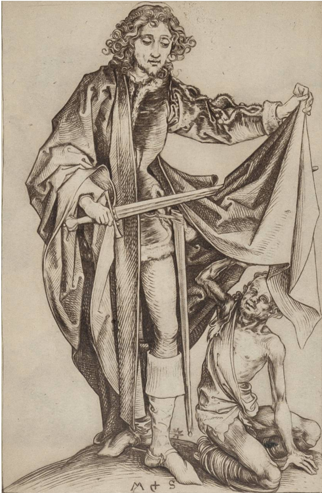
Der hl. Martin von Tours (4. Jahrhundert) schenkt dem Armen ein Stück seines Mantels, Kupferstich von Martin Schongauer, Colmar, um 1445-1491.