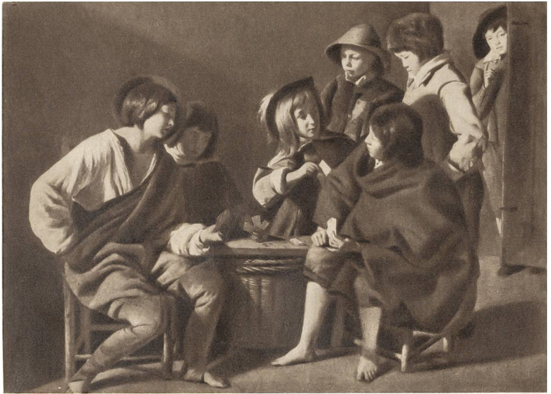
Die jungen Kartenspie- ler, v. Le Nain, Paris, um 1600.