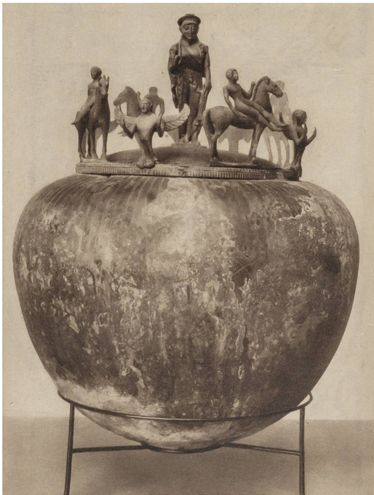
Etruskische Bronze-Urne aus dem 6. Jahrhundert v. Chr.