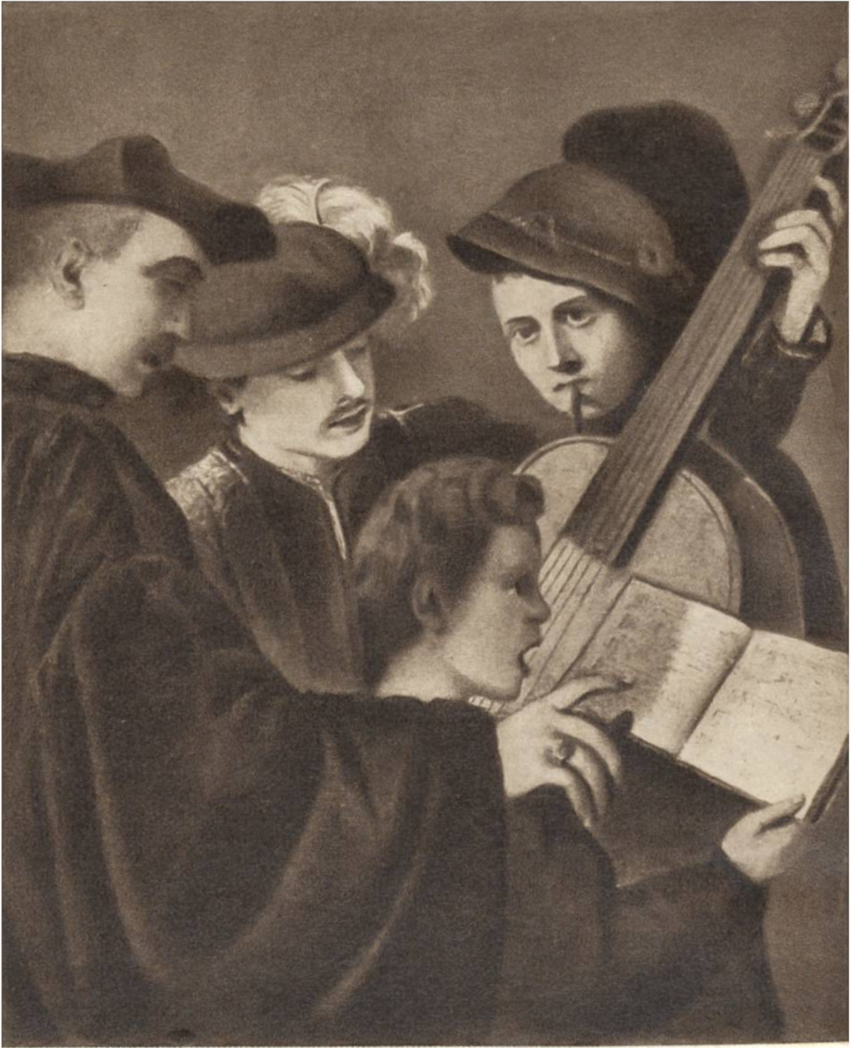
Das Konzert, von Tizian, Venedig, 1477-1576.