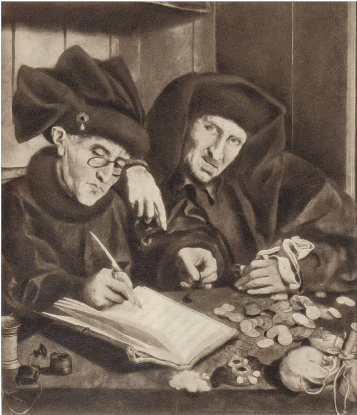
Geldwechsler mit seiner Frau, von Quinten Matsijs, Antwerpen, 1460-1530.