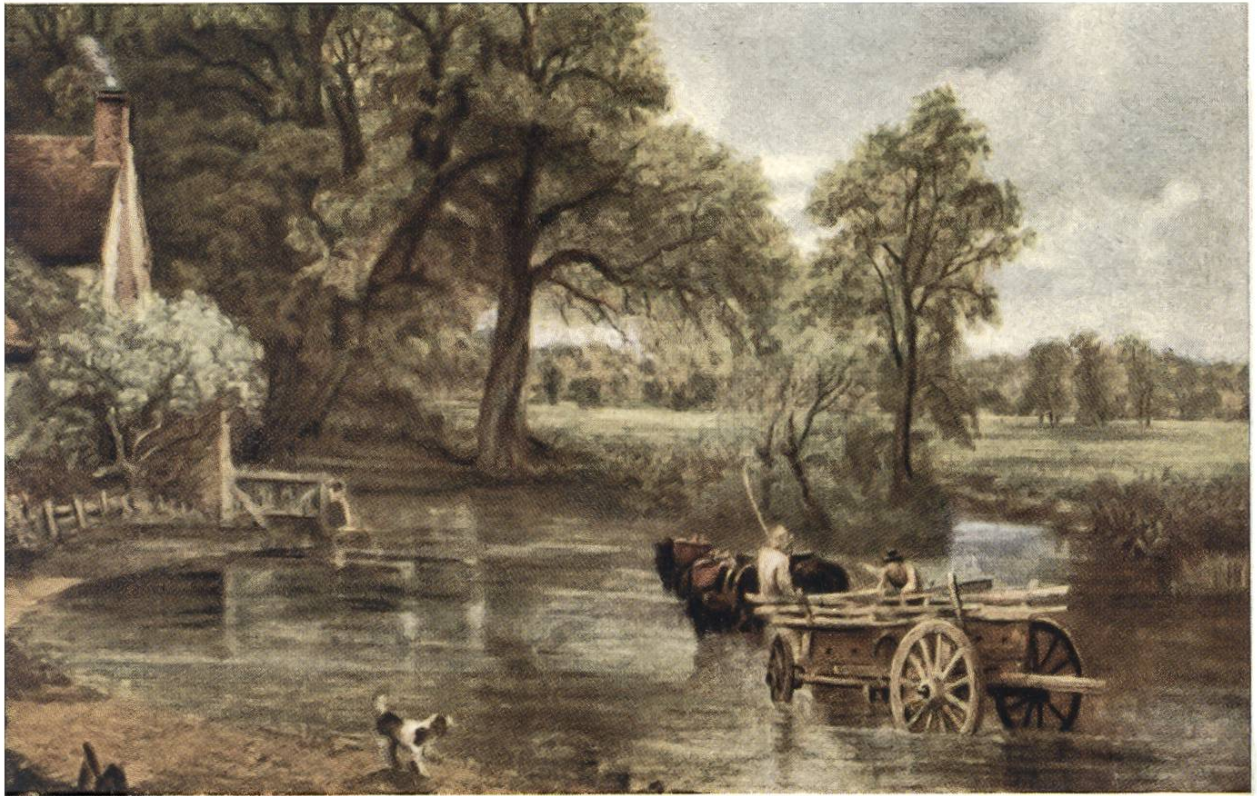
HEUWAGEN, von John Constable, London, 1776—1837.