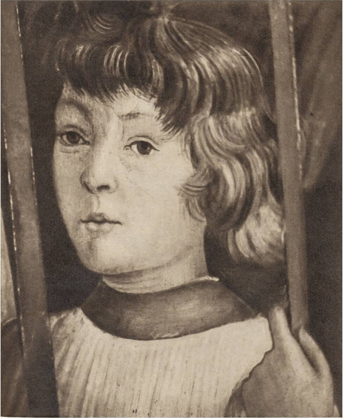
Chorknabe aus dem Freskengemälde «Tod der Santa Fina» in S. Gimignano, von Ghirlandajo, Florenz, 1449-1494.