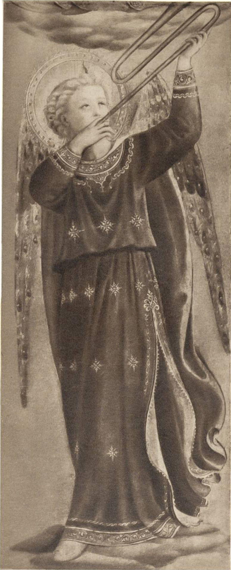
Musizierender Engel, von Fra Angelico da Fiesole, Florenz, 1387-1455.