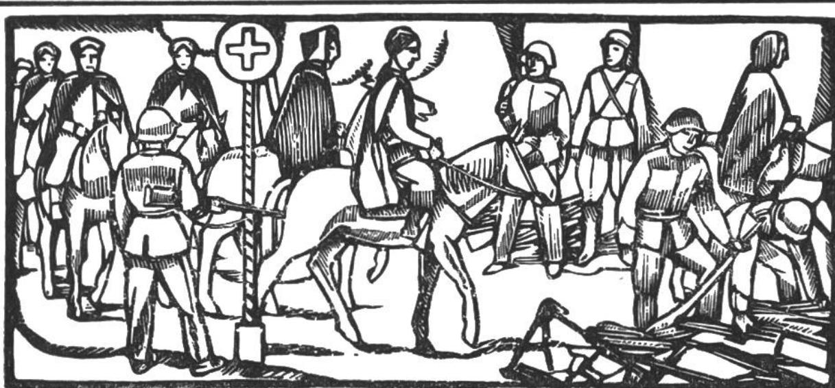
Im Juni 1940 überschreiten nahezu 40 000 alliierte Truppen die Schweizergrenze. Waffenabgabe der Spahis im Berner Jura.

burg. Churchill wird engl. Ministerpräsident. 11.: 2. Generalmobilmachung d. schweiz. Armee. 15.: Holland u. 28.: Belgien kapitulieren. Juni 6.: Beginn der neuen deutschen Offensive gegen Frankreich. 10.: Norwegen kapituliert. 11.: Italien erklärt Grossbritannien u. Frankreich d. Krieg. 14.: Einmarsch deutscher Truppen in Paris. 17.: Russland besetzt nach Litauen auch Lettland u. Estland. 18.–21.: nahezu 40 000 alliierte Truppen überschreiten die Schweizergrenze im Berner Jura. 22.: Waffenstillstand zw. Deutschland u. Frankreich u. 24.: zw. Italien u. Frankreich. Sept. 6.: Abdankung König Carols v. Rumänien zugunsten s. Sohnes Michael. 27.: Abschluss des Drei-Mächte-Paktes in Berlin zw. Deutschland, Italien u. Japan. Nov. 5.: Einmarsch ital. Trupp. in griech. Gebiet. Roosevelt wird zum 3. Mal als Präsident der USA. gewählt. 7.: Beginn der allnächtl. Verdunkelung i. d. Schweiz. 20.–24.: Ungarn, Rumänien u. die Slowakei treten dem Drei-Mächte-Pakt bei. Dez. 6.: Brit. Offensive gegen Libyen (6. Jan. 41 Bardia, 23. Jan. Tobruk erobert).