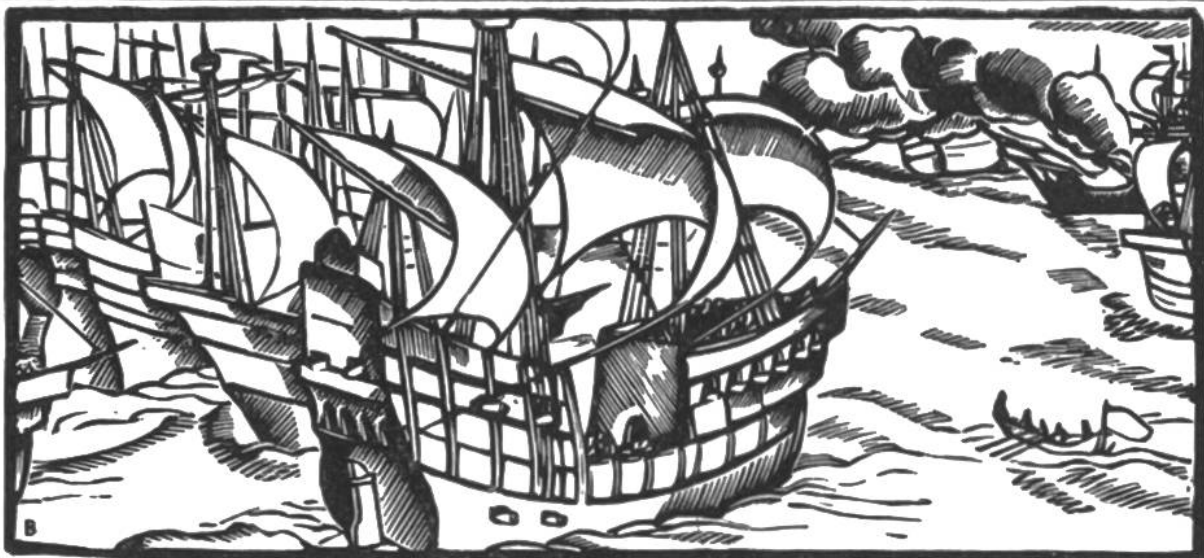
Die Engländer besiegen die mächtige spanische Flotte Armada, 1588.