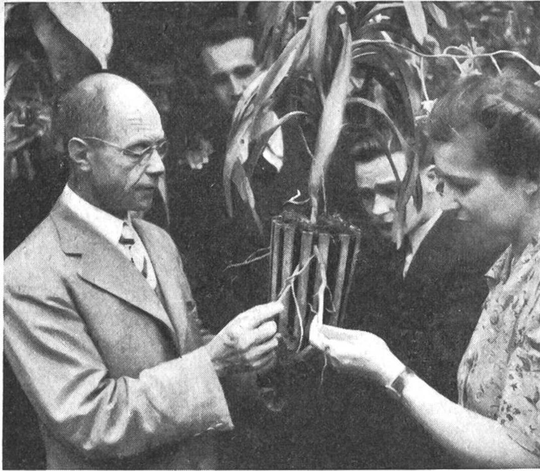
Anschauungsunterricht im Botanischen Garten.

jeder zugeben, dass unsere kleine Schweiz in mancherlei Hinsicht an diesen überseeischen Gebieten ausserordentlich interessiert sein muss. Lebhaftige Handelsbeziehungen bestehen zwischen der Schweiz und jenen fernen Ländern; für mehrere hundert Millionen Franken werden alljährlich über die riesigen Entfernungen Waren ausgetauscht, und schliesslich ist zu berücksichtigen, dass viele schweizerische Forscher, Missionare, Ärzte, Geologen, Lehrer, Ingenieure, Techniker, Pflanzer, Sammler usw. in den Tropen tätig sind. Es bestehen also zwischen der Schweiz und den Tropen viele enge und überaus wichtige Beziehungen.