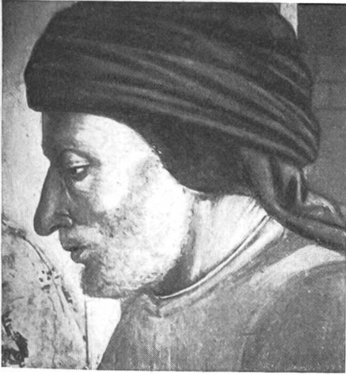
Freskenbildnis von Gozzoli (15. Jahrh.).