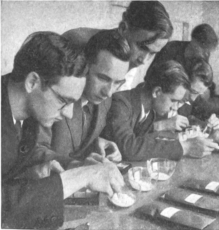
Schüler des Schweizerischen Tropeninstituts erlernen tropische Warenkunde.

zu angepasster Kleidung und Ernährung, zu ganz anderer Lebensweise. Wir sehen uns in den Tropen neuen Krankheiten, fremden Menschenrassen, einer wundersamen Tier- und Pflanzenwelt gegenüber. Es ist klar, dass in dieser eigenartigen, von der unseren so grundverschiedenen Umgebung derjenige grössere Erfolgsaussichten hat, der sorgfältig vorbereitet ist.