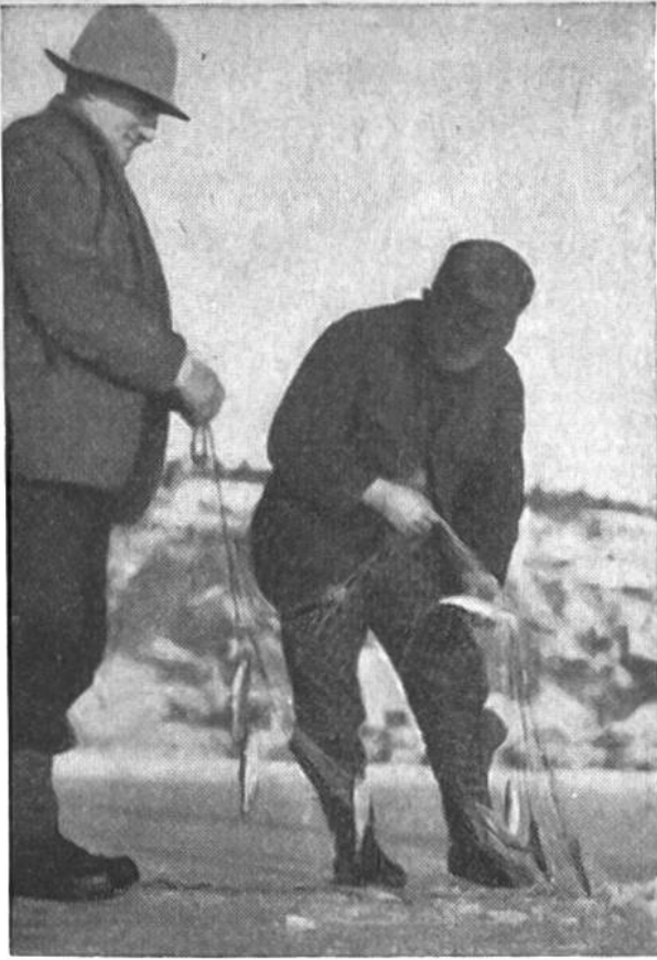
Nach einigen Stunden, wohl auch erst nach Tagen, wird das Netz aus dem Zugloch herausgezogen.