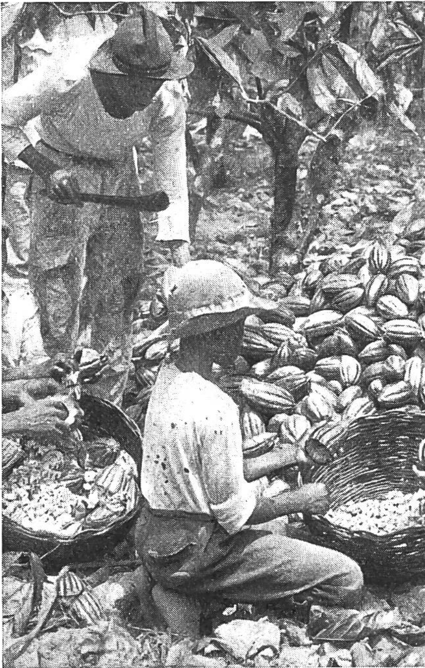
Die Kakaofrüchte werden mit einem scharfen Schlagmesser geöffnet und dann entleert.

Nach dieser Neuerung riss eine wahre Sucht nach dem Genuss von Kakao und Schokolade ein; der spanische Staat nahm das Monopol der Herstellung an sich und konnte mit grossem Nutzen das Geheimnis der Fabrikation wahren, bis es dennoch im Jahre 1606 durch den Italiener Carletti nach Italien entführt wurde. Von nun an fanden Kakao und Schokolade in vielen europäischen Ländern Eingang; sie wurden von den Ärzten als Heil- und Stärkungsmittel empfohlen und gehörten in die Salons der Vornehmen wie auf den Tisch des körperlich arbeitenden Volkes.