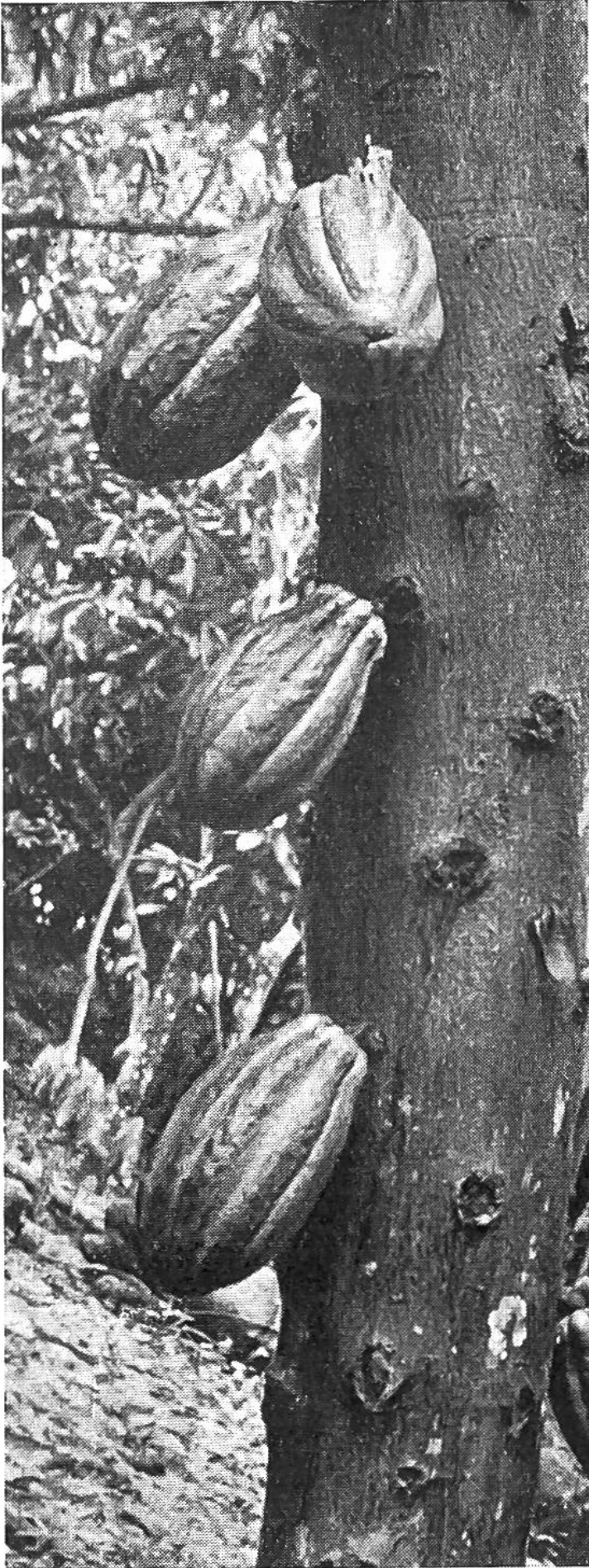
die Narben erkennen lassen, schon mehrmals abgeerntet worden ist.

sengenden Sonne der tropischen oder subtropischen Zone ausgelegt und gedörst, dann nach Bedarf geröstet und gemahlen werden. Während die einfacheren Schichten des mexikanischen Volkes dem mit Wasser abgekochten Bohnenextrakt sehr viel Maismehl und roten Pfeffer beifügten, würzten die vornehmeren Familien das immer kalt genossene Getränk mit Vanille, Ahornsafft oder süßem Honig.