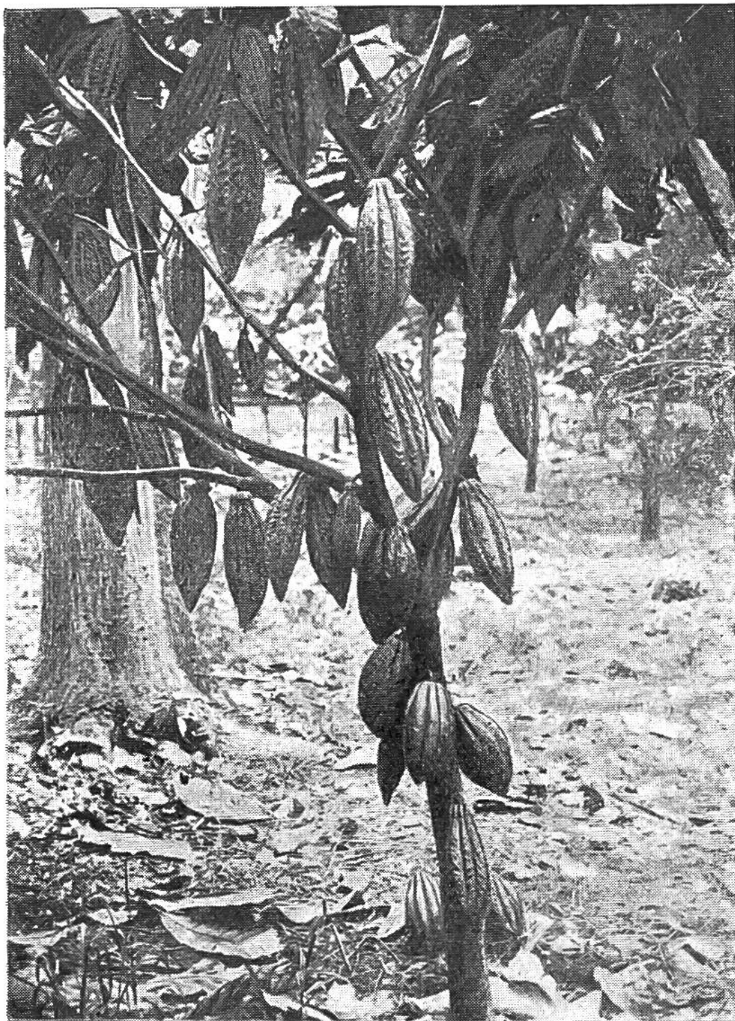
Die ersten verwendbaren Früchte des Kakaobaums erscheinen nicht vor dem 4. Jahr; im 12. Jahr erreicht der Baum seine höchste Kraft.

kaoernte blieb stets derselbe: Vom Stamm der 5–8 Meter hohen Bäume werden die wie rote Gurken aussehenden Früchte abgelöst, entzweigeschnitten und die 30–40 Samenkörner aus dem weichen, weisslichen Fruchtfleisch genommen. Diese Samenkörner sind die Kakaobohnen, die an der