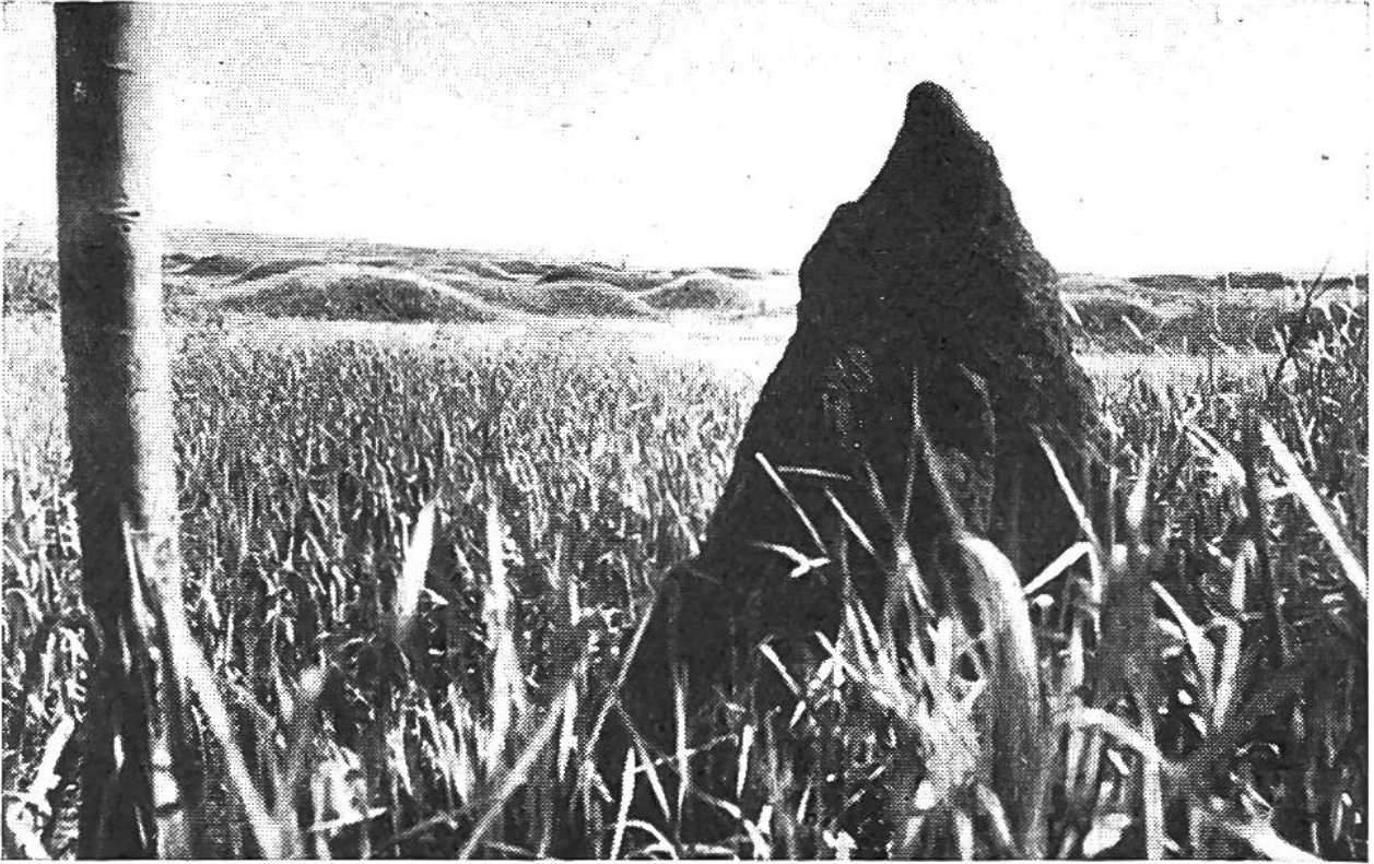
Übermannshoher Termitenhügel in der afrikanischen Steppe.