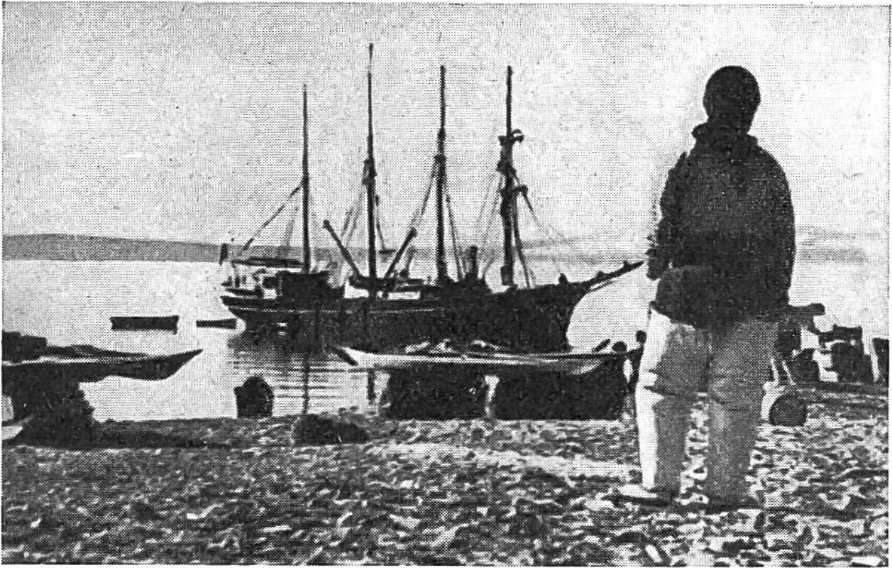
Die für die Eskimos wichtigen Lebensgüter werden ausgeladen.

sen einer der wildesten Schneestürme der dunklen Polarnacht tobt. In diesem einzigen Raum sitzen sie entblößten Oberkörpers beim Tranlicht und schmausen nach Herzenslust. Uns würde es wohl weniger munden; denn ihre Vorliebe für alle Arten rohen Fleisches, gefroren oder halbgefroren, entspricht nicht unseren Sitten. Auch erscheint es uns nicht gerade appetitlich, dass sie sich beim Essen der blossen Hände und eines eigenartigen Messers bedienen, mit dem sie die Bissen des mit den Zähnen gehaltenen Fleisches knapp vor den Lippen abschneiden. Die Eskimos besitzen, in primitiver Weise natürlich, einen ausgesprochenen Sinn für Musik, der sie befähigt, als eigene Komponisten und Dichter aufzutreten und sich auf einer Art kleiner Trommel geschickt zu begleiten.