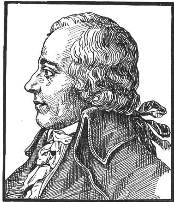
Pierre Simon Laplace,

(200. Geburtstag am 17. Mai) englischer Arzt, Begründer der Pockenschutzimpfung, * 17. Mai 1749 in Berkeley, † 26. Januar 1823 daselbst, war seit 1772 Wundarzt. Eine Bäuerin machte ihn darauf aufmerksam, dass Melker, die ungefährliche Kuhpocken gehabt hatten, gegen Menschenpocken (Blattern) unempfindlich seien. Diese Beobachtung führte Jenner zur Schutzimpfung, die er 1796 erstmals und mit Erfolg anwendete. Dank der bald in der ganzen Welt eingeführten Schutzimpfung ist die gefährliche Seuche, die in Europa jährlich ca. 400 000 Todesopfer gefordert hatte, heutzutage fast ganz verschwunden. Das engl. Volk ehrte Jenners Verdienste durch zwei grosse Geldspenden.