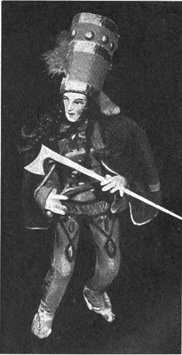
Puppe aus Polen, die Jan Sobek, einen Volkshelden, darstellt.

Totenbestattung, verwendete. Ursprünglich galten sie nämlich als Sinnbilder für gefürchtete oder gepriesene Gottheiten, wurden später – so besonders in Ostasien – zu geheiligten Ahnenbildern und erhielten schliesslich die aufgeprägten Charakterzüge von Verstorbenen oder wurden diesen als dienstbare Begleitung ins Grab gelegt. Dem vornehmen Ägypter wurde beispielsweise ein ganzer Hofstaat aus Tonfiguren in den Sarkophag mitgegeben und sollte dem Verstorbenen auf der Reise ins Jenseits zu Diensten stehen.