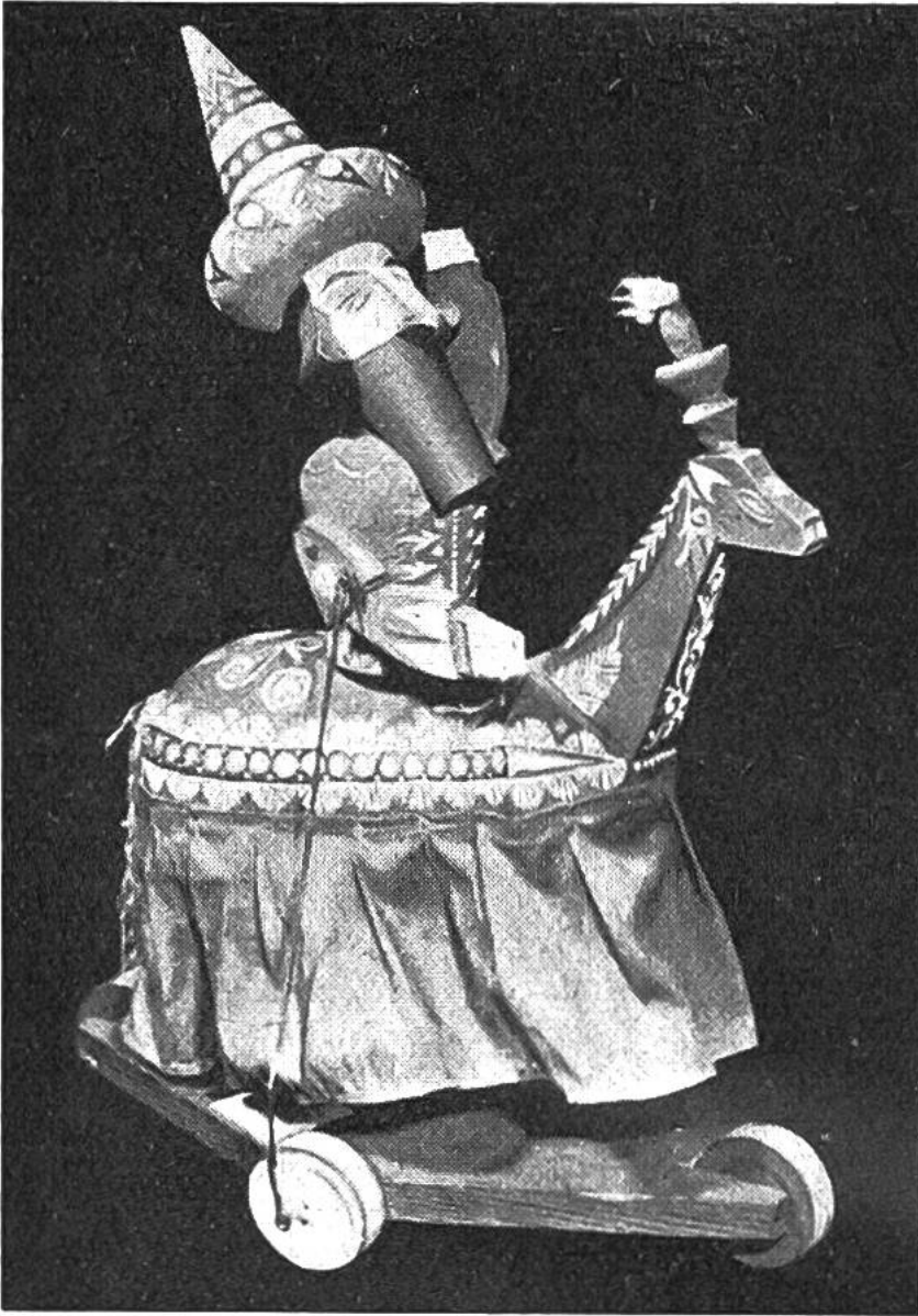
Ein chinesisches bewegliches Pupp- penspielzeug.

lichen Wesenheiten verloren hatte, konnte sie also zum Kinder-Spielzeug werden. Das altrömische Wort für ein Neugeborenes, „pupa“, wurde zum allgemein verwendeten Namen Puppe. Später setzte sich daneben das mittelalterliche Wort „tocke“ durch, welches wir in der Mundartbezeichnung Toggel wiedererkennen. Die ersten Spielpuppen wurden in Kindergräbern der Griechen und Römer, ganz vereinzelt auch in solchen der späten Ägypter gefunden. Im Mittelalter nahm ihre Hochschätzung zu, und der grosse Dichter Wolfram von Eschenbach pries sie zu verschiedenen Malen als Spielzeug seiner kleinen Tochter. Wie alte Bilder ersehen lassen, spielen alle Mädchen gern mit Puppen, besonders aber, wenn sie diese selbst kleiden können. Der deutsche Kaiser Karl V. liess 1530