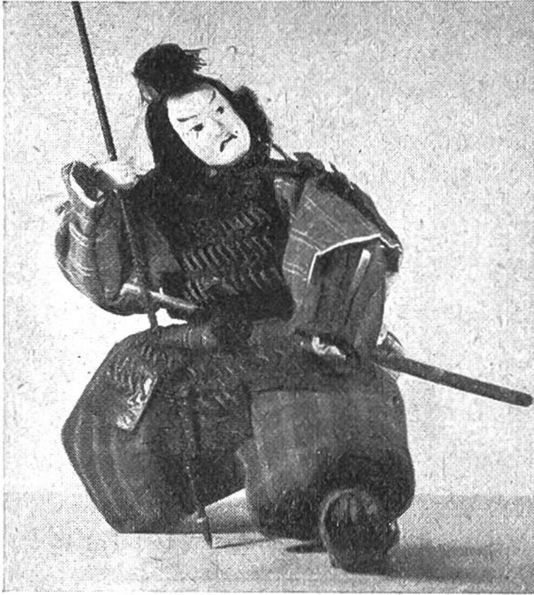
Eine japanische Kriegerpuppe.

trotz seiner Feindschaft gegenüber Frankreich aus Paris, das auf dem Puppenmarkt eine bevorzugte Stellung einnahm, für sein Töchterchen eine Puppe kommen und bezahlte einen hohen Preis.