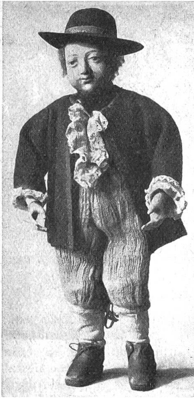
Puppe aus der Inner- schweiz (18.–19. Jahrhundert). (Schweiz. Landesmuseum, Zürich.)

es sind arm- und beinlose Puppen, deren klotziger Rumpf mit Kopf und Gliedern ein einziges Stück darstellt und höchstens durch Einritzungen eine gewisse Körpereinteilung aufweist. Aus dem Steinzeitalter fand man im Kurischen Haff an der Ostsee eingebaggerte Bernsteinfigürchen, welche noch völlig flach sind; erst viel später entstanden durch Modellieren in Ton die runden Körper mit immer noch geschlossenen Beinen und leisen Andeutungen der Arme. Fast durchwegs stellen sie, wie auch die heutigen Puppen, weibliche Figuren dar, während die seltenen männlichen Gestalten erst aus dem Ägypten der Jahre 2000 bis 1000 v. Chr. stammen, an Gewandung, Panzer und Helm erkennbar sind und ihre Nachkom-