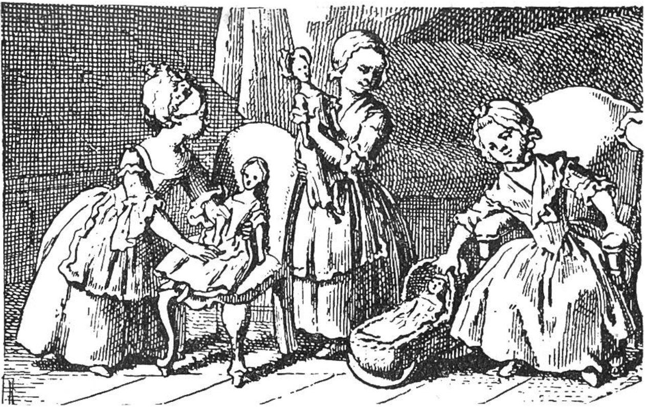
Spiel mit Puppen. Nach einer Zeichnung von Chodowiecki (1726–1801).