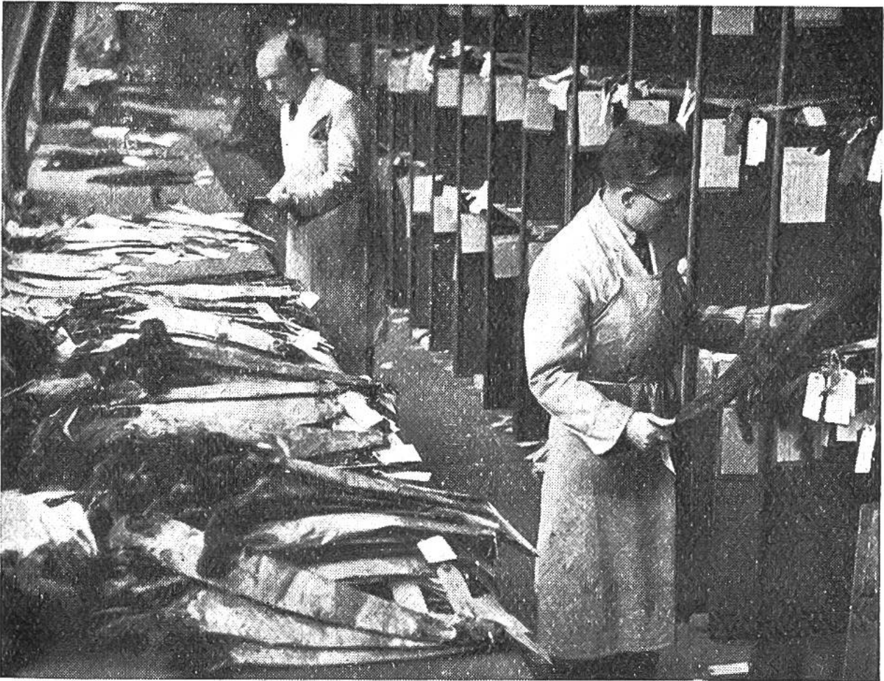
Spezialisten klassieren einzelne Nerzfelle.

reichen Büroangestellten, die telegraphisch mit aller Welt in Verbindung stehen, um Einkauf und Verkauf der kostbaren Felle zu regeln.