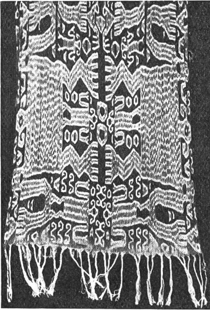
Im Ikat-Verfahren blau-weiss gemustertes Baumwolltuch mit stark stilisierten menschlichen Figuren.

Dies hat zur Folge, dass bestimmte Färbvorgänge sehr lange dauern. Für tiefe Blautöne benötigt man oft bis 2 Jahre und gewisse Rotfärbungen ziehen sich über 6–12 Jahre hin. Nun kennt man aus Asien und Amerika Ikatgewebe, die nicht bloss in einer, sondern in drei bis vier Farben gemustert sind. Sowohl die mühsamen Abbindarbeiten als auch die langwierigen Einfärbungen müssen in solchen Fällen entsprechend oft wiederholt werden. Frauen, die solche Verfahren erfunden haben und in so