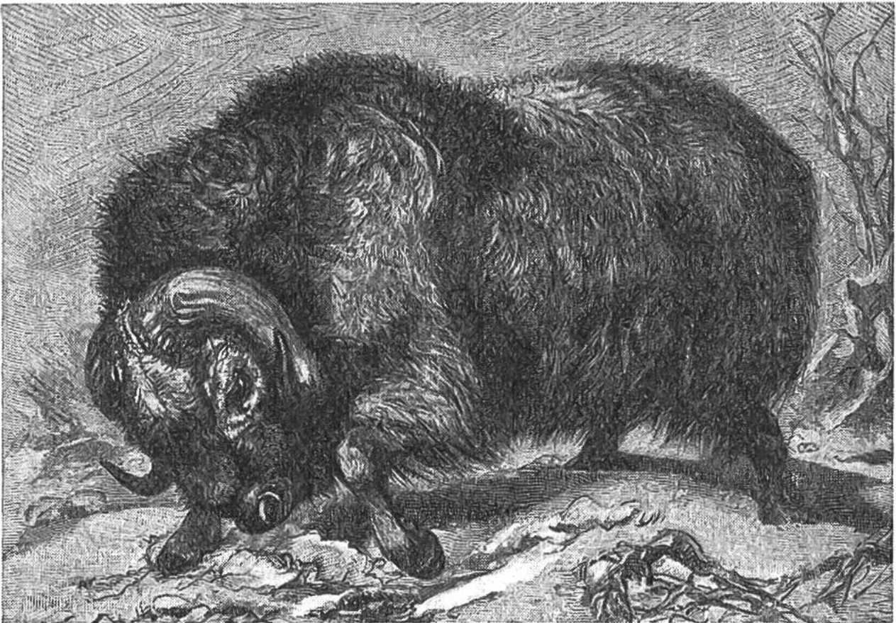
Moschusochse ( Ovibos moschatus ).

Heute kommt der Moschusochse nur noch in Grönland und auf den Inseln und Halbinseln nordwestlich der Hudsonbai vor. Von ihm kennen wir jedoch Knochenreste aus schweizerischen Kiesgruben, zum Beispiel von Schaffhausen und Olten, aus den Kantonen Aargau und Bern. Der am besten erhaltene Überrest ist ein unvollständiger Schädel von Schaffhausen, der im Museum dieser Stadt ausgestellt ist. Ferner wurde bei der ersten Ausgrabung der steinzeitlichen Siedlung von Thayngen bei Schaffhausen eine kleine Schnitzerei aus Rentiergeweih gefunden, die einen Kopf eines Moschusochsen darstellt.