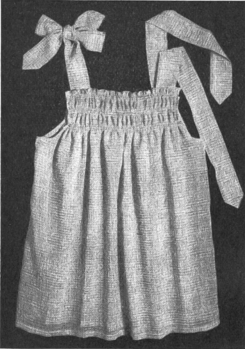
Das Trägerröckli aus Voile.

5. Die Träger sind auf eine fertige Breite von 3\frac{1}{2} cm zu nähen; das eine Ende wird jeweils zu einer Spitze ausgearbeitet. Die Träger werden in einem Abstand von 1 cm, vom Armloch aus gemessen, an Vorder- und Rückenteil angenäht.