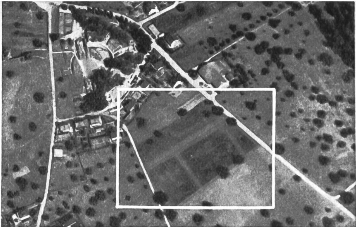
Fliegeraufnahme der alten Römerstadt Augusta Raurica. Im Pflanzenwuchs zeichnen sich helle Flecken und Linien ab, die das Vorhandensein von oberflächlich nicht mehr sichtbaren Gebäuderesten und Strassenzügen verraten.

übersehen. Was beispielsweise dabei herauskam, zeigen unsere beiden Abbildungen, bei denen es sich um ein Luftbild der alten Römerstadt Augusta Raurica bei Basel aus 1000 m Höhe und um einen vergrösserten Ausschnitt derselben Aufnahme handelt. Auf den ersten Blick fällt uns auf, dass sich an vielen Stellen, ganz besonders aber rechts unterhalb des Theaters (innerhalb des weiss umrahmten Rechtecks, das der Vergrösserung auf unserem zweiten Bild entspricht) merkwürdige Linien und Zeichen finden. Nun, die Erklärung ist nicht schwierig: hier stecken in der Erde überall römische Gebäudereste, die sich solcherweise abzeichnen. Der Beweis für die Richtigkeit dieser Behauptung ist schnell erbracht. An einigen Orten wurden die Mauerzüge bereits durch Sondierungen nachgewiesen, und der aufgenommene Plan stimmt haargenau mit den Zeichen an den betreffenden Stellen der Fliegeraufnahme überein.